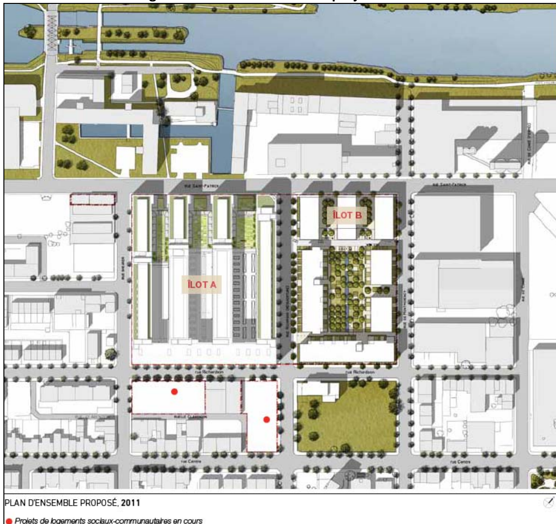
Figure 3 : Plan d'ensemble du projet de 2011