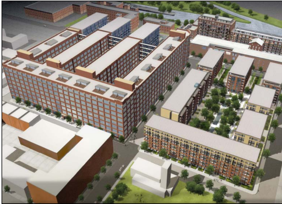
Figure 2 : Perspective et plan d'ensemble du projet de 2006