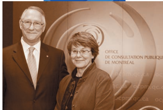
Table de concertation du Mont-Royal

Lors d'une rencontre de la Table de concertation du Mont-Royal, composée de représentants institutionnels, associatifs et municipaux, le 30 septembre 2005, un consensus est intervenu à l'effet que tous les décideurs exercent un devoir de précaution dans l'acceptation de projets afin que ces décisions n'hypothèquent pas les futures orientations de protection et de mise en valeur du Mont-Royal.