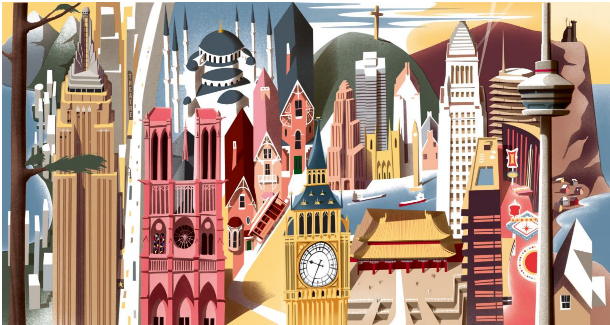
Illustration : Pascal Blanchet