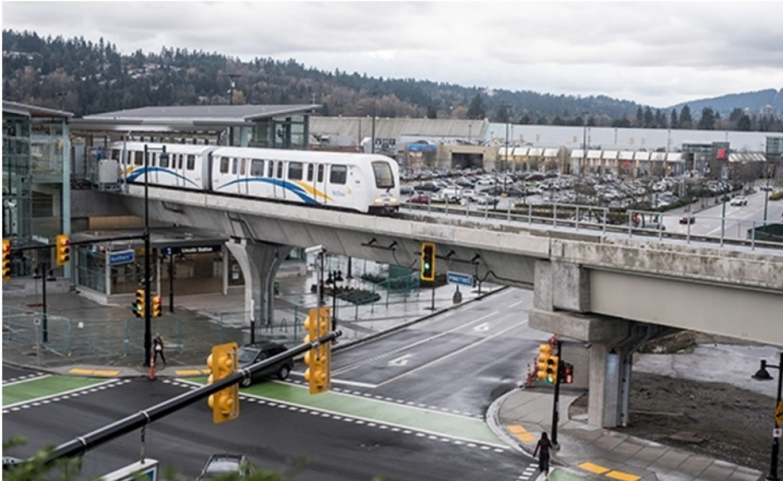
Skytrain - The Lincoln station in Coquitlam on the Evergreen Extension