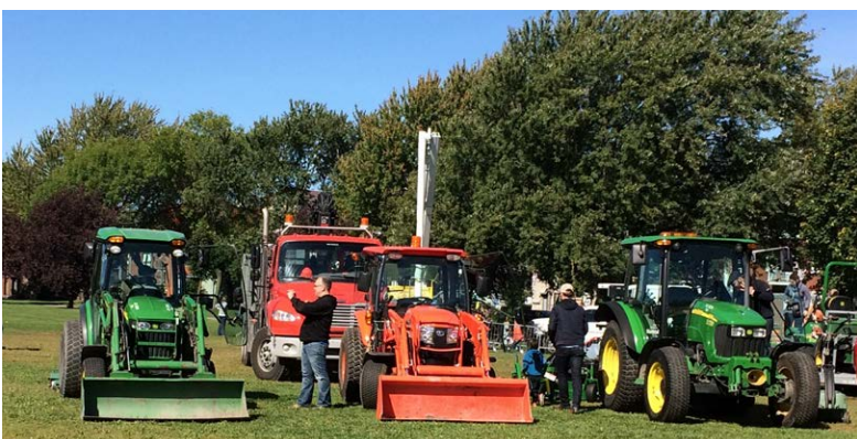
Démonstrations au parc Père-Marquette

Le 26 septembre 2015, l'arrondissement de Rosemont-La Petite-Patrie a ouvert les portes de ses Travaux publics au parc Père-Marquette. Les citoyens ont eu l'occasion de discuter avec les employés qui entretiennent au quotidien le quartier, les rues et les parcs. Une vingtaine de véhicules spécialisés, servant à l'entretien du territoire, ont été déployés en démonstration dans le parc.