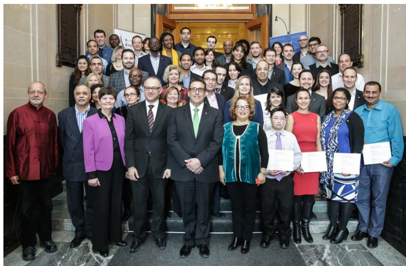
Remise des certificats aux stagiaires, parrains et marraines 2015-2016

Nombre de stagiaires en emploi à la Ville de Montréal : 158