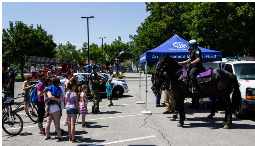
Journée des métiers et professions de Montréal-Nord

Le samedi 13 juin 2015, dans le cadre des célébrations du centenaire de Montréal-Nord, l'arrondissement a organisé une journée sur les métiers et professions dans le milieu municipal. Cette journée a permis aux citoyens de rencontrer des employés cols bleus, pompiers, policiers ainsi que des animateurs et des horticulteurs. Plusieurs activités ont été organisées dont une exposition de camions de pompiers et la démonstration de la réparation d'une conduite d'eau.