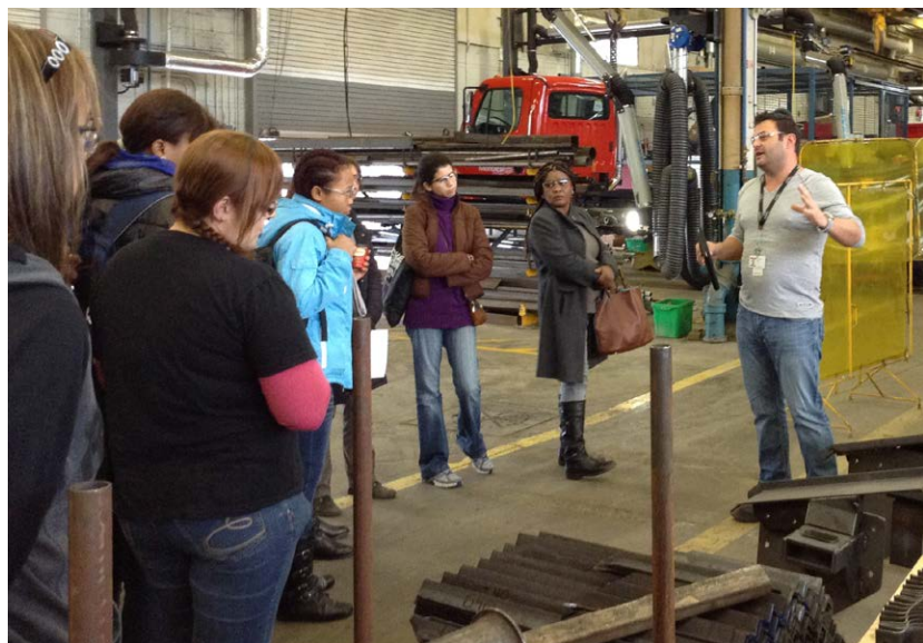
Visite aux ateliers municipaux

Depuis 2014, voici quelques-unes des actions prises par la Ville de Montréal, en collaboration avec le syndicat, afin de favoriser l'embauche des femmes dans les emplois de cols bleus.