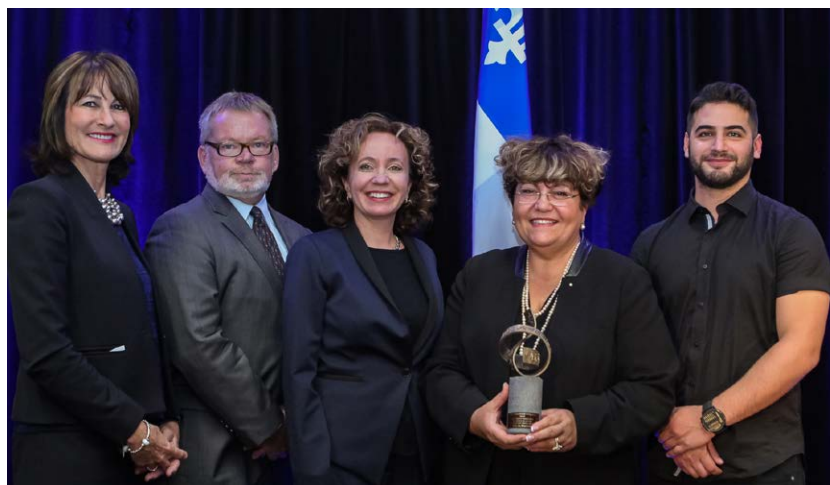
En 2015, la ministre Kathleen Weil a décerné le Prix Maurice-Pollack à la Ville de Montréal en reconnaissance de ses actions en matière de gestion de la diversité ethnoculturelle.

Le Service des ressources humaines assume un leadership dans la préparation du plan d'action de la Ville de Montréal et la réalisation d'actions stratégiques pour l'ensemble des unités. Son équipe dédiée à la diversité en emploi est responsable du suivi des indicateurs et des mesures corporatives. Les arrondissements et les services centraux mettent en œuvre des plans d'action qui prévoient des actions adaptées aux réalités locales. Ils ont nommé un responsable des ressources humaines qui assure le suivi de ces actions.