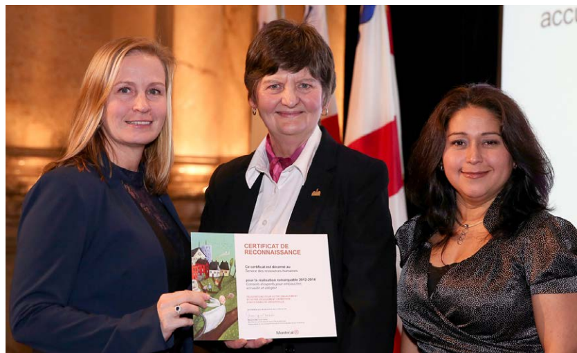
Remise du certificat de reconnaissance au Service des ressources humaines