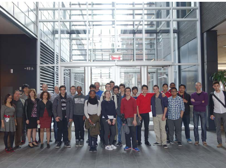
Groupe des Jeunes explorateurs d'un jour au Service des technologies de l'information