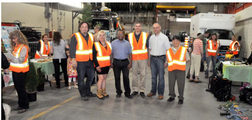
Portes ouvertes aux Travaux publics de Saint-Laurent

C'est dans le cadre de la Semaine nationale des travaux publics que les Travaux publics de Saint-Laurent ont ouvert leurs portes le 18 mai 2015. De 13 h à 17 h, les citoyens ont pu explorer les ateliers municipaux, discuter avec les travailleurs et voir de près la machinerie. Certains ont pu monter dans l'un des camions de l'arrondissement. L'arrondissement a profité de l'occasion pour mettre en évidence des femmes cols bleus.