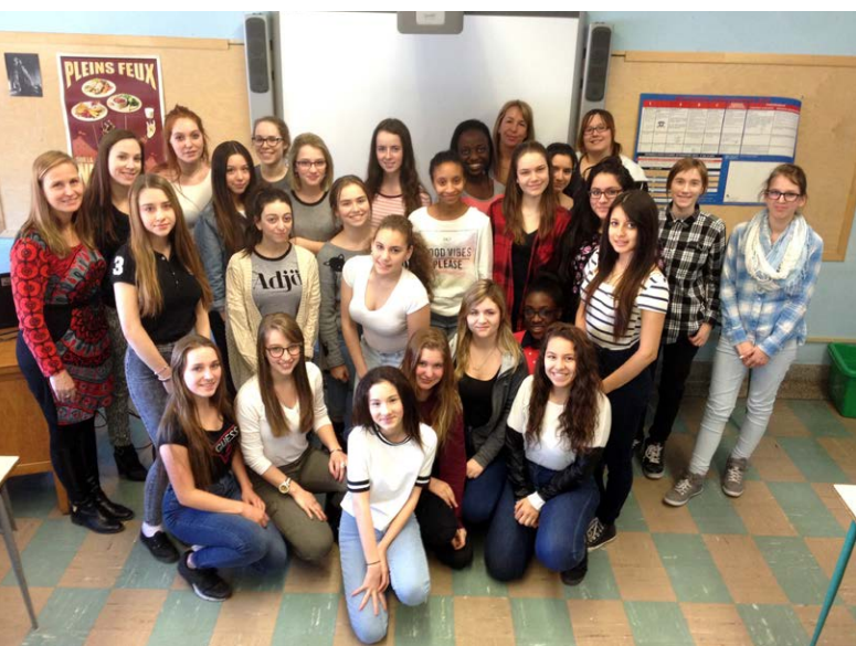
Présentation aux élèves de l'école secondaire Louise-Trichet

Avec la participation d'employées cols bleus, nous avons visité des écoles pour faire découvrir aux jeunes filles les métiers manuels de la Ville. En avril 2015, une formatrice du Service du matériel roulant et des ateliers et une menuisière de la Ville de Montréal ont fait la présentation de leur parcours professionnel et scolaire à 90 étudiantes du secondaire. La présentation d'une heure a suscité l'intérêt des jeunes filles pour les emplois à prédominance masculine. C'est à travers une présentation parsemée d'humour que les deux participantes ont fait découvrir leur métier.