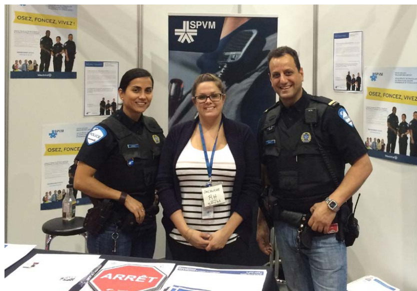
Policiers et recruteur du Service des ressources humaines à la Foire nationale de l'emploi de Montréal