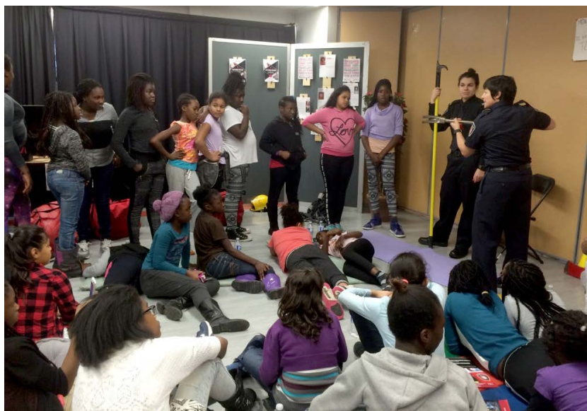
Visite de pompières à la Maison d'Haïti

Jusqu'en 2001, la Ville de Montréal comptait très peu de pompières. Parmi les pompiers, en 1987, il n'y avait aucune femme à la Ville de Montréal. En décembre 1996, la Ville employait deux pompières et ce nombre est demeuré stable jusqu'aux fusions municipales. Au 31 décembre 2015, la Ville de Montréal comptait 31 femmes dans l'accréditation des pompiers, soit 1,3 %. La Ville de Montréal prévoit entre 70 et 100 embauches de pompiers par année de 2016 à 2019. Il s'agit d'une opportunité intéressante pour diversifier le personnel. Toutefois, un des défis consiste à intéresser les femmes à la formation dans le domaine de la sécurité incendie.