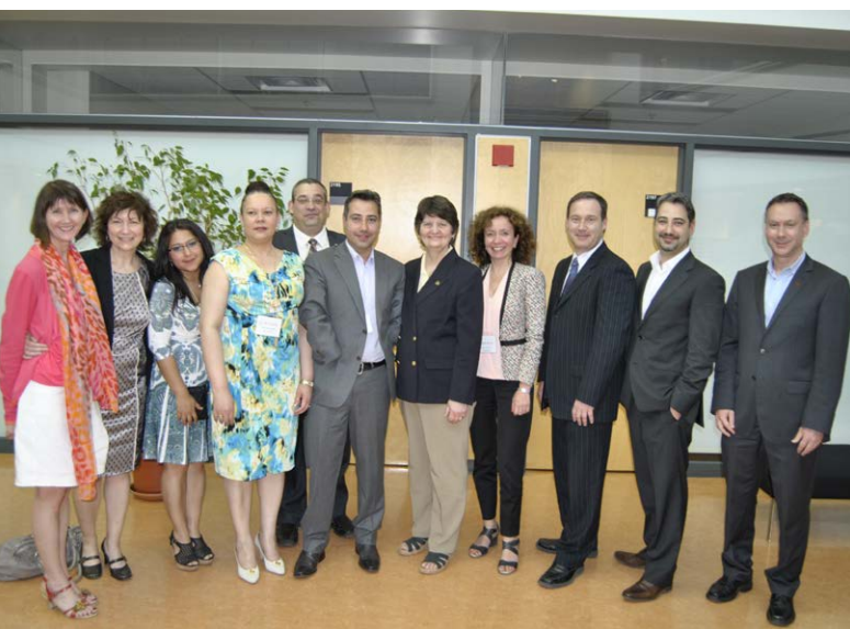
Soirée Mon parcours! Ma carrière!

En 2014, à l'occasion de la Semaine québécoise des personnes handicapées, la Ville de Montréal a participé à l'organisation de la remise des Prix Mon parcours! Ma carrière! qui soulignent le parcours en emploi remarquable de personnes en situation de handicap.