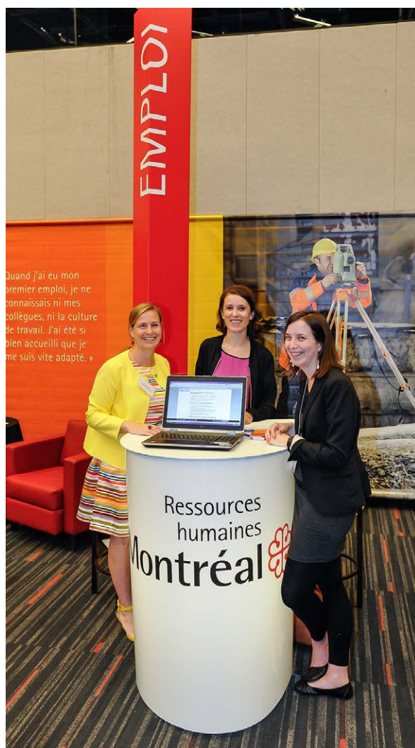
Kiosque de l'emploi au Salon de l'immigration