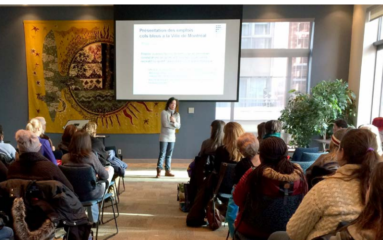
Séance d'information sur les emplois de préposées aux travaux généraux

Depuis 2015, nous réalisons une campagne annuelle d'information pour inviter les femmes à déposer leur candidature. À cet effet, nous avons créé une fiche d'information, en plus de faire paraître des annonces dans le journal Métro et dans les stations de métro. Nous sommes aussi allés à la rencontre des femmes immigrantes au Salon de l'immigration et de l'intégration au Québec. En janvier, nous organisons une journée d'information pendant la période de recrutement des préposées aux travaux généraux. Ainsi, nous avons réuni 104 femmes dont la plupart ont montré un fort intérêt pour l'emploi.