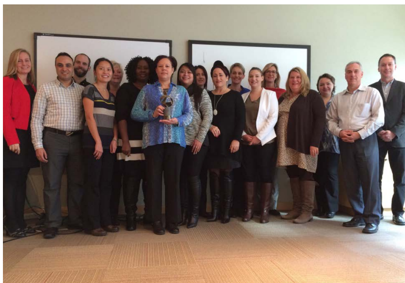
Les responsables de la diversité en emploi

Les arrondissements et les services centraux ont désigné un cadre en ressources humaines en tant que responsable du dossier de la diversité en emploi et de la mise en œuvre des mesures locales. Ces responsables se réunissent quelques fois par année afin de discuter de stratégies et d'échanger sur les pratiques expérimentées dans leurs unités clientes. Lors de ces rencontres, le groupe a notamment accueilli des invités spécialistes de l'accessibilité universelle, de l'emploi des autochtones à Montréal, de la communauté arabo-musulmane de Montréal, de l'égalité au travail entre les femmes et les hommes et de la Stratégie jeunesse montréalaise.