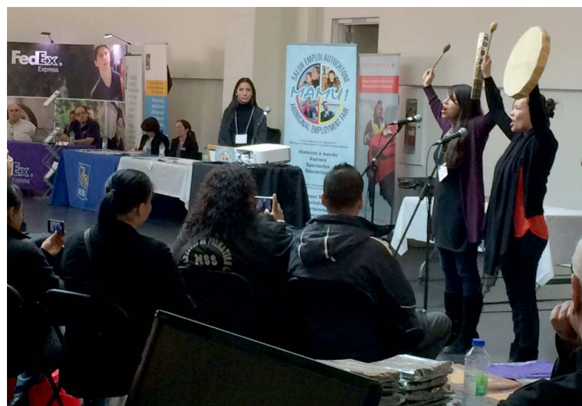
Le groupe Odaya au Salon MAMU!

Le Service des ressources humaines est fier de participer depuis 2010 à l'organisation du seul salon d'emploi autochtone au Québec. Ce salon, réalisé en partenariat avec le Cercle de l'éducation et de l'employabilité du RÉSEAU pour la Stratégie urbaine de la communauté autochtone à Montréal, est devenu un rendez-vous incontournable pour la communauté autochtone de Montréal. MAMU!, qui signifie « ensemble » en langue innue, a pour objectif d'éliminer les barrières à l'intégration des autochtones au marché du travail et de promouvoir les programmes de formation.