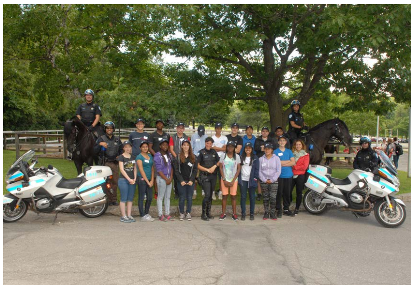
Participants à Classes Affaires

La Ville de Montréal s'implique aussi dans des programmes qui visent l'insertion professionnelle des jeunes, le développement de leurs compétences ou l'exploration de carrières. Ainsi, les unités de la Ville accueillent plus de 110 jeunes lors de stages d'observation effectués dans le cadre de Classes Affaires et de l'initiative Jeunes explorateurs d'un jour.