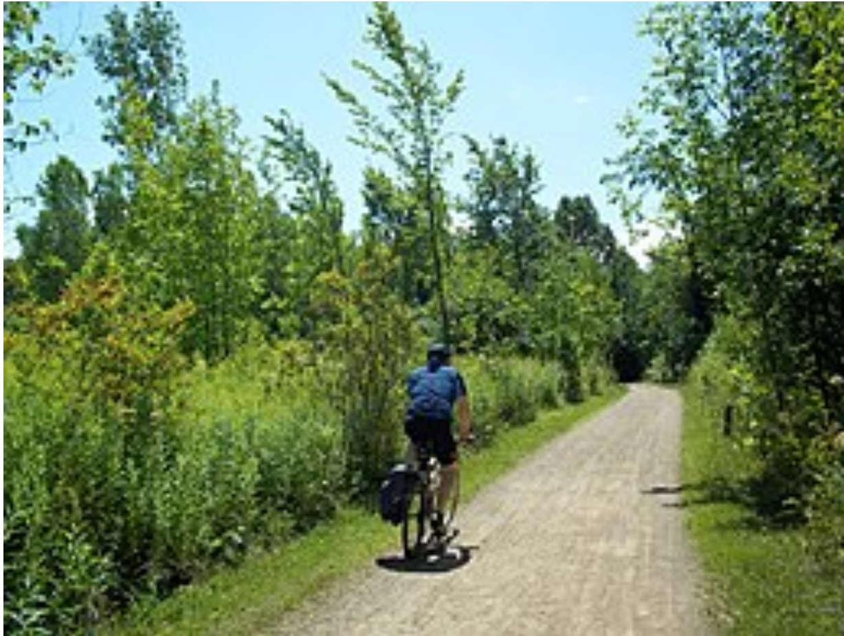
Bois-de-l'Île-Bizard Nature Park