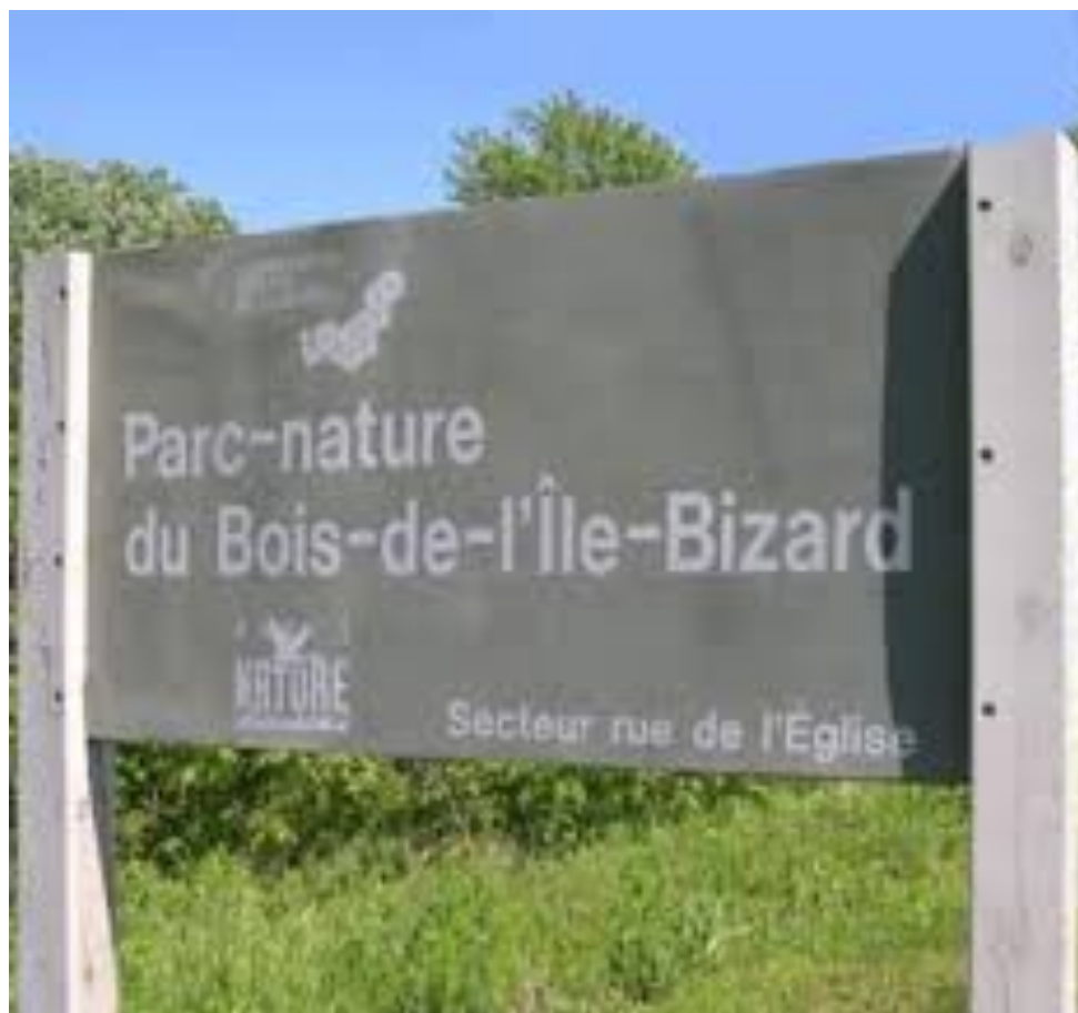
Bois-de-l'Île-Bizard Nature Park