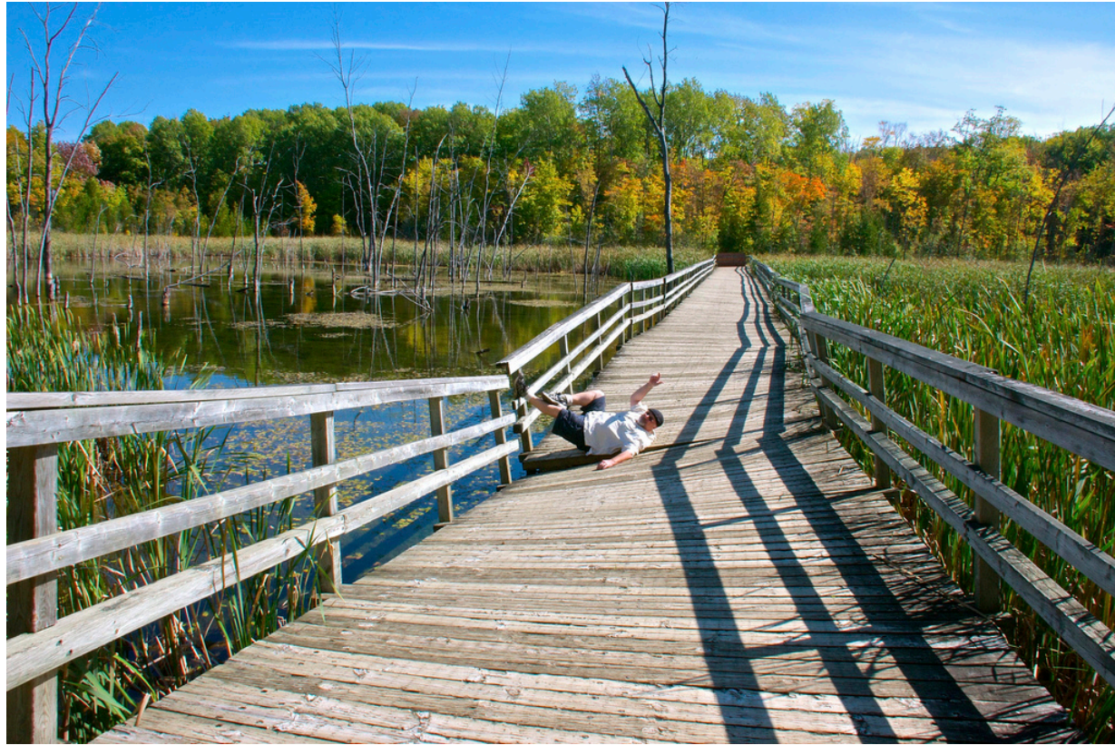
Bois-de-l'Île-Bizard Nature Park