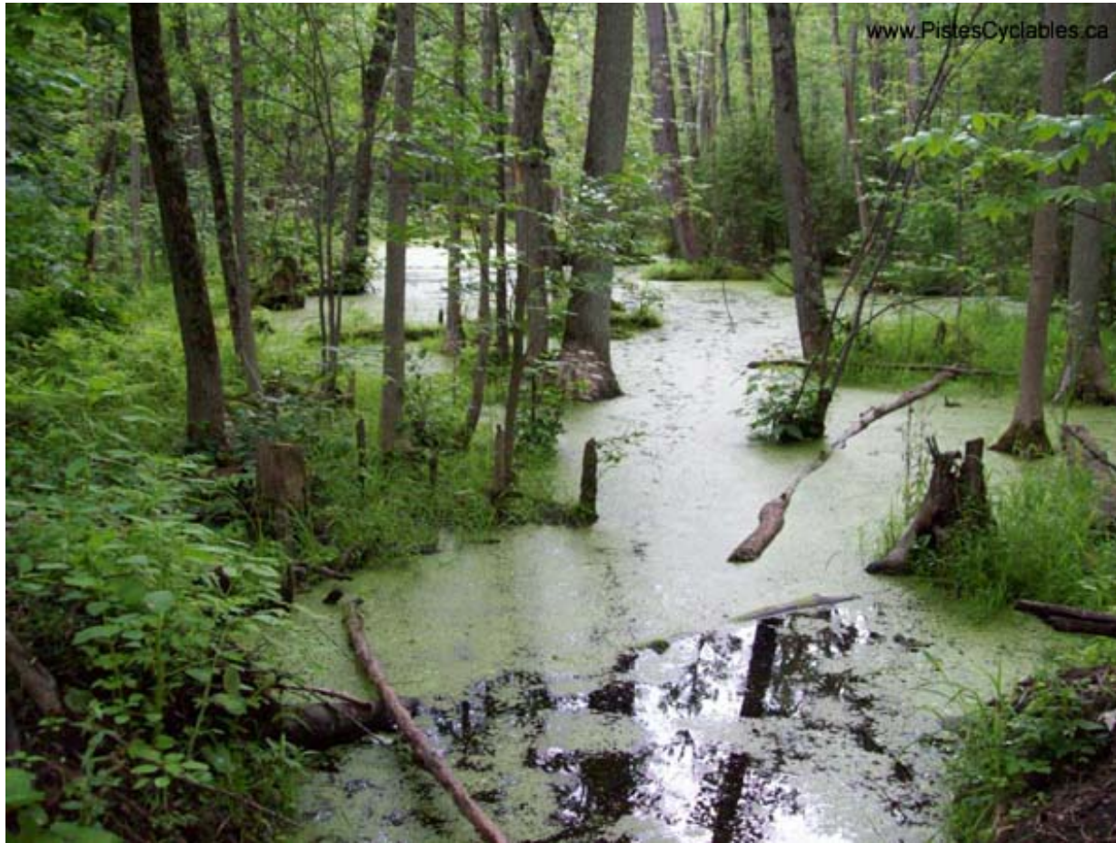
Bois-de-l'Île-Bizard Nature Park