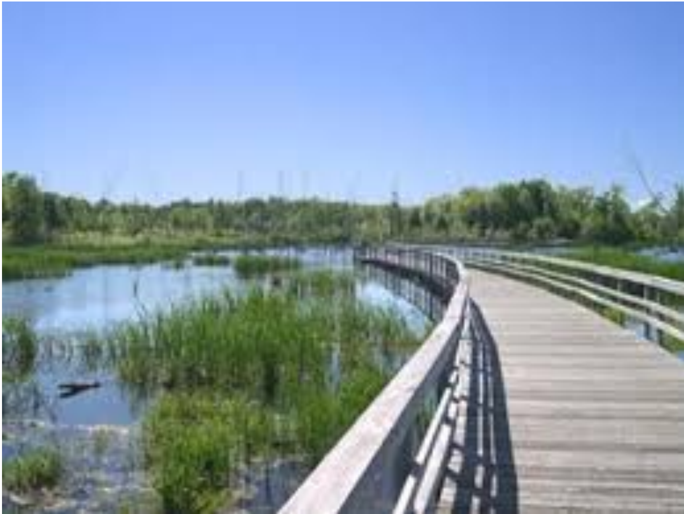
Bois-de-l'Île-Bizard Nature Park