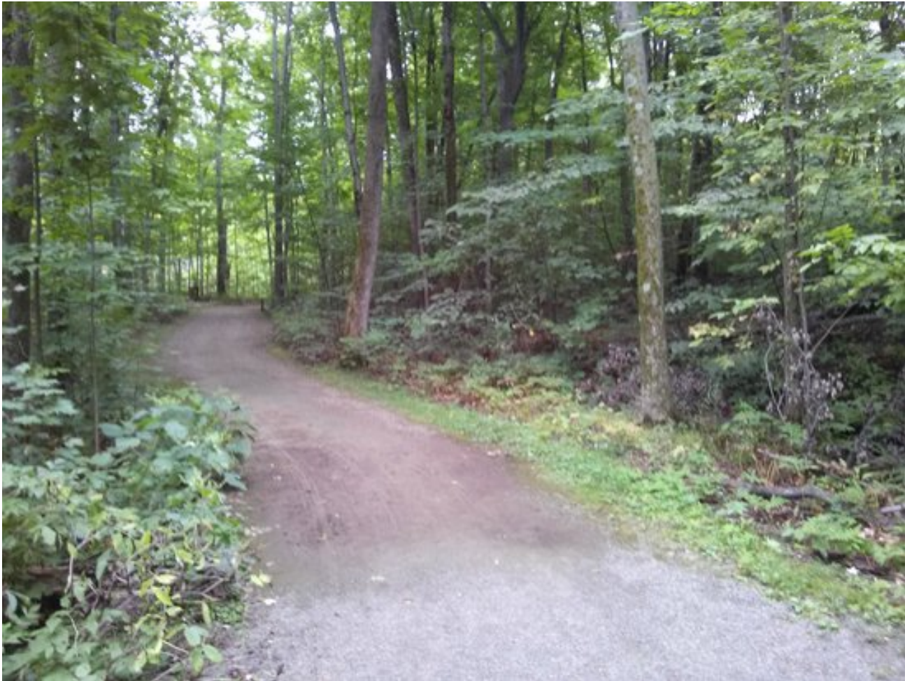
Bois-de-l'Île-Bizard Nature Park