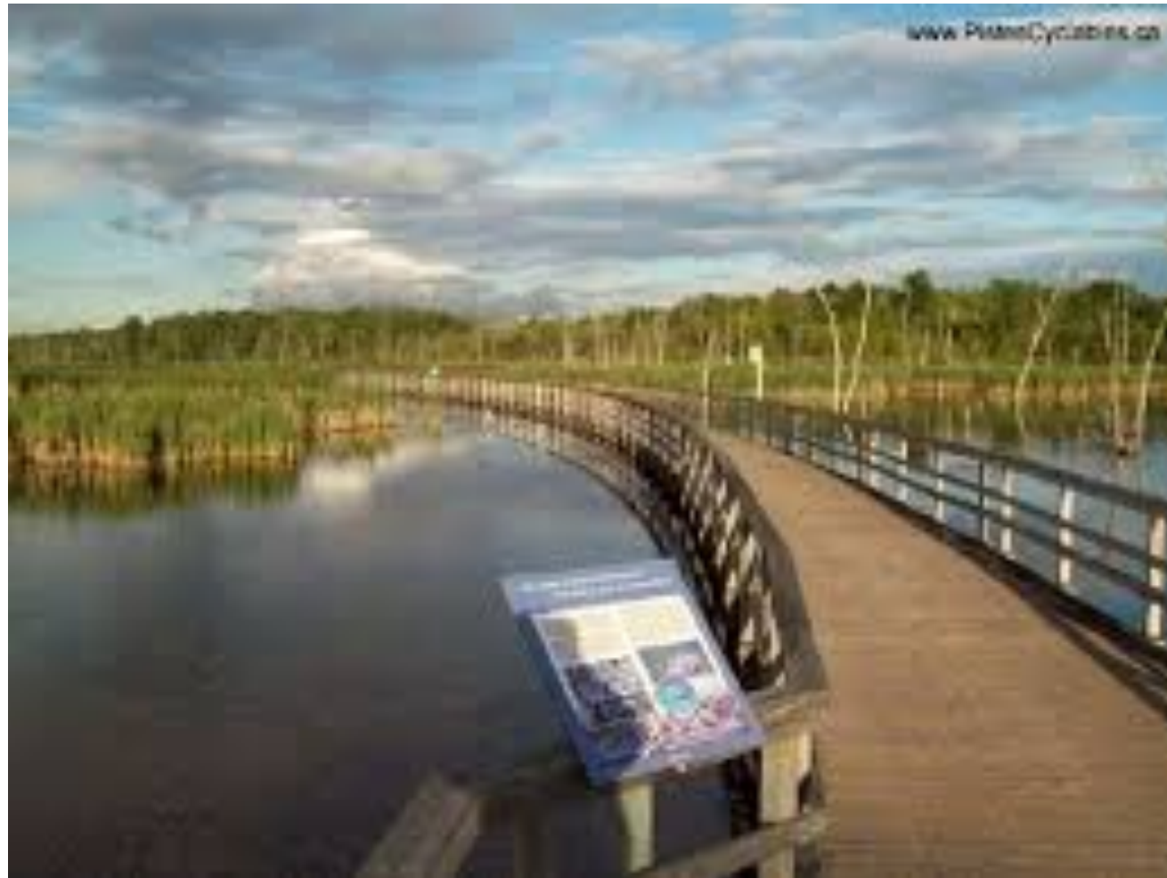
Bois-de-l'Île-Bizard Nature Park