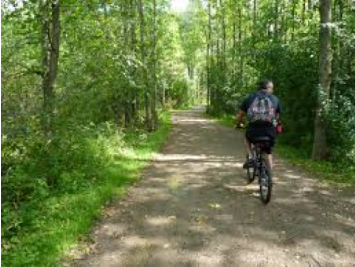
Bois-de-l'Île-Bizard Nature Park