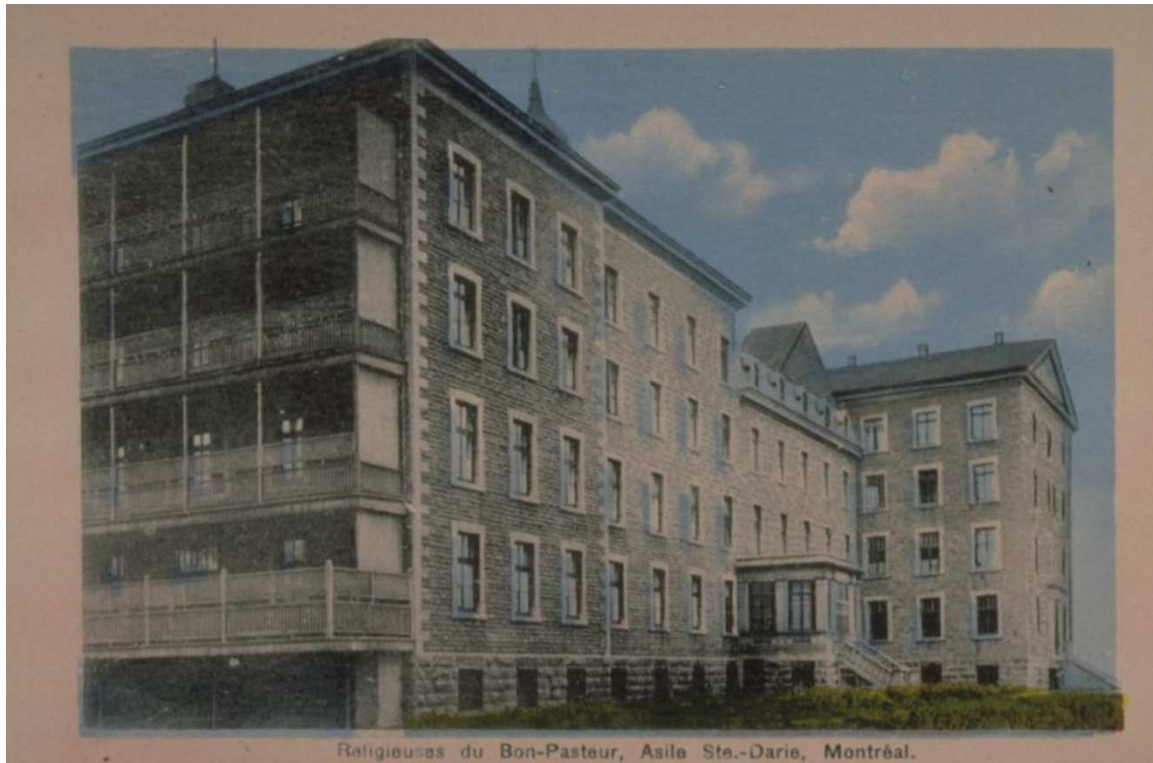
Figure 2. Prison pour femmes, maison Sainte-Darie, remplacée en 1969 par l'édifice Wilfrid Derome (SQ)

Peu à peu, le sud de la rue Logan connaît une occupation industrielle croissante en lien avec le port et les bâtiments de fort gabarit se distinguent du bâti résidentiel de taille plus modeste des secteurs situés de part et d'autre. Cette différence devient d'autant plus apparente au moment de la construction du pont Jacques-Cartier, qui vient renforcer la coupure entre les secteurs résidentiels est et ouest.