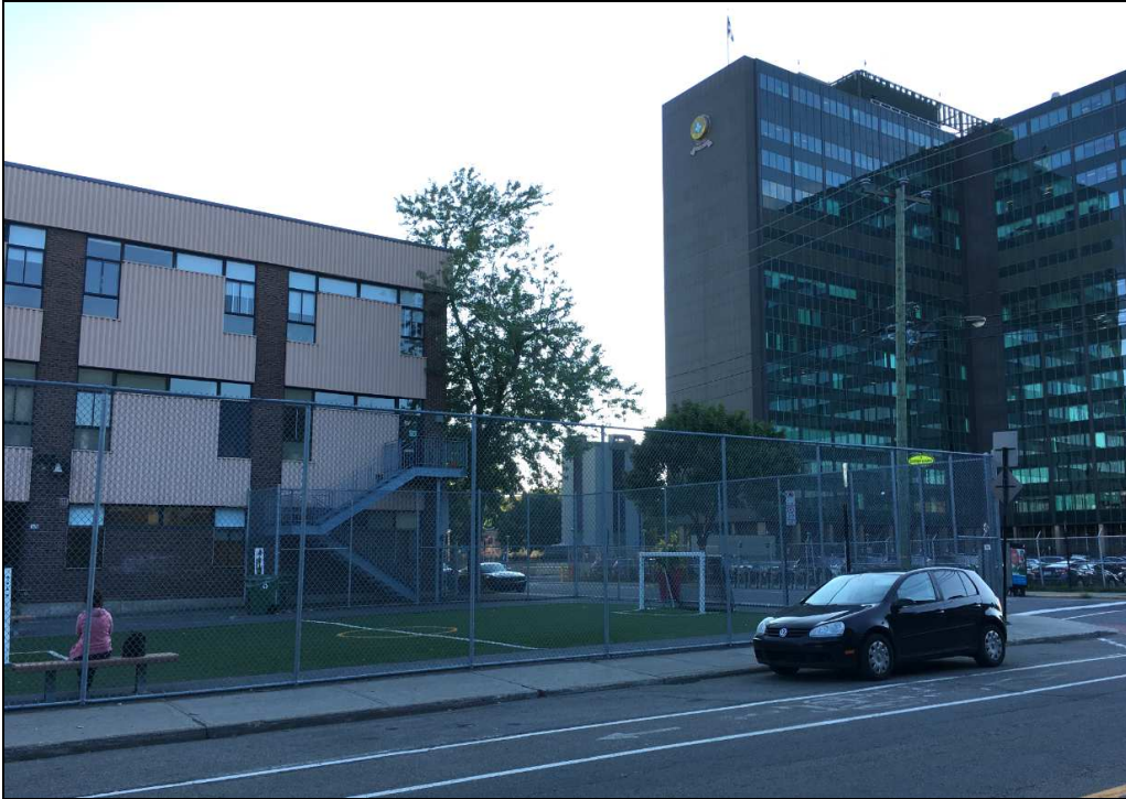
Figure 5. Absence de dialogue entre l'école Champlain et l'édifice Wilfrid Derome (SQ). Le cadre bâti en recul ne contribue pas non plus à l'animation du domaine public