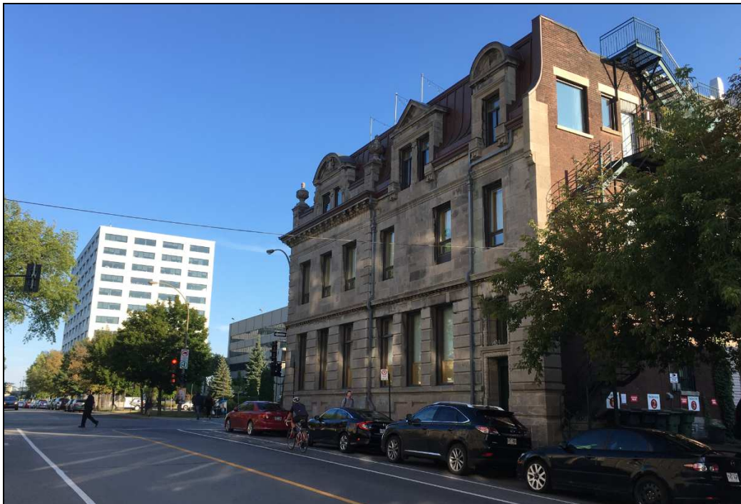
Figure 4. Rue Fullum, cohabitation entre le bâti traditionnel et les grands ensembles institutionnels

La vocation industrielle du secteur, quoique disparue, a laissé plusieurs traces perceptibles dans la cohabitation entre l'architecture résidentielle vernaculaire et les bâtiments institutionnels de grande taille.