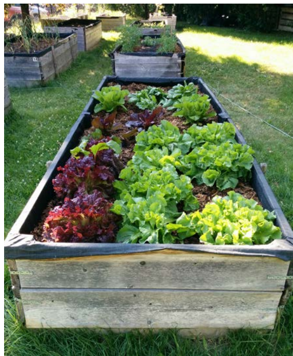
Jardin en bacs

Des jardins au sol et en bac adaptés pour les personnes à mobilité réduite pourraient être aménagés de part et d'autre du verger. L'installation d'une serre comme lieu d'animation pourrait bonifier l'offre d'opportunité éducative. Une culture de houblon, en plus de délimiter les espaces, pourrait s'inscrire dans la révolution brassicole montréalaise.