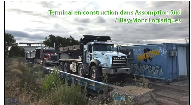
Terminal en construction dans Assomption Sud / Ray-Mont Logistiques

Ensuite, le terminal d'Assomption-Sud serait construit en respectant beaucoup plus son voisinage, par rapport à Pointe Saint-Charles, grâce à des normes plus modernes et aux possibilités accrues d'un plus grand terrain.