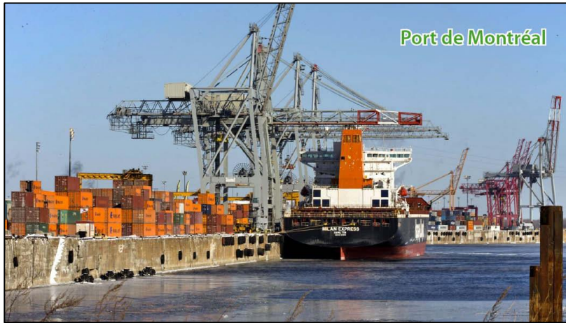
Port de Montréal

Nombreux, bruyants et polluants, ces camions traversent plusieurs quartiers populeux, dont le centre-ville.