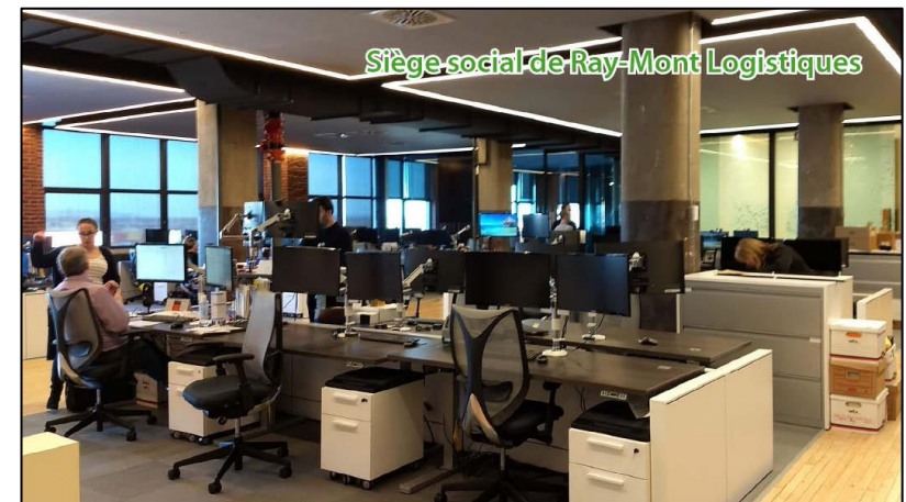
Siège social de Ray-Mont Logistiques