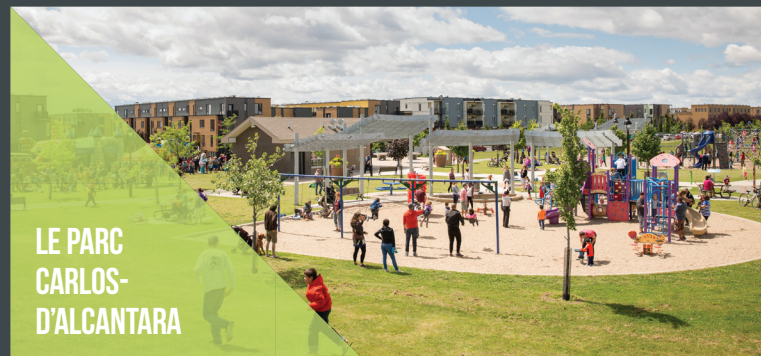
LE PARC CARLOS- D'ALCANTARA

Un parc comprenant un mur d'escalade, des modules d'exercices pour les adultes et les aînés, des aires de jeu pour les jeunes enfants et adolescents, des jeux d'eau et un terrain de basket-ball.