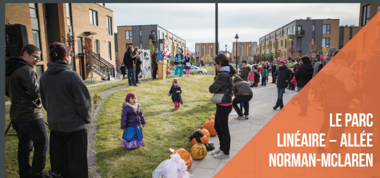
LE PARC LINÉAIRE – ALLÉE NORMAN-MCLAREN

À l'automne 2015, un projet de plantation de plus de 1 750 arbres et arbustes a été réalisé par la Société de verdissement du Montréal-métropolitain (Soverdi) et le Conseil régional de l'environnement de Montréal (CRE-Montréal) sur le talus de la Carrière Lafarge situé à la limite Est du parc Carlos-D'Alcantara.