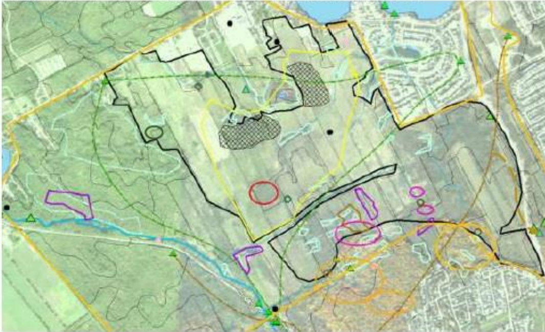
Localisation d'espèces menacées, vulnérables ou susceptibles d'être désignées