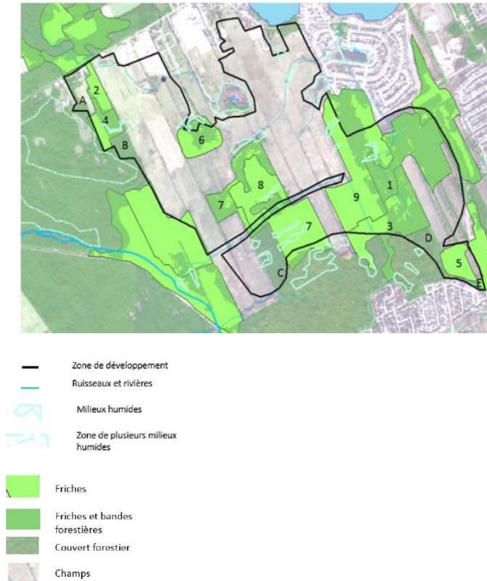
Figure 1 Localisation du couvert forestier, des friches et des champs dans la zone de développement