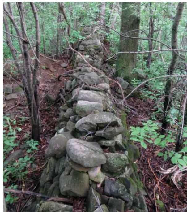
Photo d' un muret sur le territoire de Cap-Nature