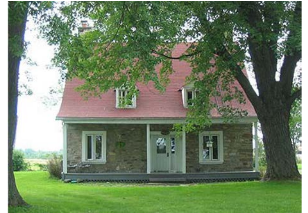
Le Petit Fort, 19 530 Boulevard Gouin