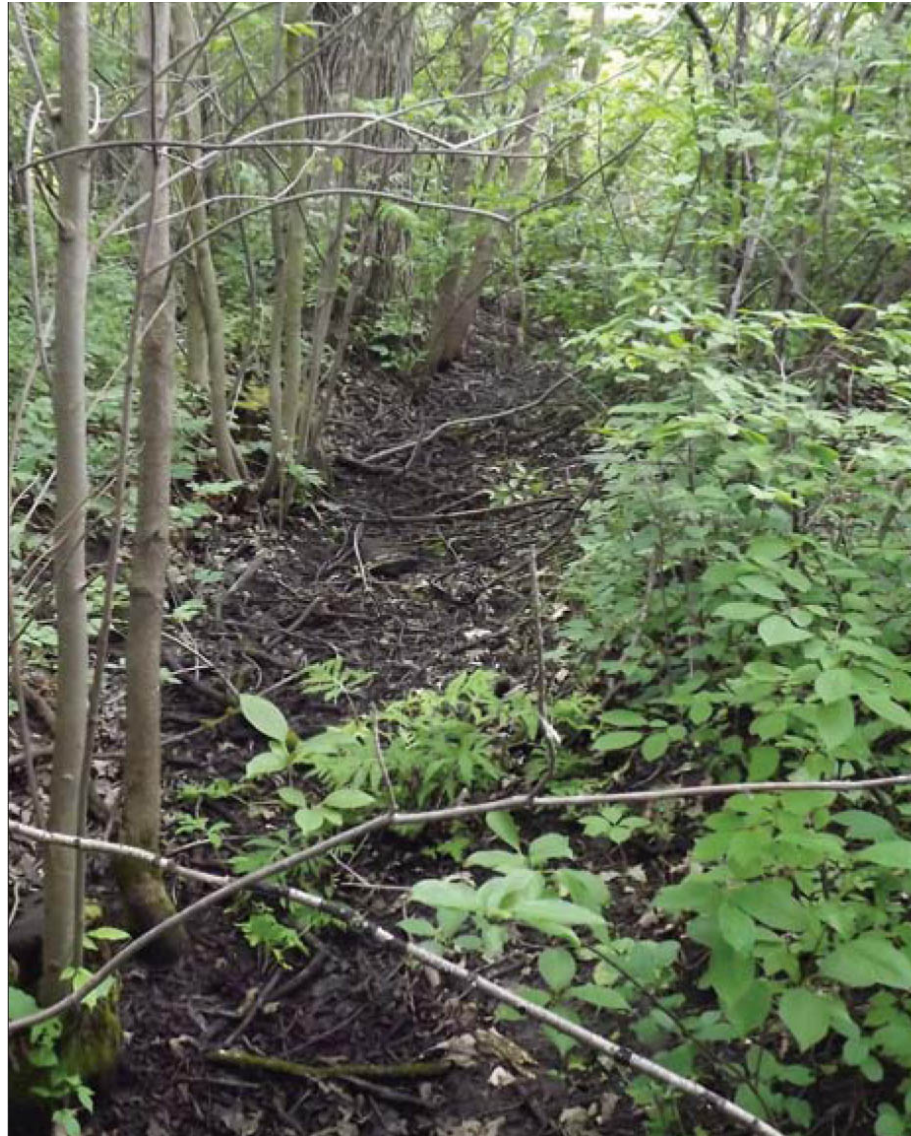
Photo d' une noie typique