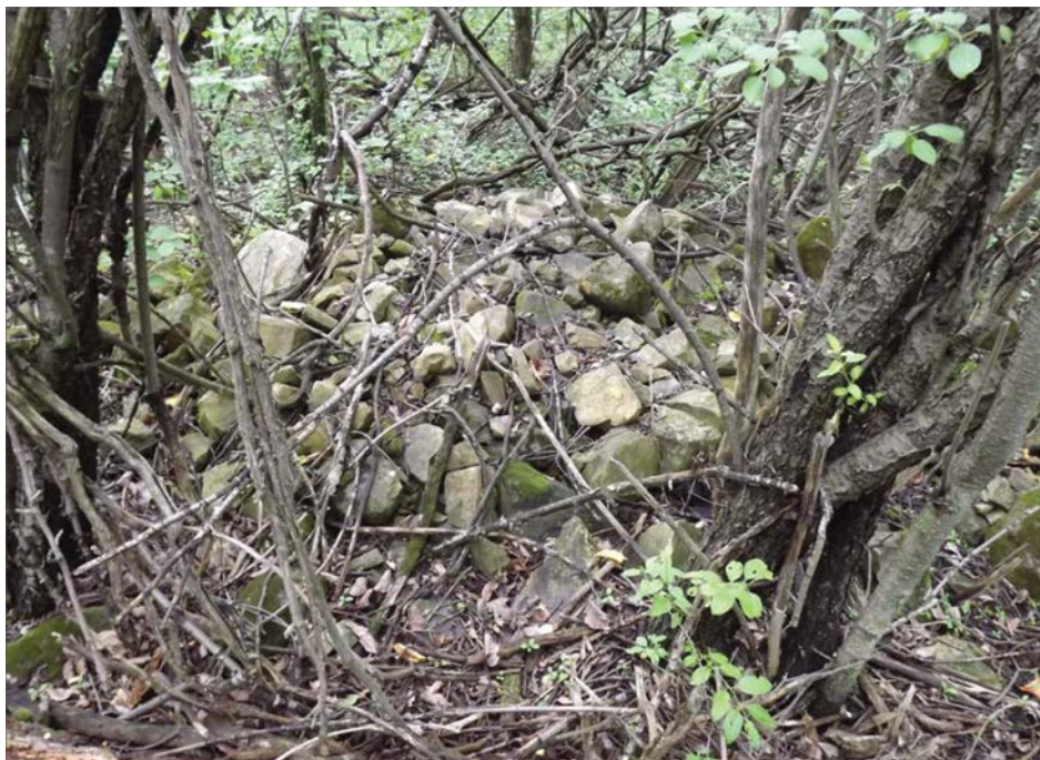
Photo d' un enrochement sur le territoire de Cap-Nature