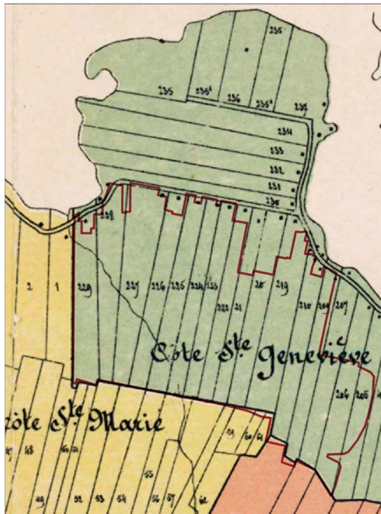
Carte de H. Malingre en date 1890 démontrant la subdivision du territoire