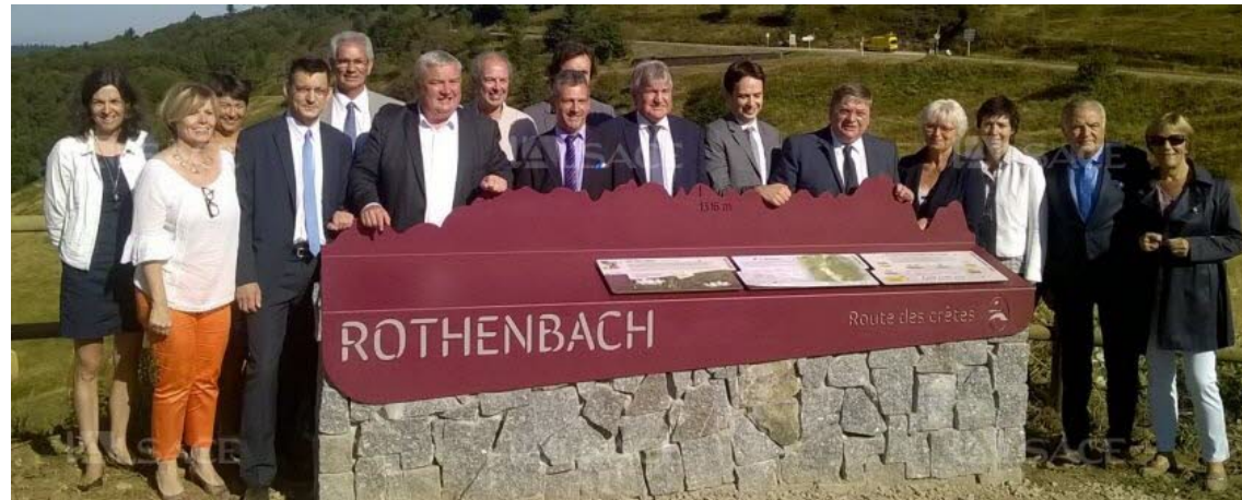
Exemple d'intégration d'un muret à une stratégie d'interprétation patrimoniale