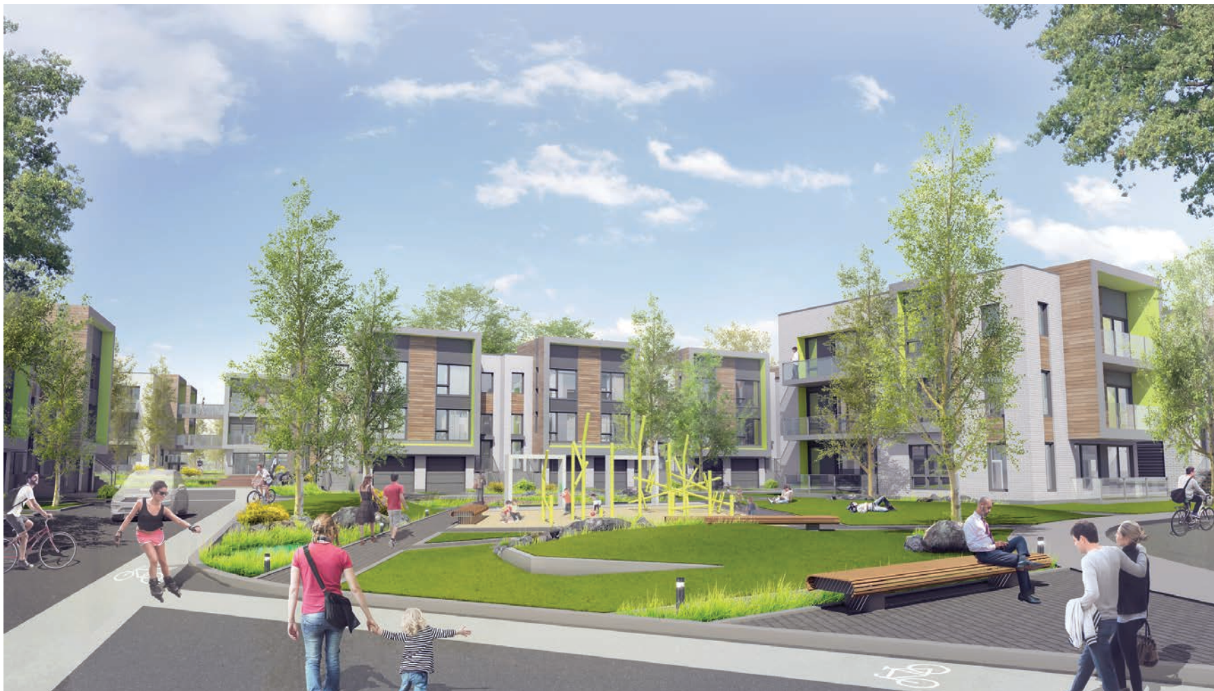
Image démontrant le type de densité maximale à l'intérieur de la zone de protection du patrimoine régie par le PIIA des Parcours Riverains des Boulevards Gouin Ouest et Lalande