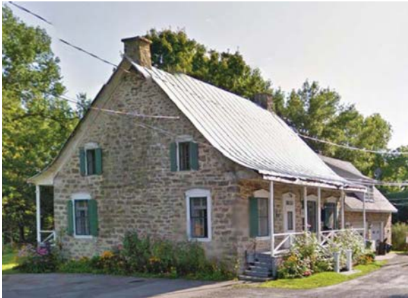
La maison Pilon, 21 285 Gouin Ouest