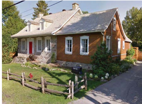
La maison J-Poudret 20 752 Gouin Ouest