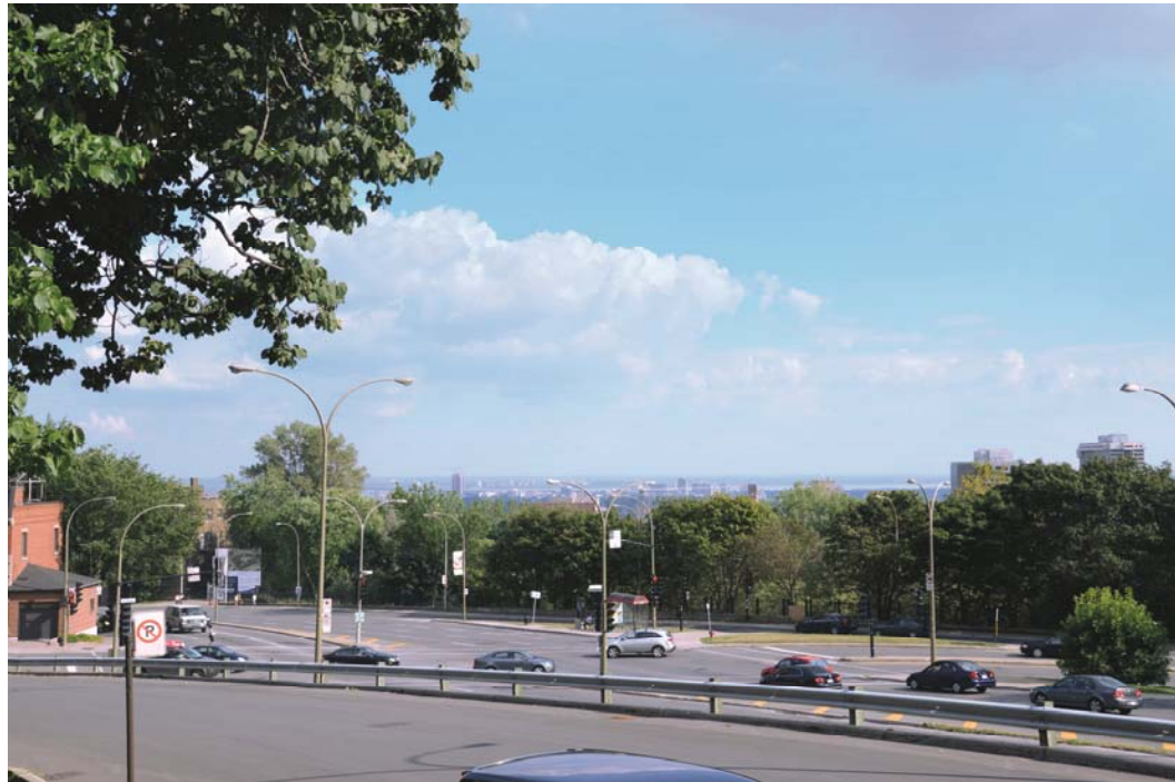
Vue identifiée au Plan d'urbanisme