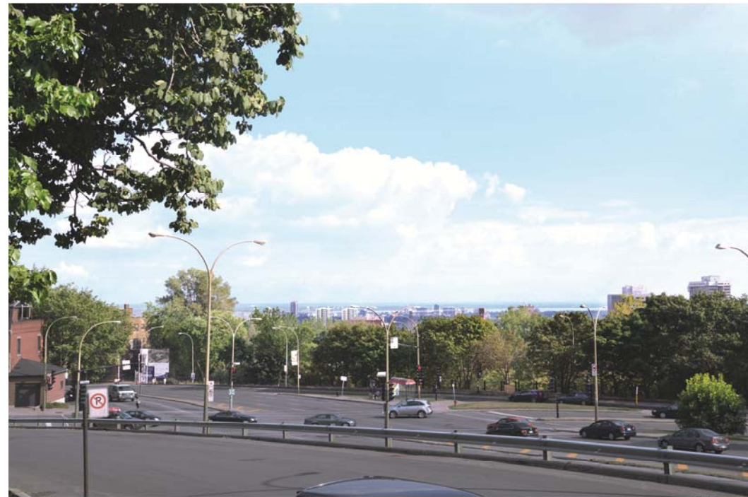
Montage incluant les 2 tours proposées