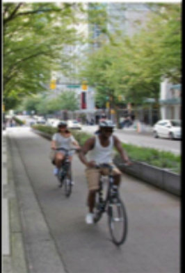
Separated Bike Lane