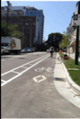
Buffered Bike Lane