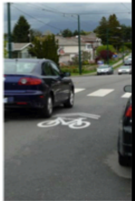
Shared Use Lane