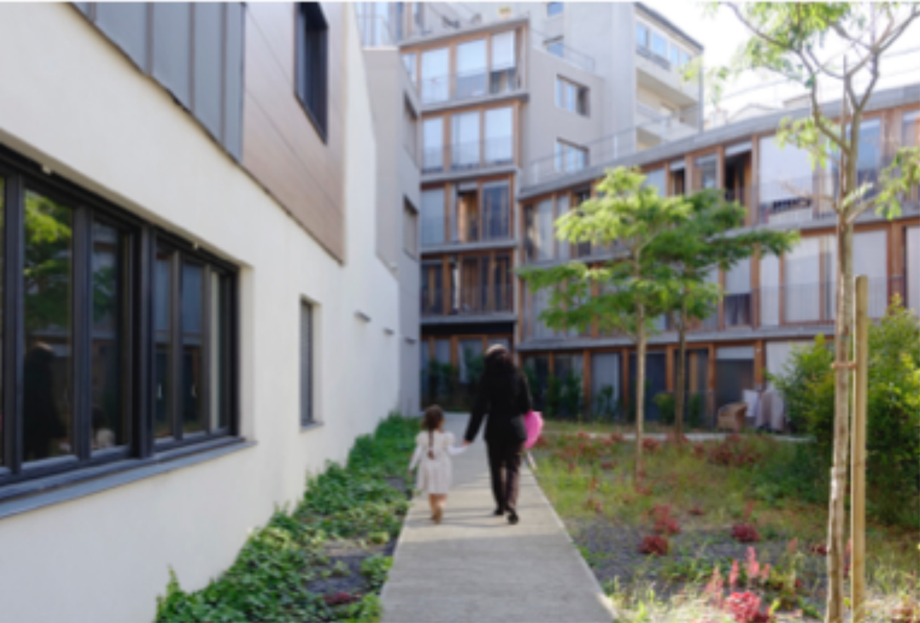
Coquartier Fréquel-Fontarabie, Paris (France), aménagement urbain : Eva Samuel architectes et associés; logements : Armand Nouvet NR architectes.