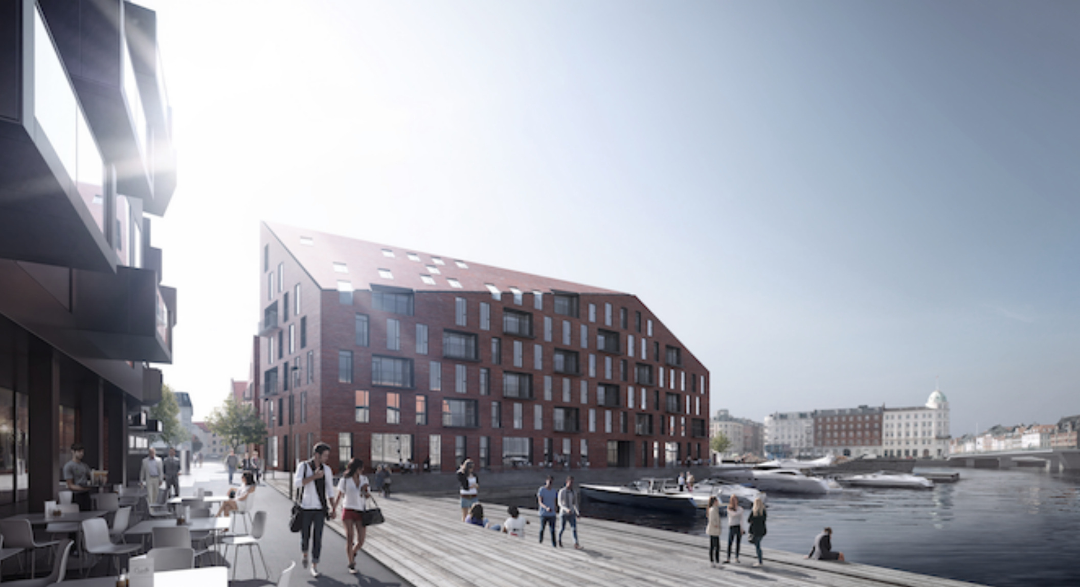
Myers Plads, Copenhagen (Denmark), COBE and Vilhelm Lauritzen Architects