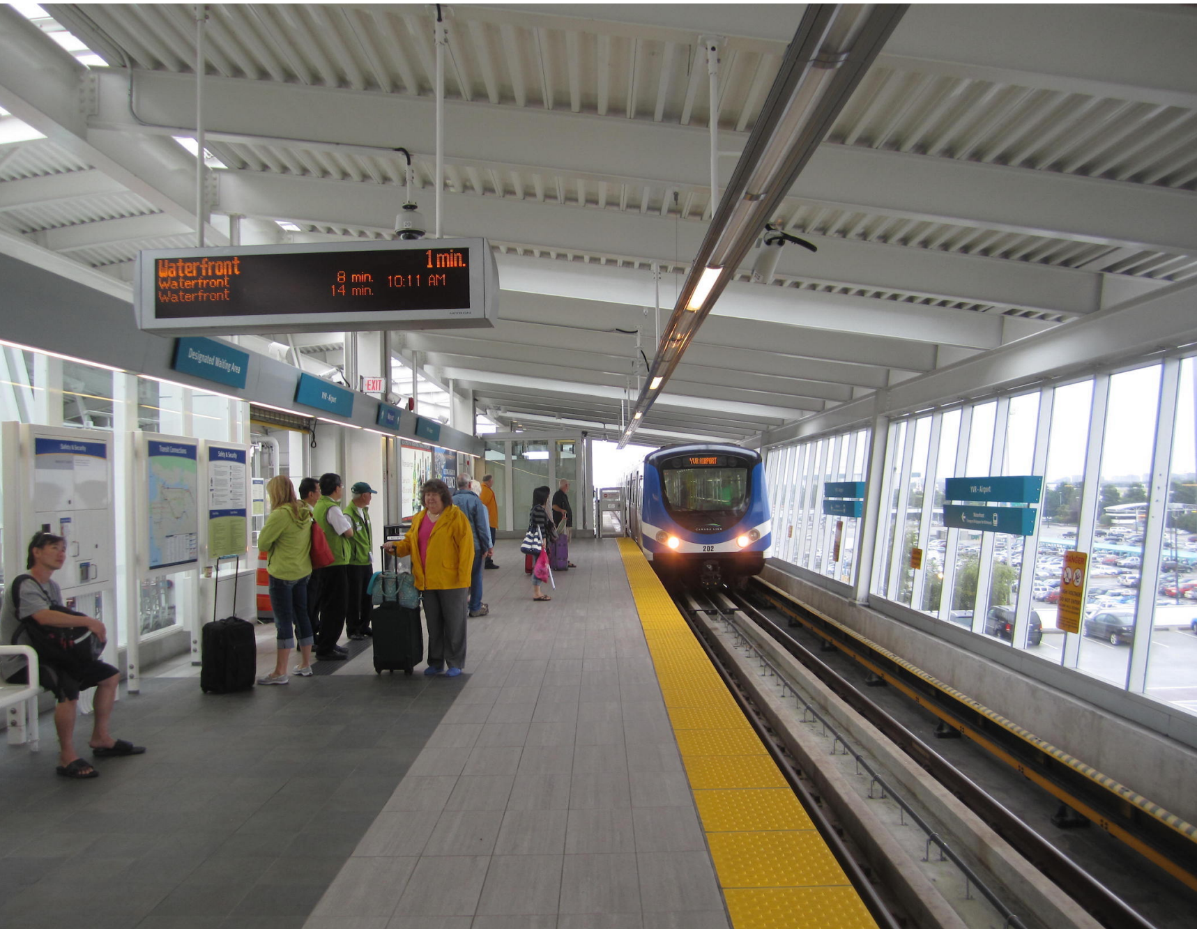
Station de train à Vancouver.