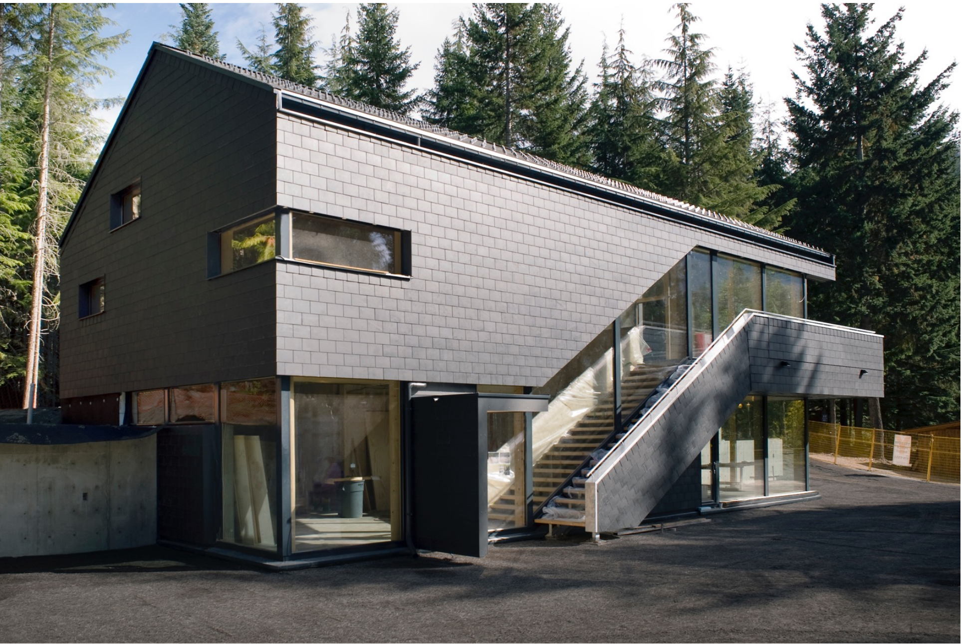
Maison de l'Autriche, Whistler (certifiée Passive House), Treberspurg & Partner Architekten, Photo : Ira Nicolai