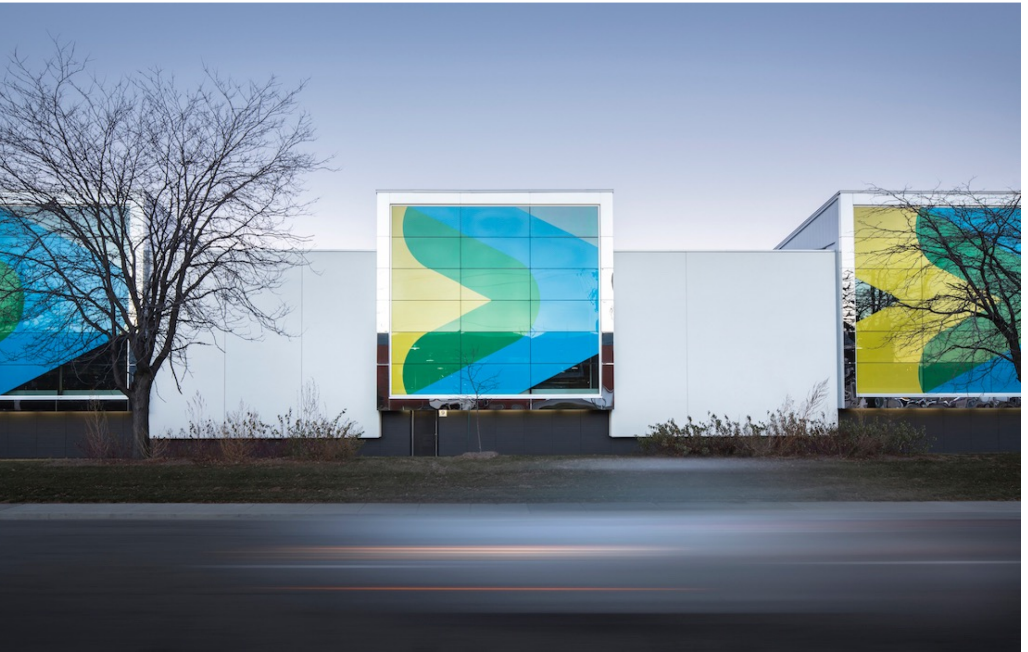
Centre de transport Stinson de la Société de transport de Montréal, Lemay.