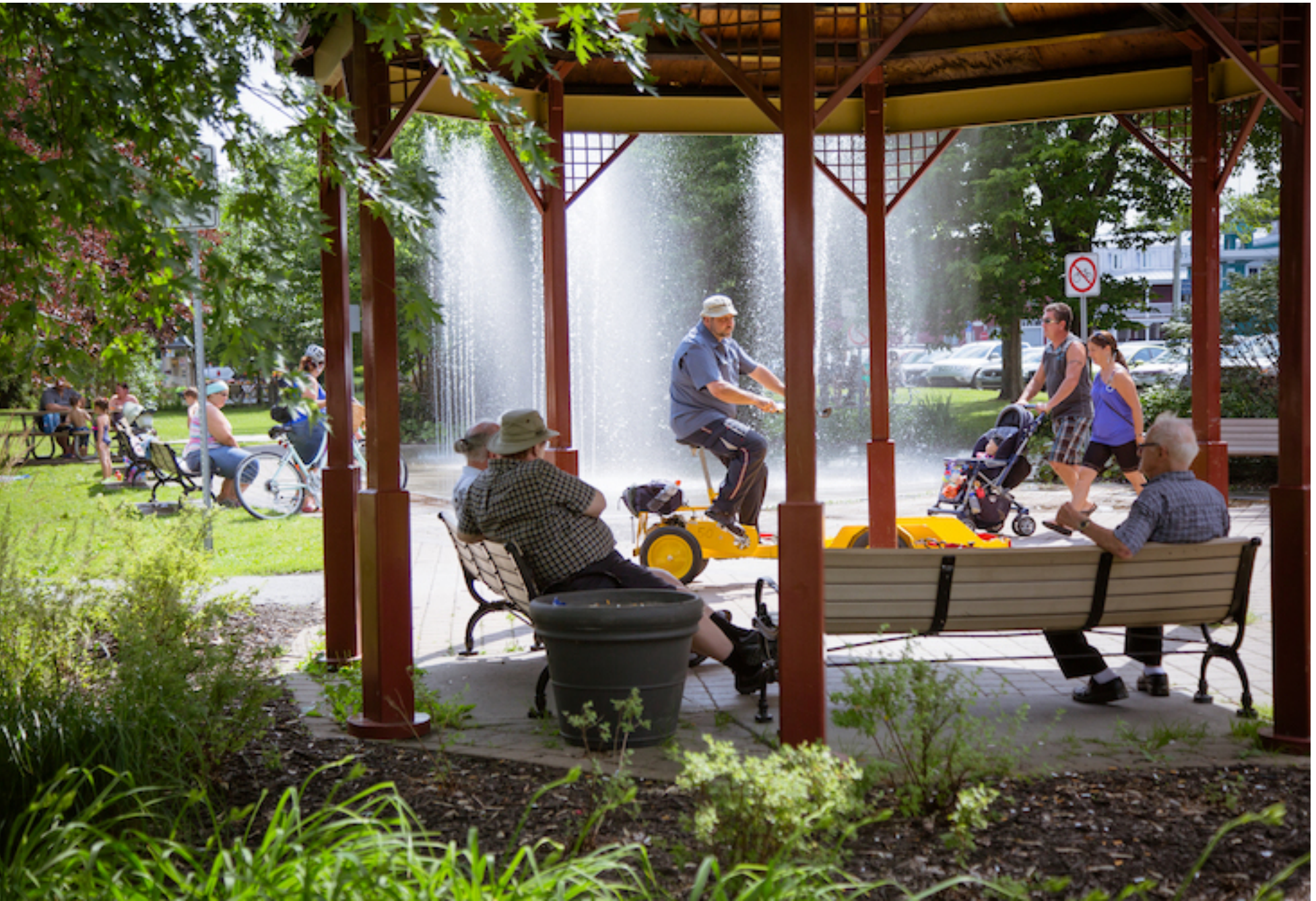
e Sainte-Victoire, Victoriaville.