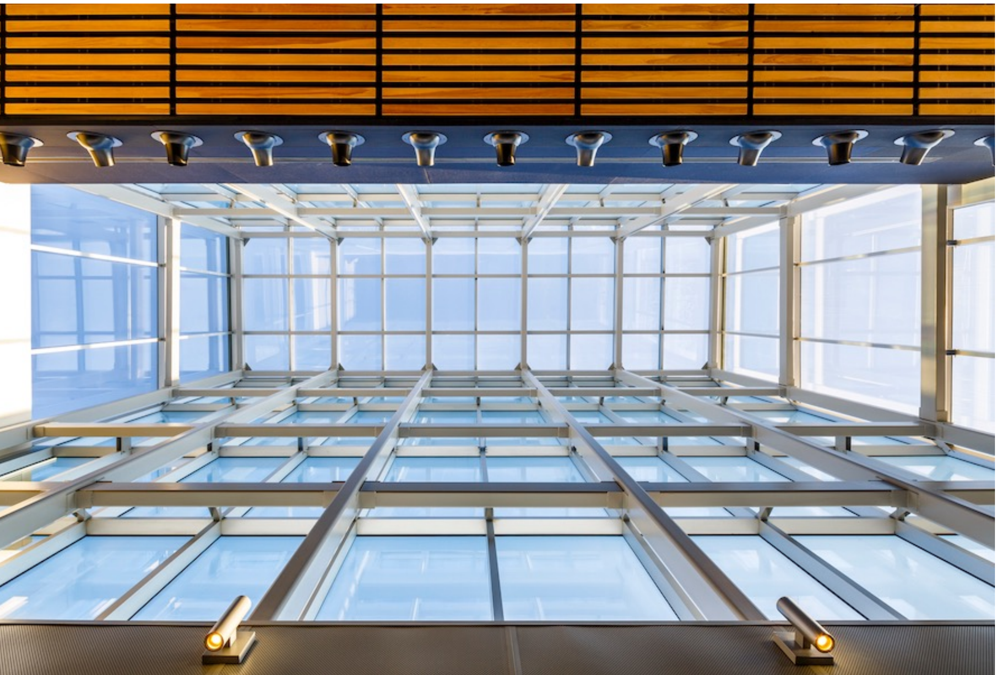
ibliothèque du Boisé, Montréal, Cardinal Hardy, Labonté Marcil, Eric Pelletier architecte en consortium.