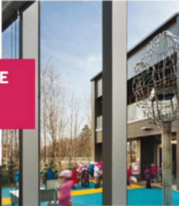
Stade de la place d'Armes, architectes en consortium