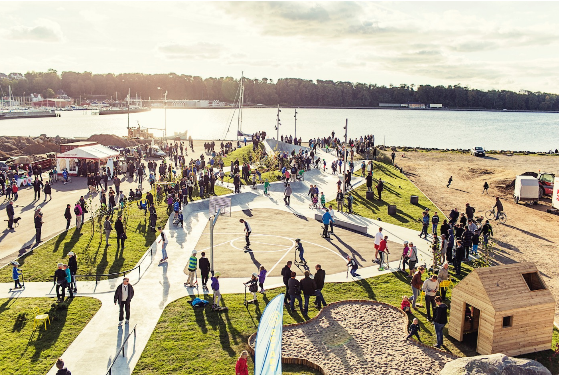
Promenade de Lemvig (Danemark), EFFEKT.