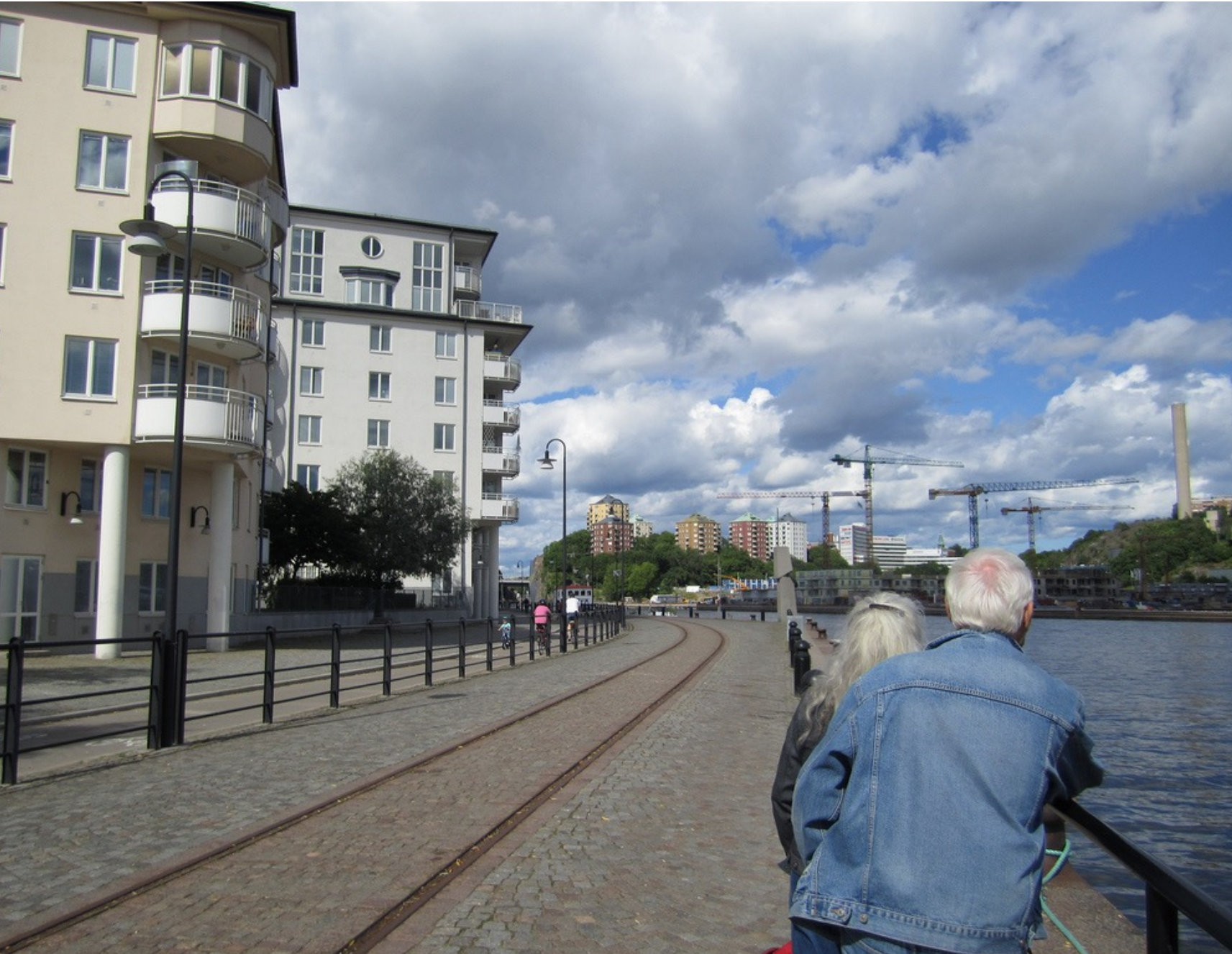
Quartier Hammarby, Stockholm (Suède).