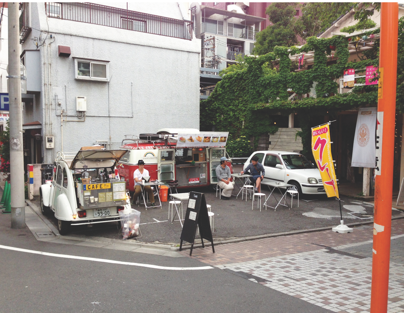
Commerces mobiles près du canal de Meguro, Tokyo