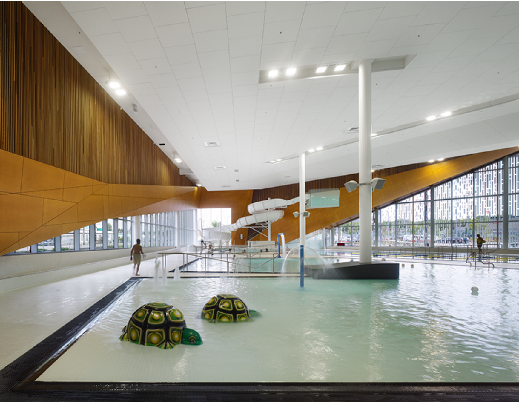
Centre de loisirs communautaire Commonwealth et centre d'entraînement des Eskimos, Edmonton (Alberta), MacLennan Jaunkalns Miller Architects (MJMA) et HIP Architects en consortium