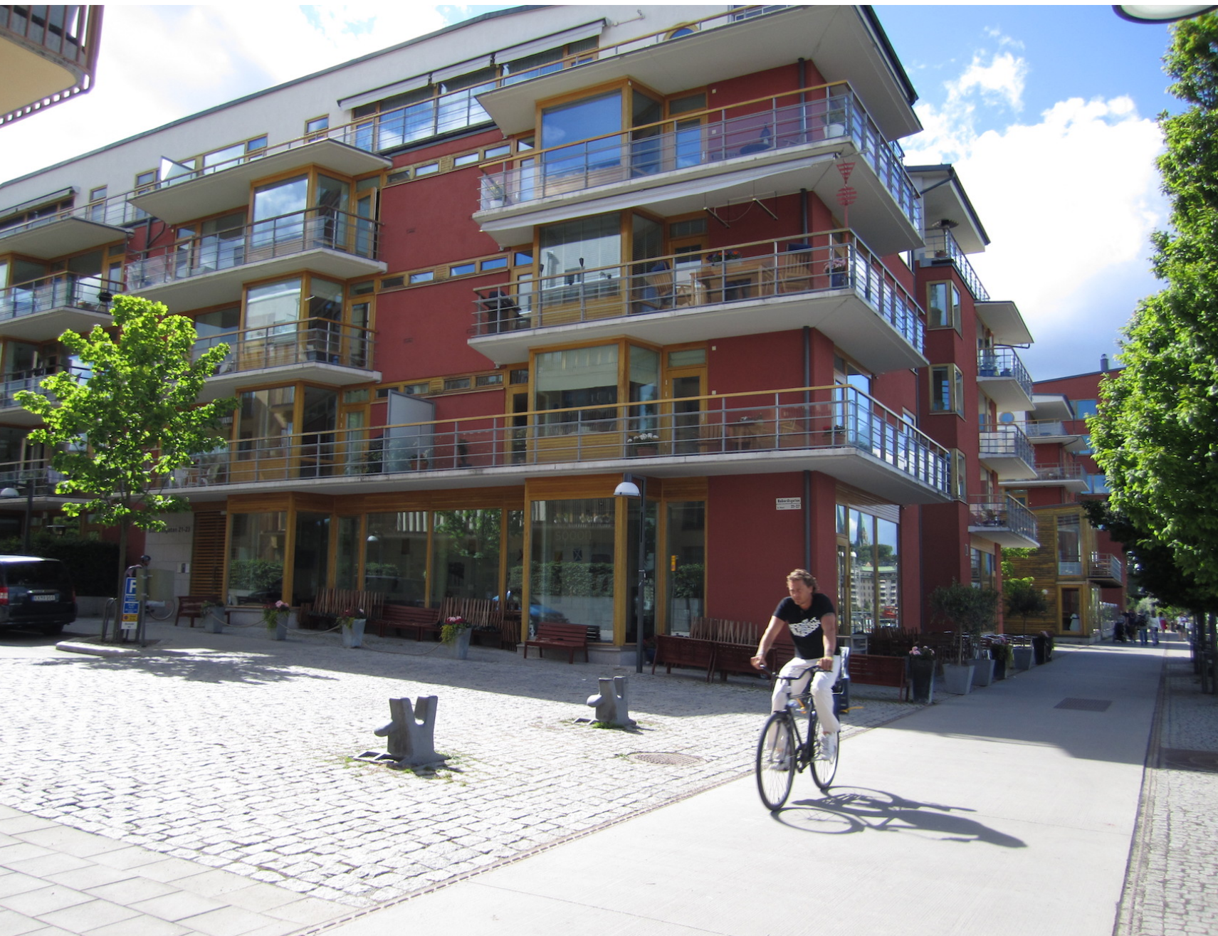
Quartier Hammarby Sjöstad, Stockholm (Suède)