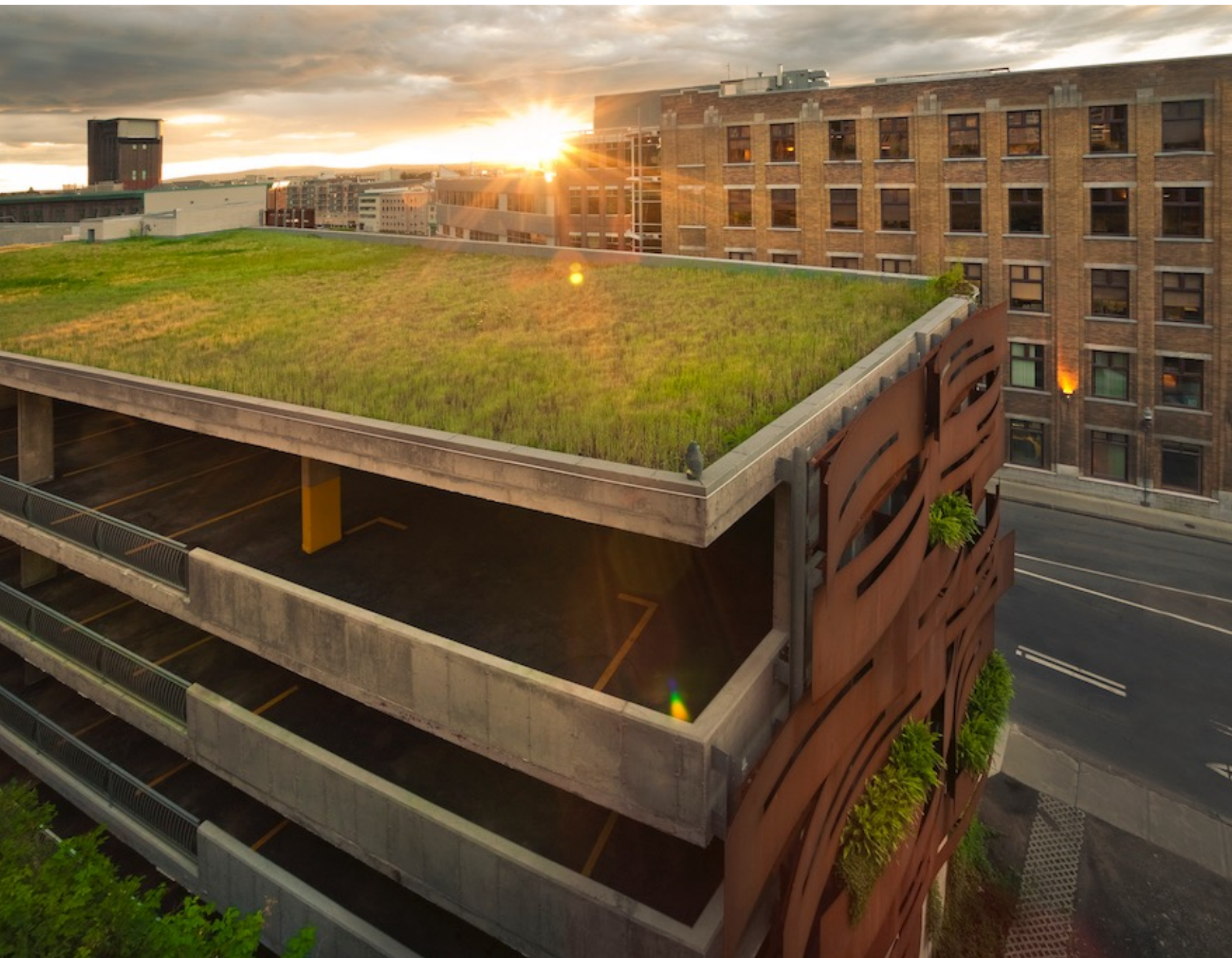
Stationnement La Falaise apprivoisée, Québec, Pierre Martin Architecte.