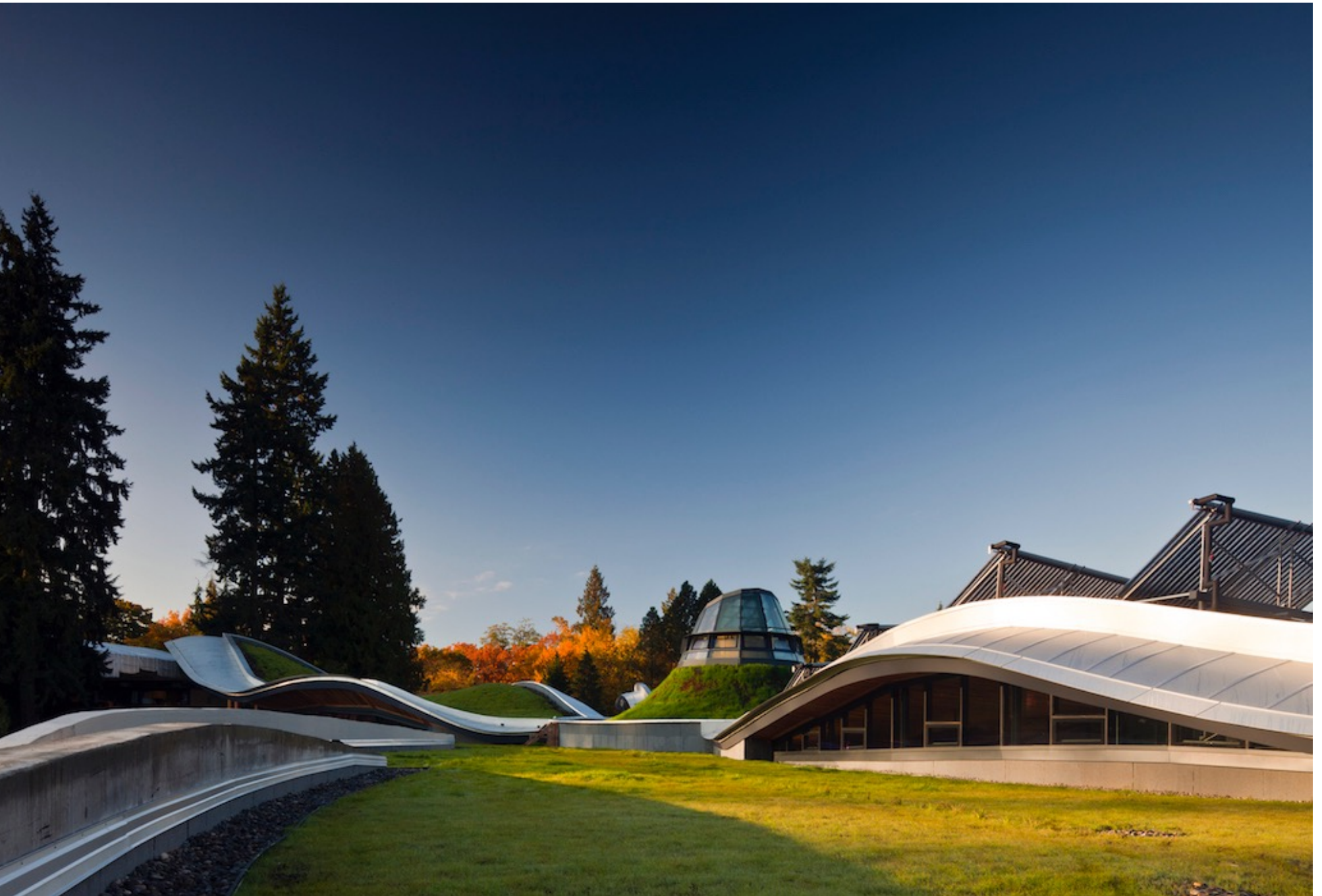
Pavillon d'accueil du jardin botanique VanDusen, Vancouver, conçu par Busby, Perkins + Will, en collaboration avec Cornelia Hahn Oberlander Landscape Architect; Busby, Perkins + Will, consultants.