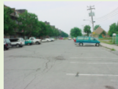
Place Lachine (HLM)

De tels résultats, ajoutés à des observations sur le terrain quant à l'utilisation effective des stationnements, suggèrent de tenir une réflexion sur le rajustement des normes applicables.