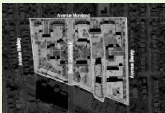
Site de Benny Farm