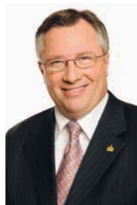
Gérald Tremblay Maire de Montréal

A handwritten signature in black ink, appearing to read 'Richard Deschamps'. The signature is fluid and cursive.