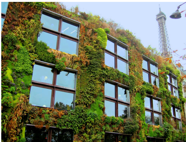
Mur végétalisé Musée du Quai Branly, Paris

Awareness rising of key issues, developing knowledge, confidence and networks so people can become social economy entrepreneurs in the community.