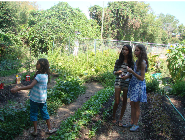
Garden of Thyme, Action Communiterre St-Raymond

Ce restaurant sera unique, car il intègre plusieurs concepts très innovateurs et écologiques. Le menu serait composé d’une cuisine végétarienne, végétalienne. Au moins 80-90% des aliments seront biologiques et récoltés le plus localement/régionalement que possible avec des “ fermiers de famille ” - un % des récoltes venant des jardins du réseau d’AC. Sur le menu, nous pourrons voir le nombre de km les aliments auront parcourus. Ceci aidera les gens à mieux comprendre l’impact de leurs choix alimentaires du champ à l’assiette 1 . Le compostage des restes de la cuisine servirait à fournir le réseau grandissant des jardins d’AC.