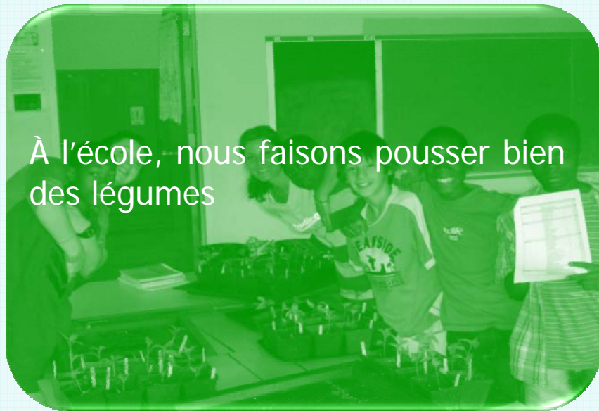
À l'école, nous faisons pousser bien des légumes