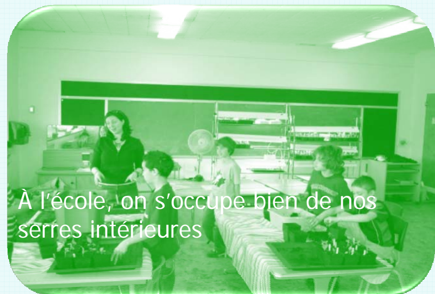
À l'école, on s'occupe bien de nos serres intérieures