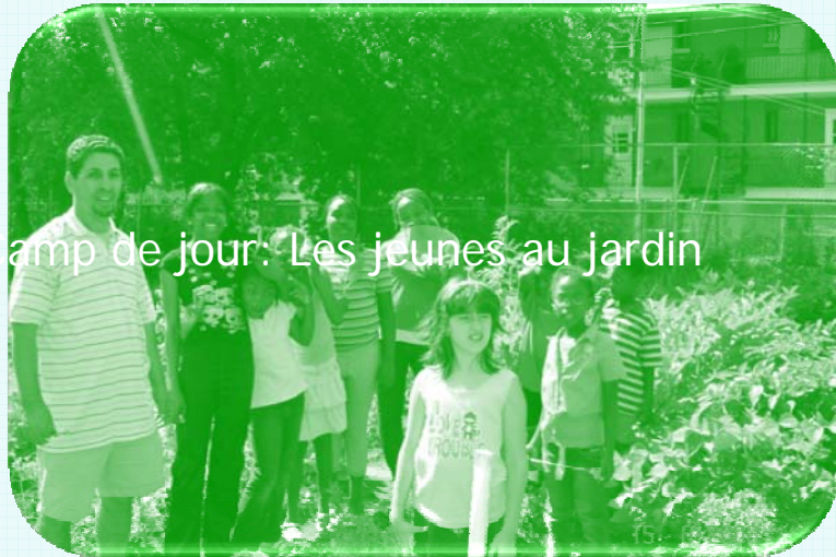
Camp de jour: Les jeunes au jardin