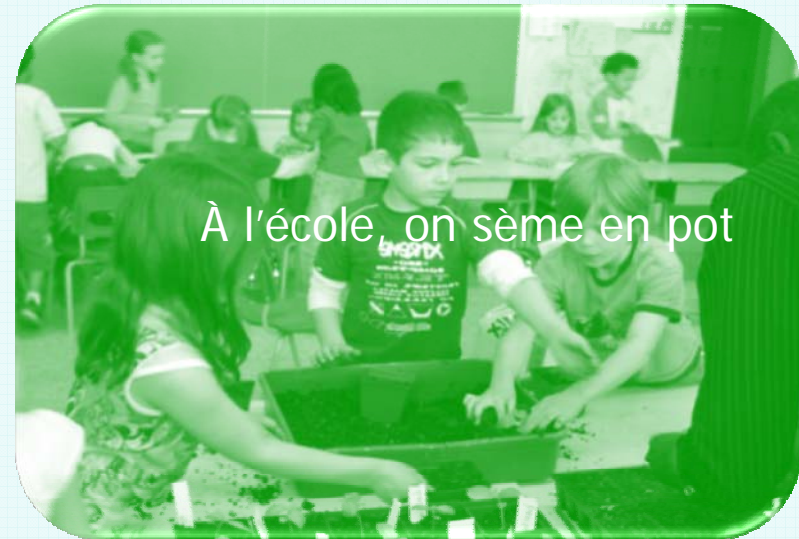
À l'école, on sème en pot