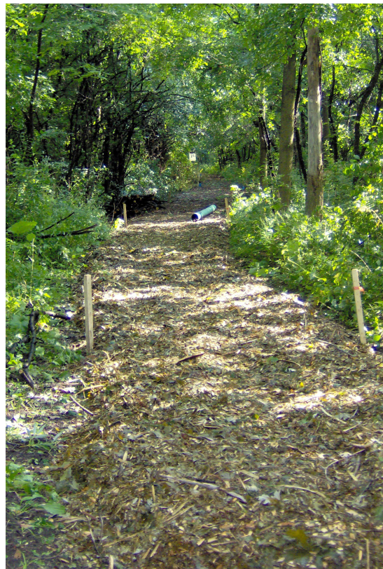
Boisé du parc Marcel-Laurin