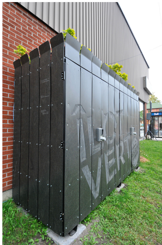
Îlot de récupération pour les marchands du boulevard Décarie