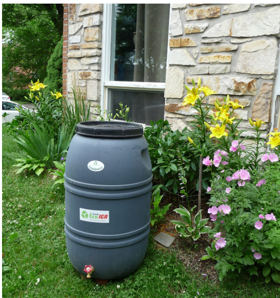
Baril de récupération d'eau de pluie