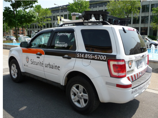
Camion hybride de la Patrouille de sécurité urbaine