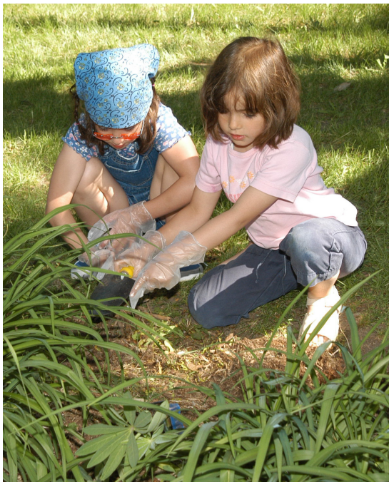
Première édition du programme annuel Mon école écolo