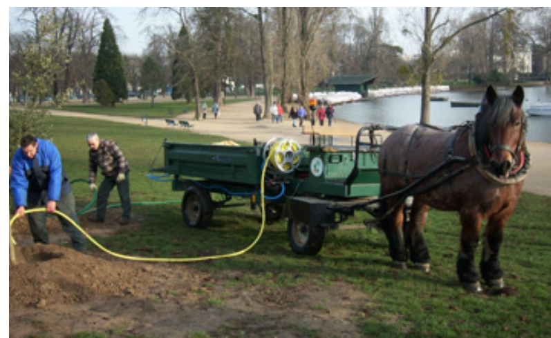
Deux exemples Européens de chevaux qui sont utilisés pour l'entretien des espaces verts