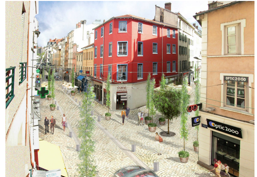
Exemple de rue partagée à Lyon

Axe central du corridor culturel, la rue Ottawa deviendra une rue partagée où la circulation piétonne, cycliste, et de calèche aura priorité sur l'automobile. La circulation automobile se concentrera sur la rue Wellington. Au rez-de-chaussée des bâtiments, nous demandons de modifier le plan d'urbanisme pour exiger une vocation commerciale ou institutionnelle. Ceci encouragera une activité piétonne, des commerces de quartier et l'implantation de nouveaux services aux résidents.