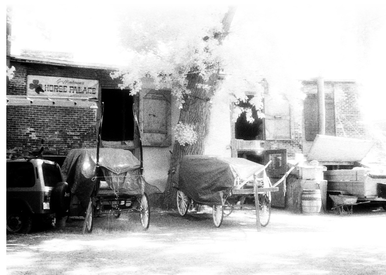
Les écuries sont toujours opérationnelles