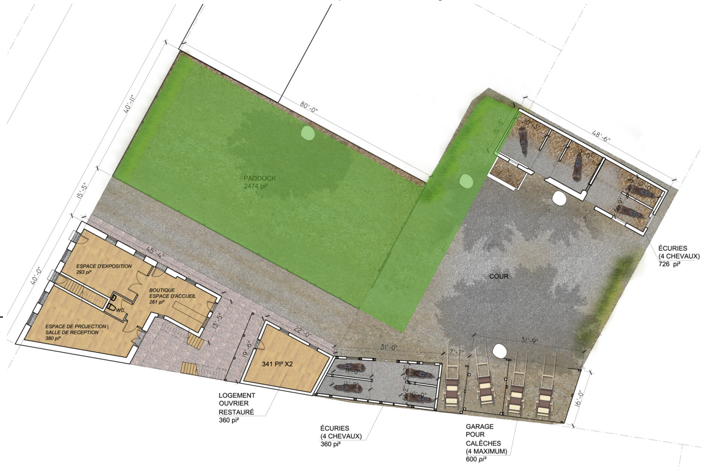
Proposition d'aménagement du Horse Palace de Griffintown

Un centre d'interprétation prendra place au rez-de-chaussée de la maison. Tandis que le paddock actuel deviendra un espace vert permettant au public d'interagir avec les chevaux dans un cadre urbain et d'ainsi entrer en contact avec l'histoire vivante de Montréal,