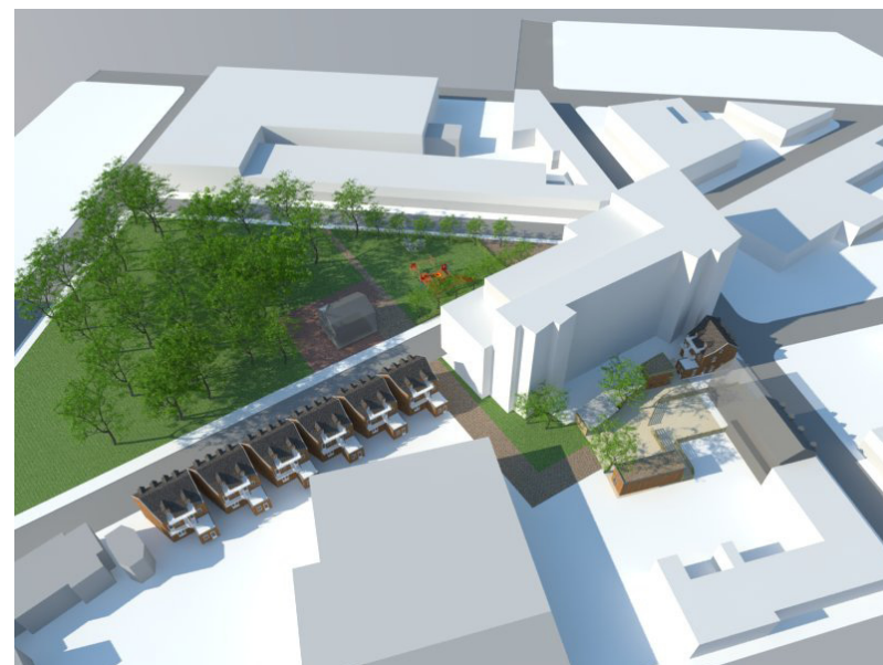
Le Horse Palace dans son contexte futur