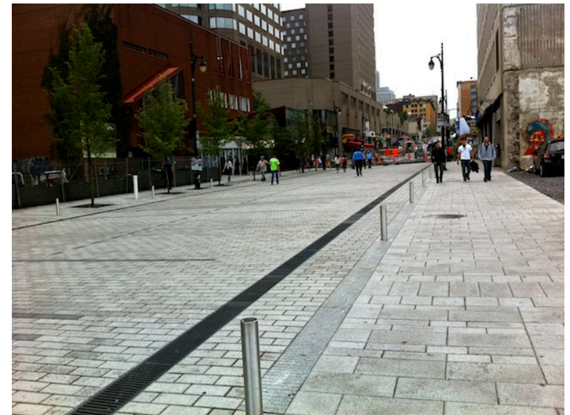
Exemple de rue partagée à Montréal, dans le quartier des spectacles