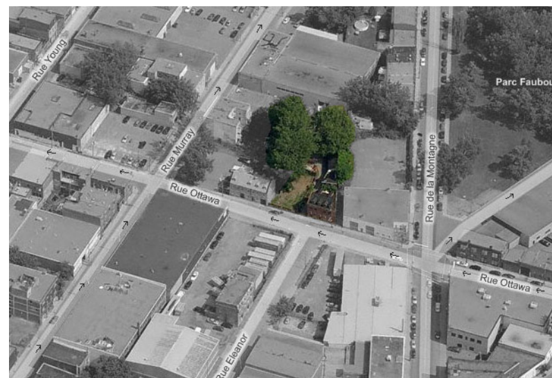
Le Horse Palace est situé sur la rue Ottawa à Montréal

Deux maisons de ville en brique construites sur rue mènent à une parcelle très profonde, lotissement typique du régime français. Autour d'arbres centenaires on retrouve une maison secondaire et les écuries. Cette implantation particulière, autrefois fréquente à Montréal, est aujourd'hui le seul exemple qui subsiste à Montréal.