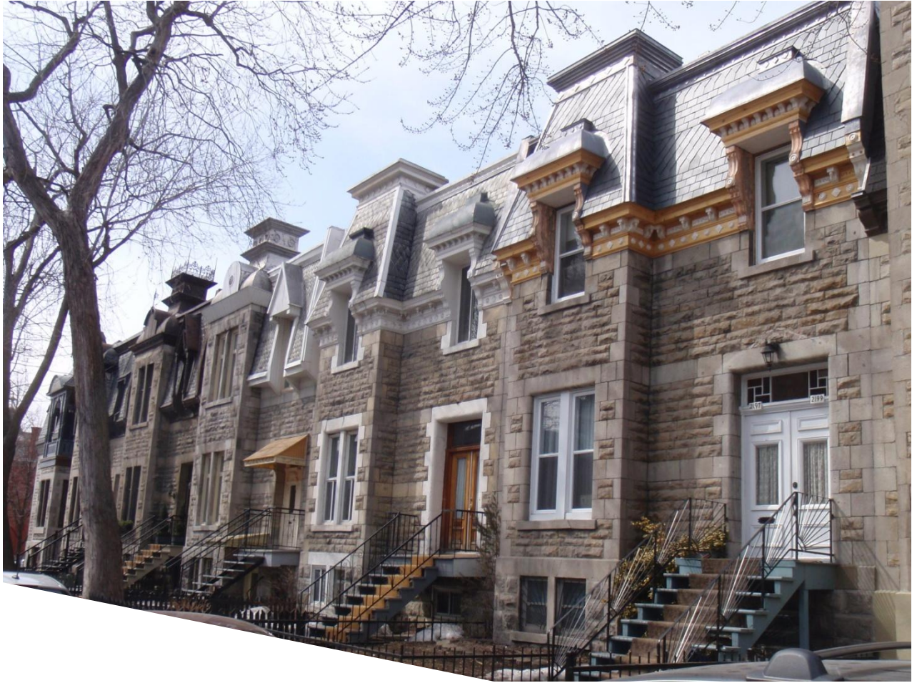
▲ Quelques-unes des maisons victoriennes de la rue du Souvenir. 2

Je suis propriétaire d'une maison sur la rue du Souvenir depuis avril 2009.