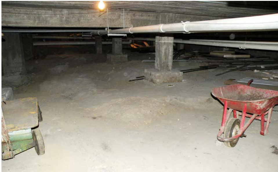
Vide sanitaire avec plancher de béton et roc apparent, structure de béton armé, aile ouest, sous-sol.