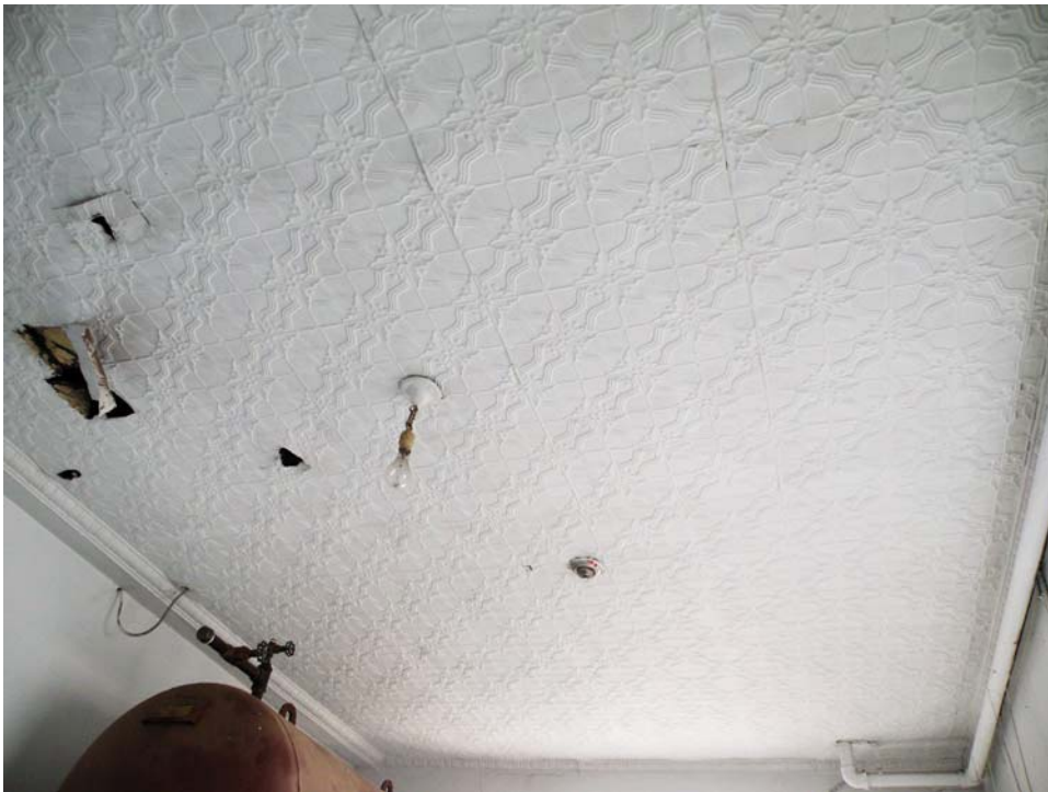
Plafond, ancienne salle de lavage, corps principal, 6 e étage.