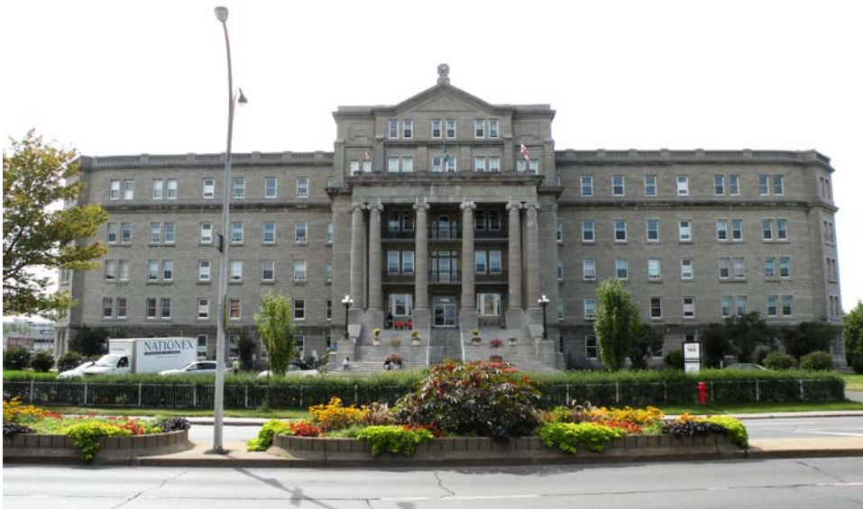
Façade principale, boulevard Saint-Laurent.