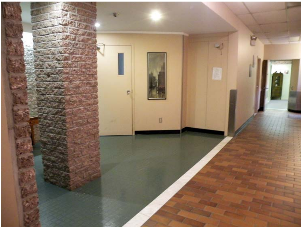
Jonction des deux parties de l'aile Faillon, rez-de-chaussée.