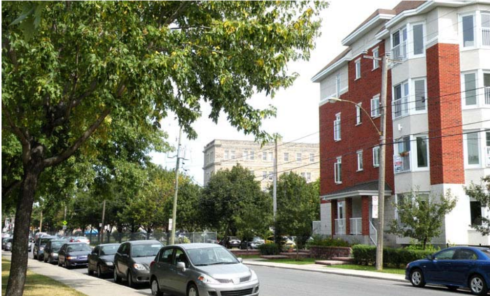
Vue de la rue Faillon en direction est sur l'arrière du corps principal et habitations de construction récente.