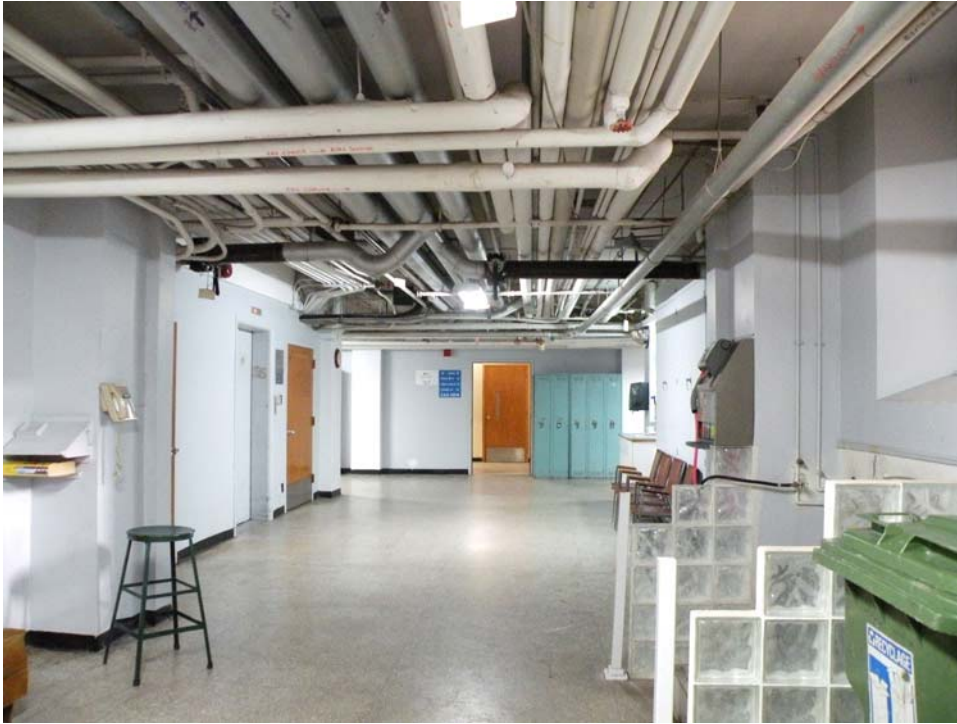
Couloir central vers l'aile ouest, corps principal, sous-sol.