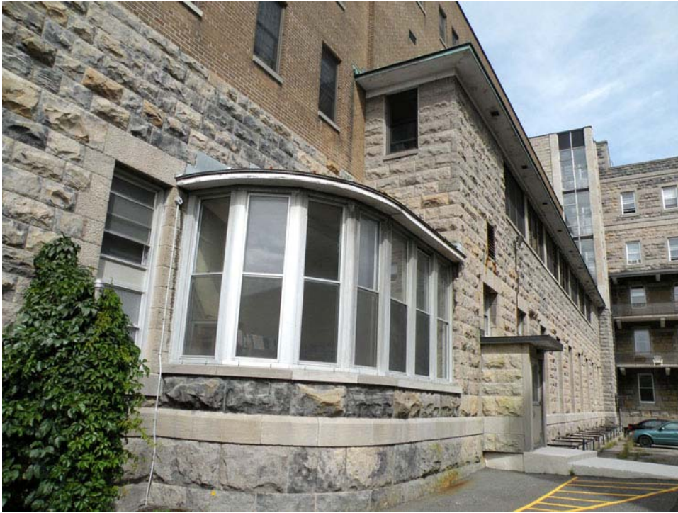
Détail de la façade sud de l'aile ouest.