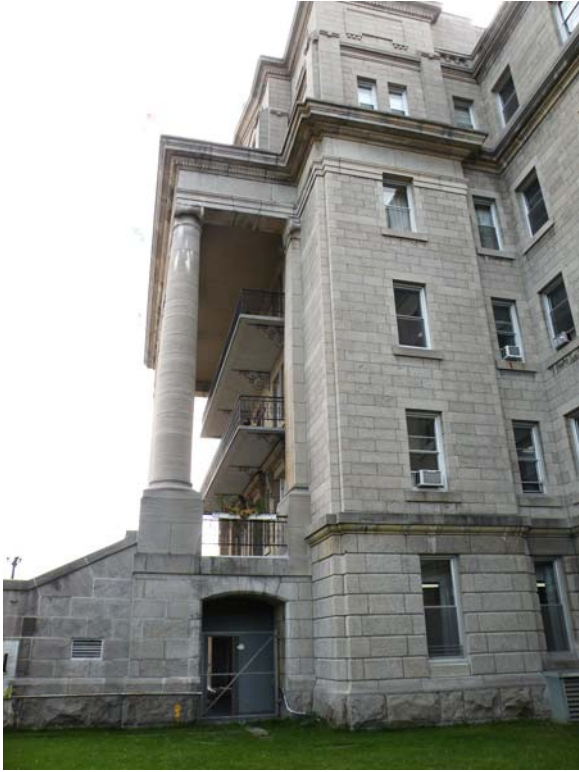
Avancée de la travée centrale du corps principal, avec entrée de service.