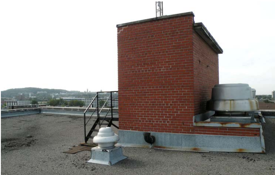
Cage d'ascenseur sur le toit du corps principal.