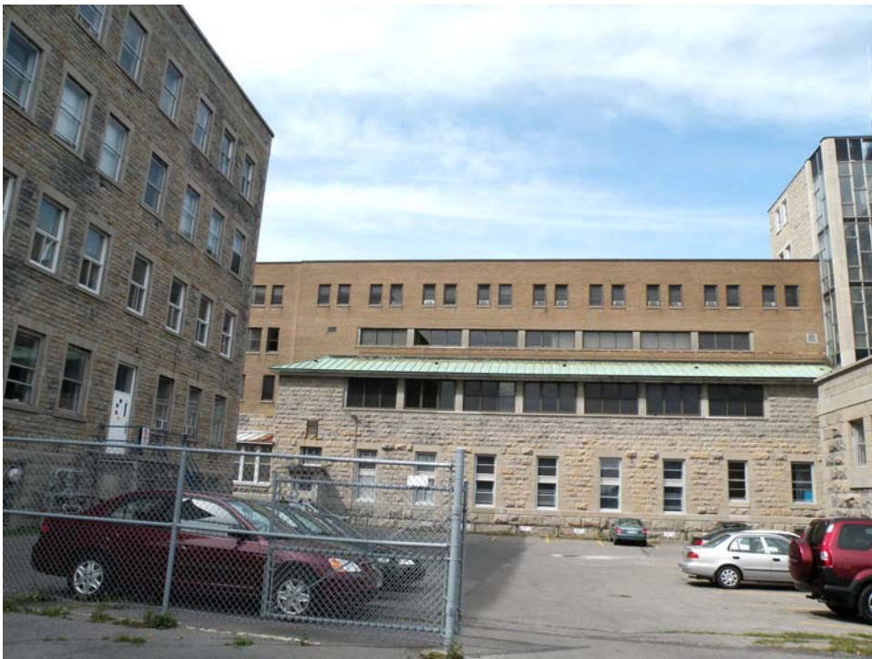
Façade sud de l'aile ouest et ancien bâtiment des ateliers, à gauche.