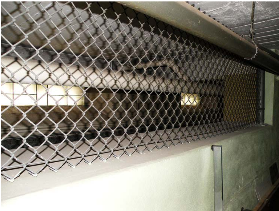
Premier mur de fondation avec fenêtres et semelle ajoutée lors de la construction des étages supérieurs, couloir du sous-sol de l'aile ouest.