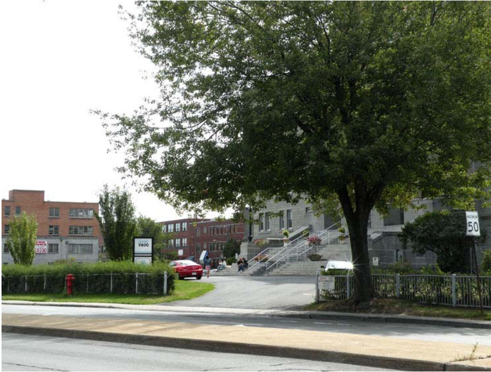
Débarcadère de l'entrée principale, boulevard Saint-Laurent.