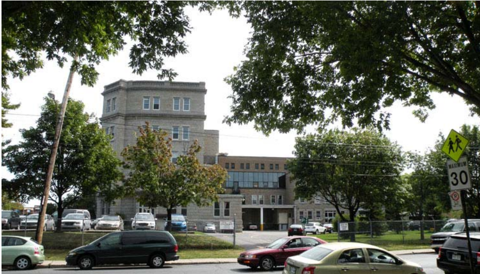
Vue générale de la façade nord, rue Faillon.