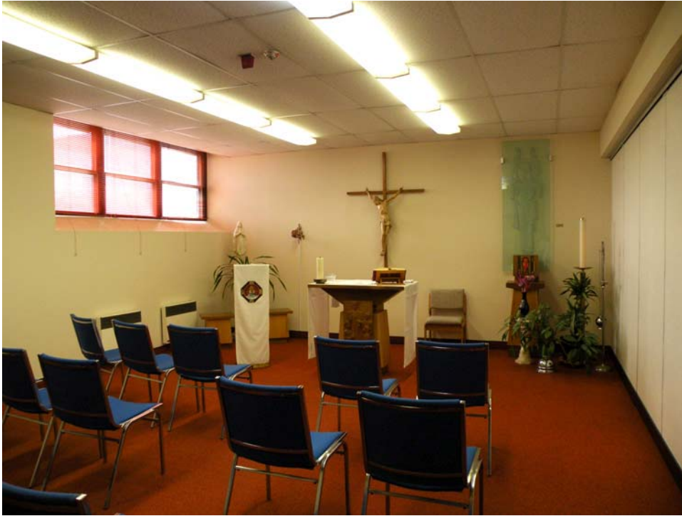
Chapelle aménagée dans l'ancien jubé, aile ouest, 3 e étage.