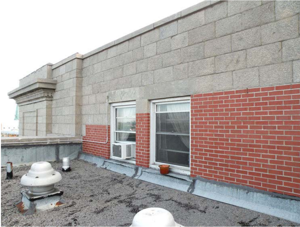
Ajout derrière le fronton, 6 e étage du corps principal.