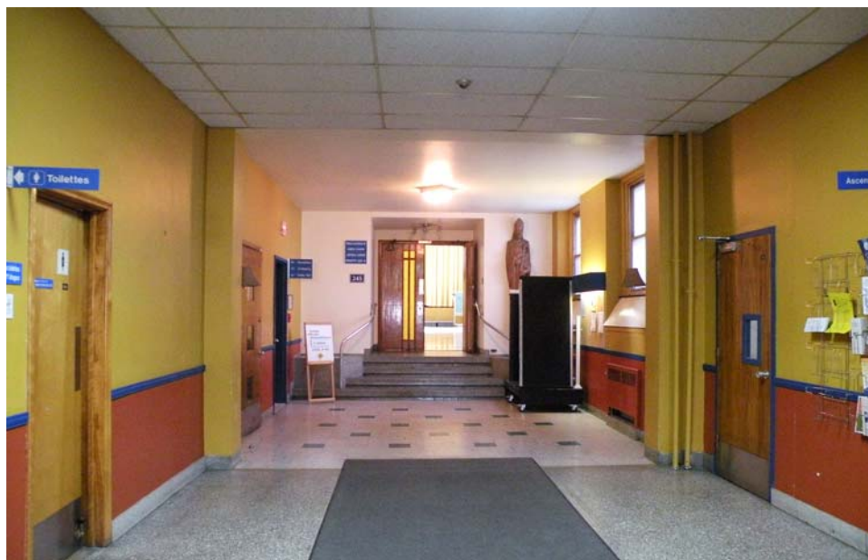
Couloir central vers l'entrée de l'ancienne chapelle, corps principal, 2 e étage.