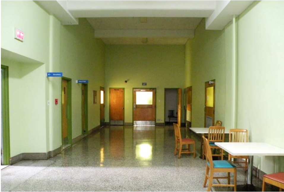
Couloir central vers l'entrée de la première chapelle, corps principal, rez-de-chaussée.