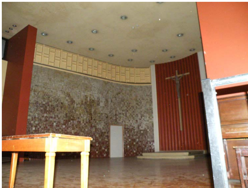
Chœur de l'ancienne chapelle, aile ouest, 2 e étage.