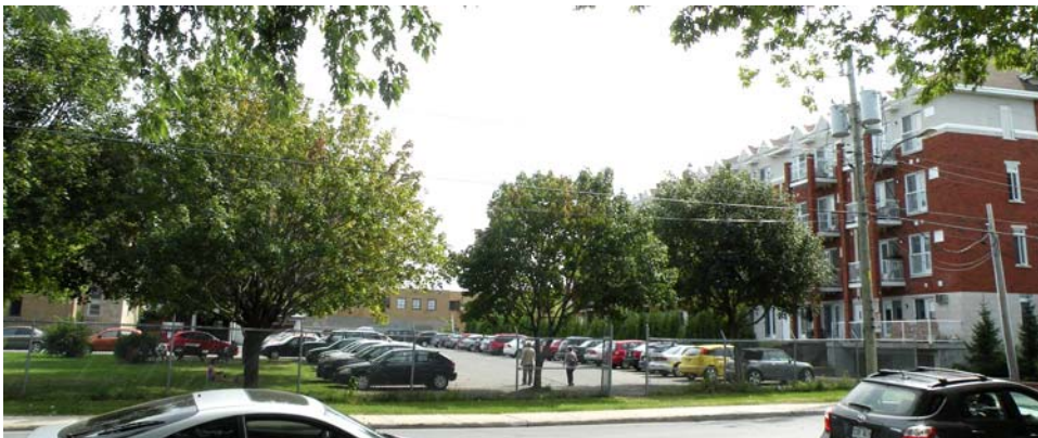
Terrain de stationnement aménagé au nord du bâtiment, vu de la rue Faillon.