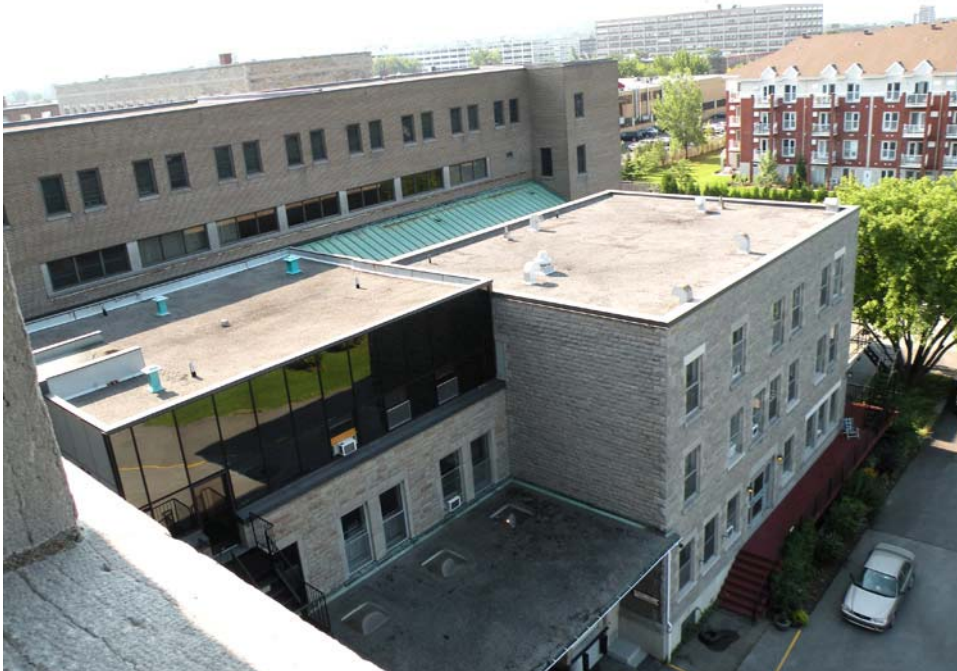
Aile ouest et aile Faillon.