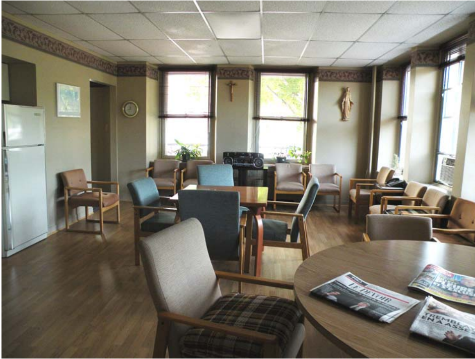
Ancienne salle commune des religieuses, aile Faillon, rez-de-chaussée.