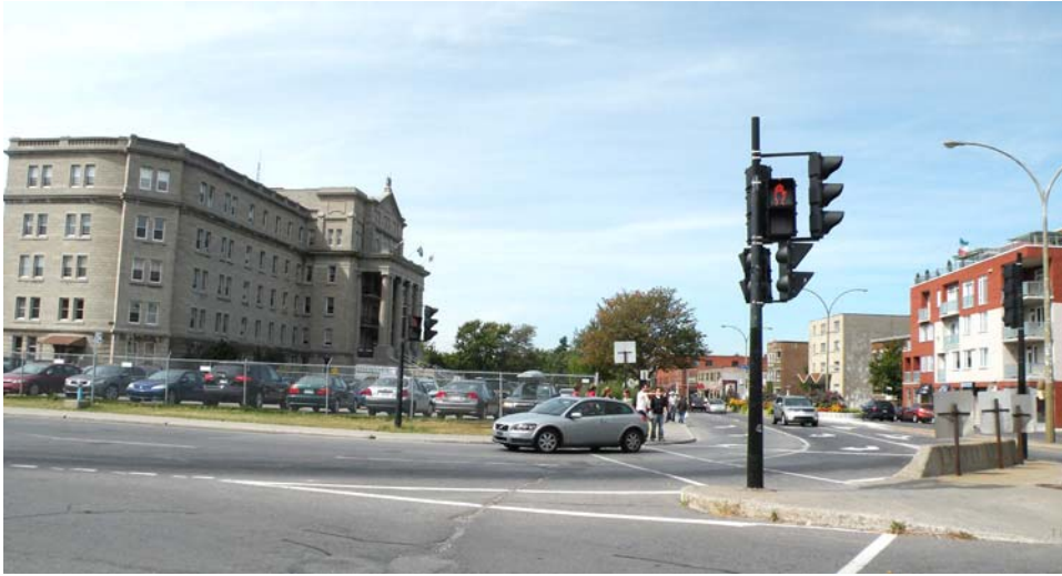
Vue générale, boulevard Saint-Laurent à l'angle de la rue De Castelneau, direction nord.