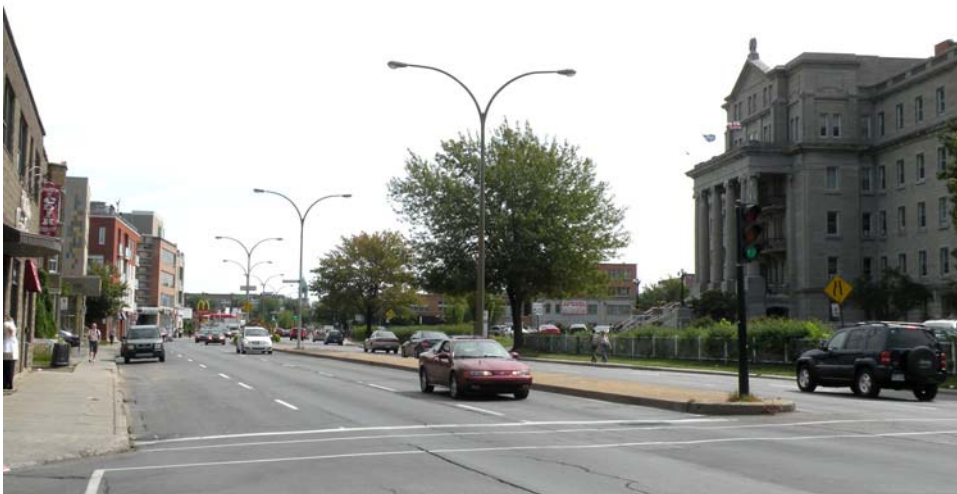
Vue générale, boulevard Saint-Laurent à l'angle de la rue Faillon, direction sud.