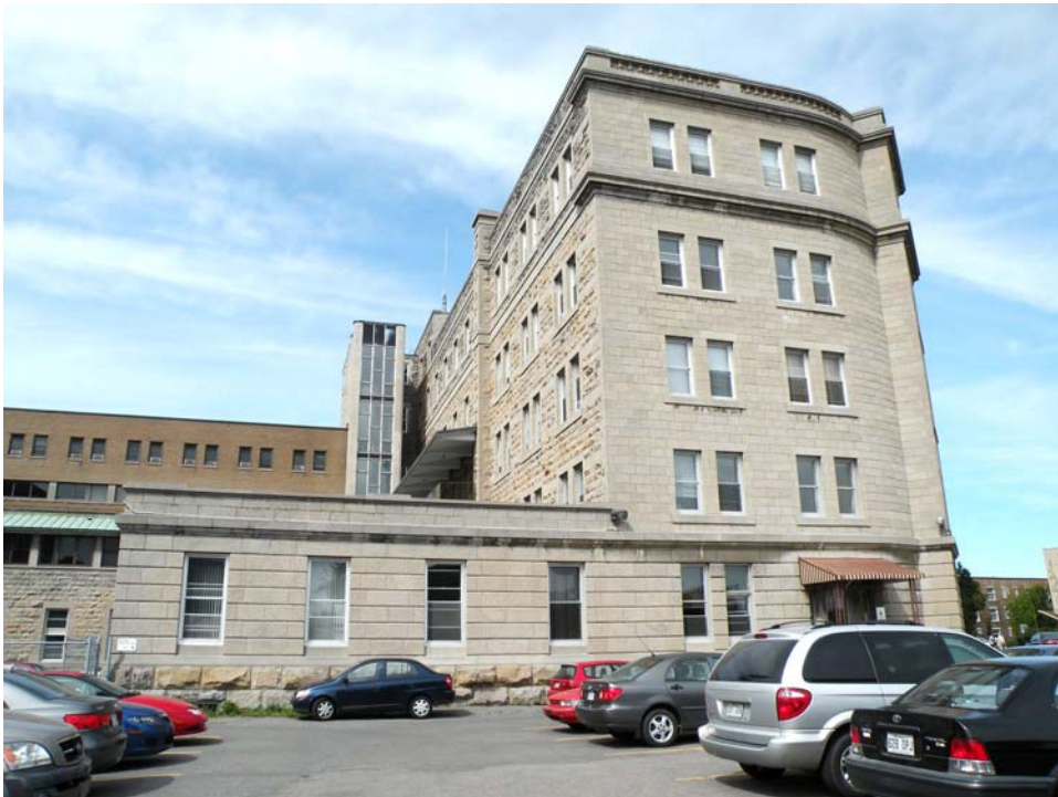
Façade sud du corps principal.