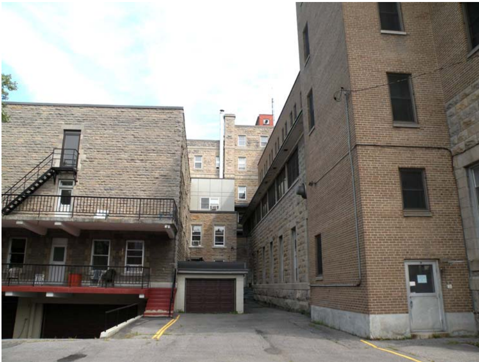
Façade ouest, ajouts à l'aile Faillon, entre celle-ci (à gauche) et l'aile ouest (à droite).