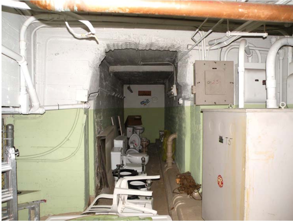
Ancien couloir sous-terrain fermé, reliant l'aile ouest au bâtiment des ateliers, où se trouvait le système de chauffage.