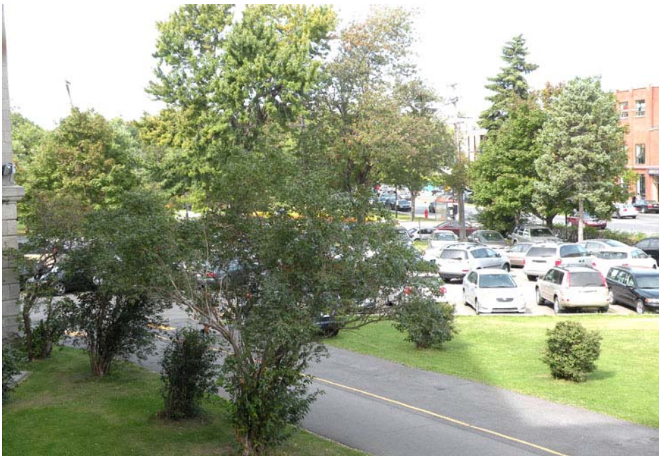
Parterre et terrain de stationnement au nord-est de la propriété, angle de la rue Faillon et du boulevard Saint-Laurent.