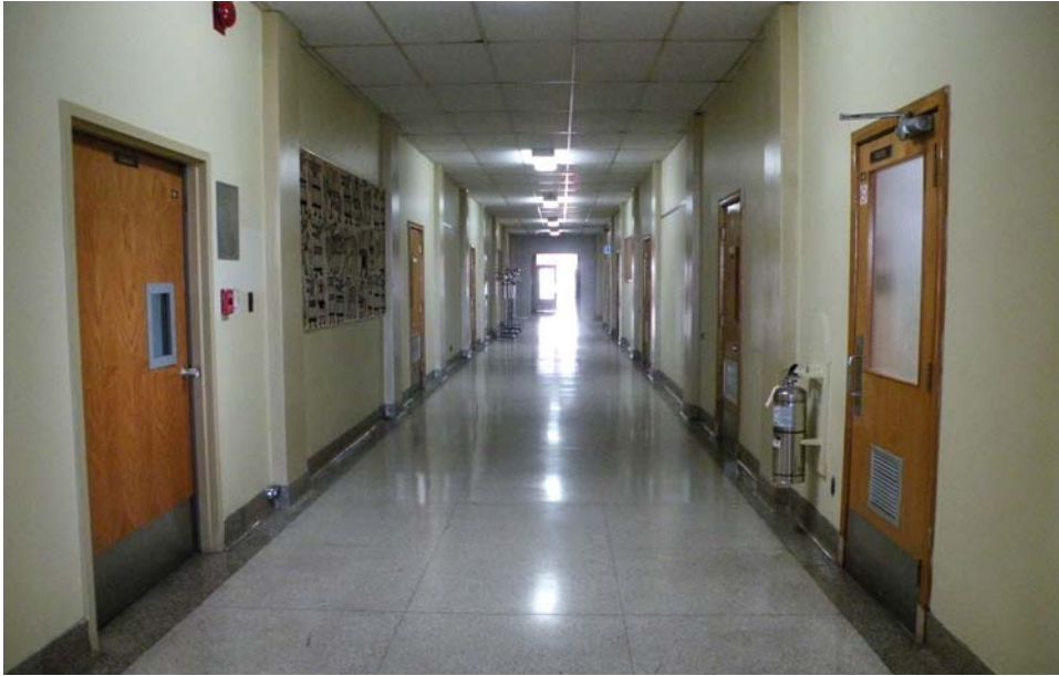
Couloir des classes, corps principal, 4 e étage.