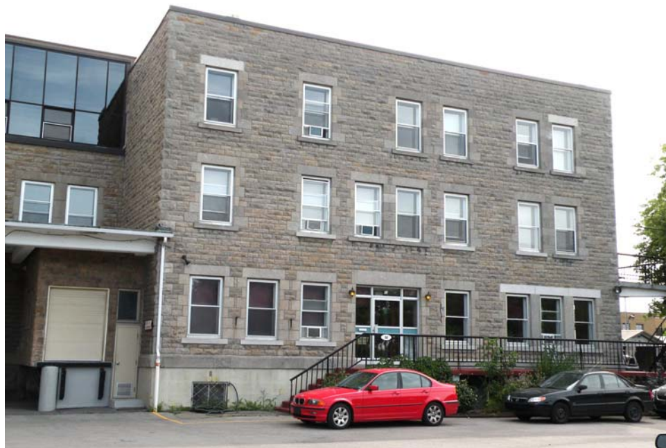
Façade nord de l'aile Faillon.