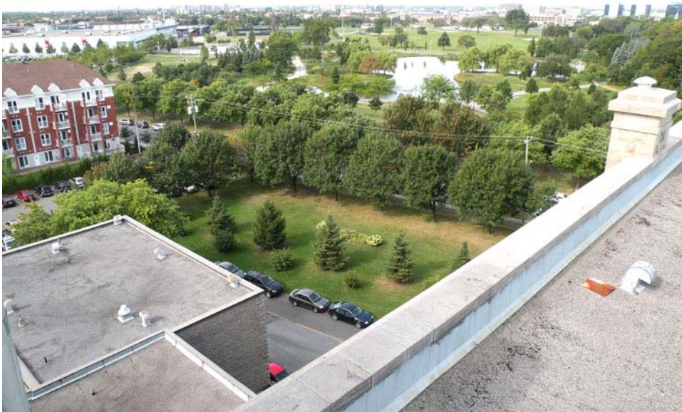
Parterre aménagé au nord-ouest du bâtiment et alignement d'arbres bordant la propriété sur la rue Faillon. Ensemble résidentiel à l'ouest de la propriété et parc Jarry au nord.