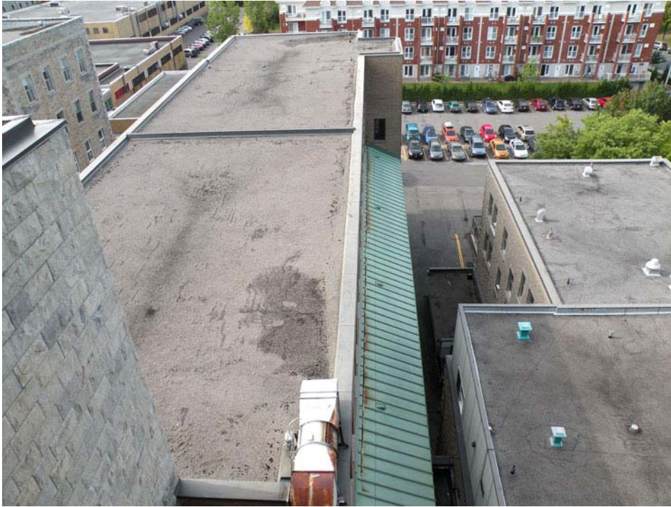
Toit des ailes ouest et Faillon.