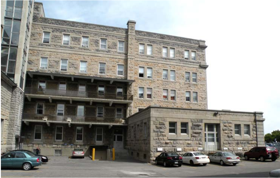
Façade ouest du corps principal, côté sud.