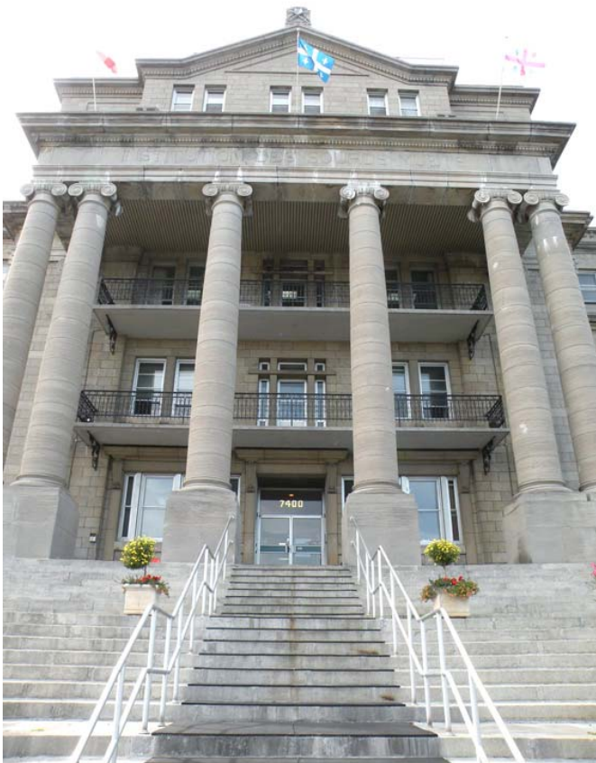
Travée centrale du corps principal avec entrée principale.