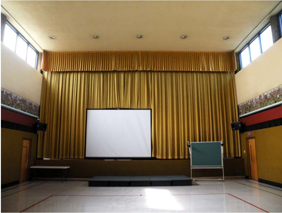
Ancienne chapelle, aile ouest, 2 e étage.