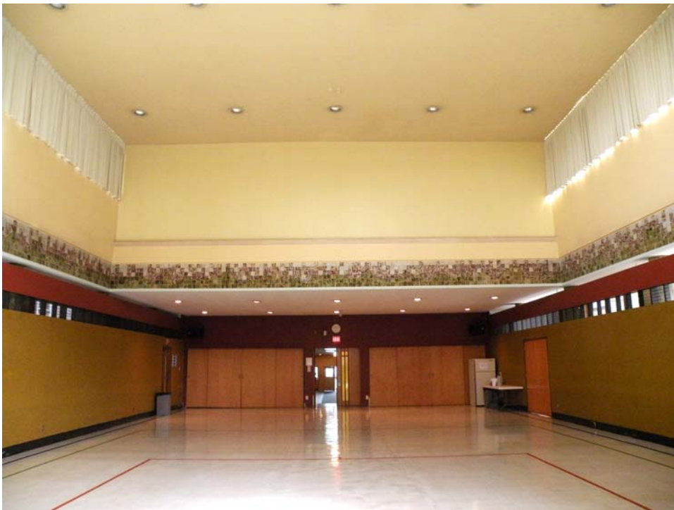
Jubé fermé dans l'ancienne chapelle, aile ouest, 2 e étage.