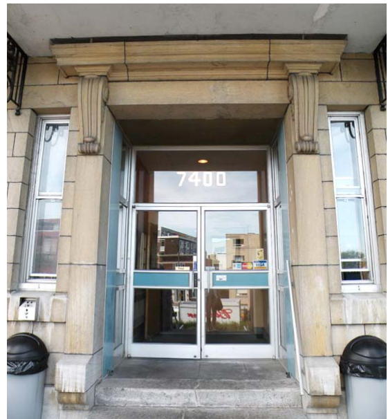
Porte d'entrée principale.