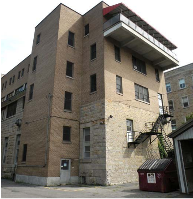
Angle nord-ouest de l'aile ouest.