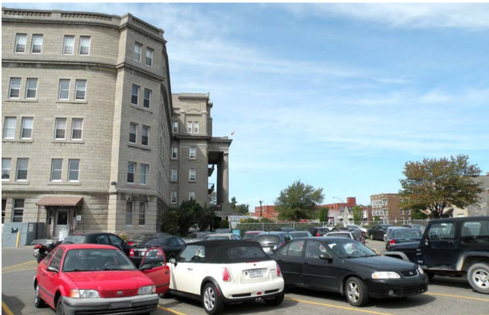
Terrain de stationnement aménagé au sud-est du bâtiment.