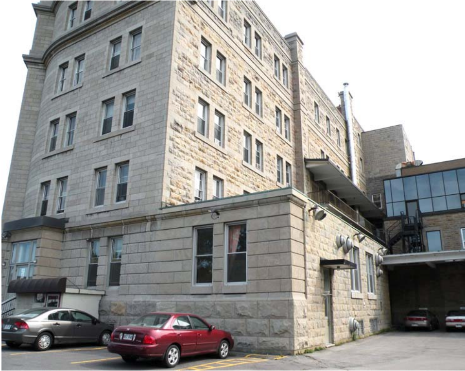
Agrandissement à l'arrière du corps principal, côté nord.