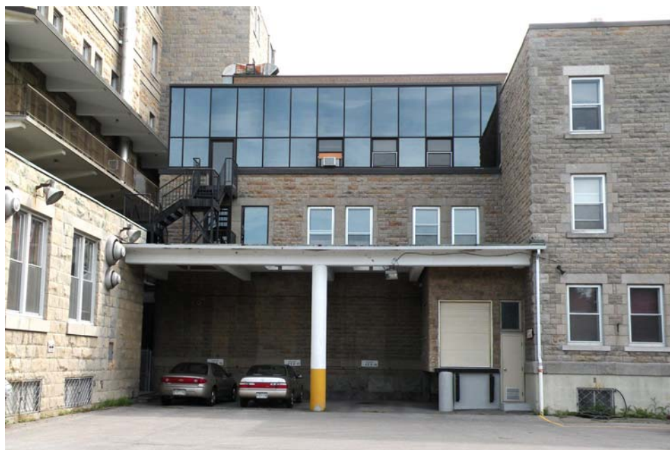
Préau ajouté à la façade nord de l'aile Faillon à la jonction du corps principal.