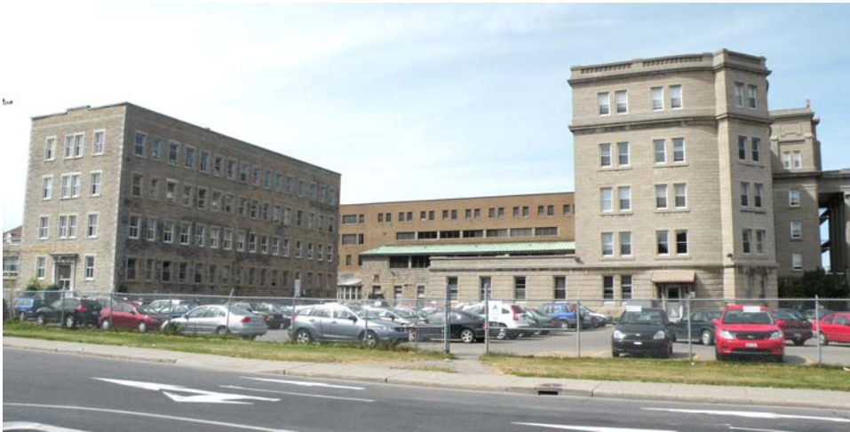
Façade sud de l'Institution et ancien bâtiment des ateliers, à gauche.