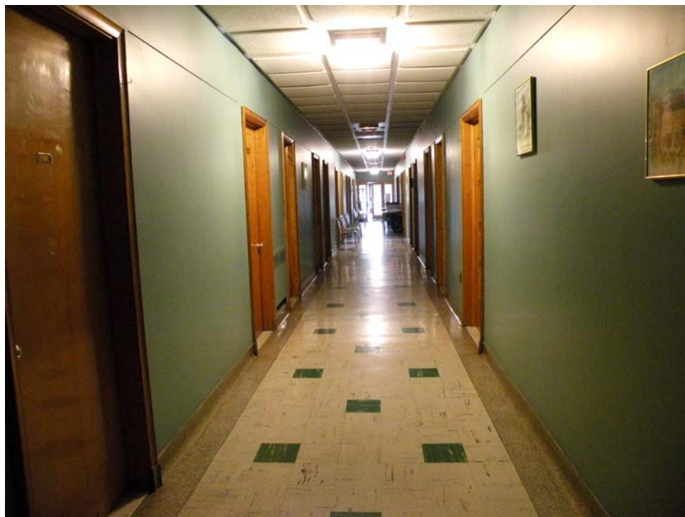
Couloir, anciennes chambres des pères Oblats, aile ouest, 4 e étage.