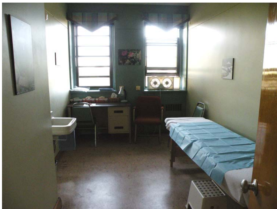
Ancienne chambre type des pères Oblats, aile ouest, 4 e étage.