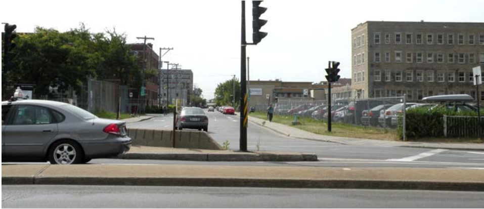
Vue générale, rue De Castelneau à l'intersection du boulevard Saint-Laurent, direction ouest.