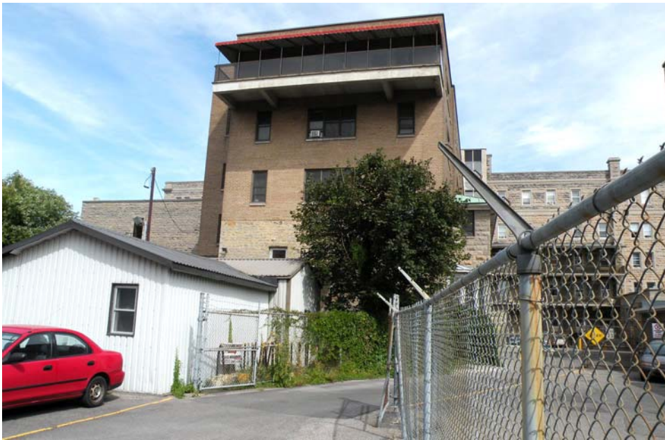
Vue générale, façade ouest.