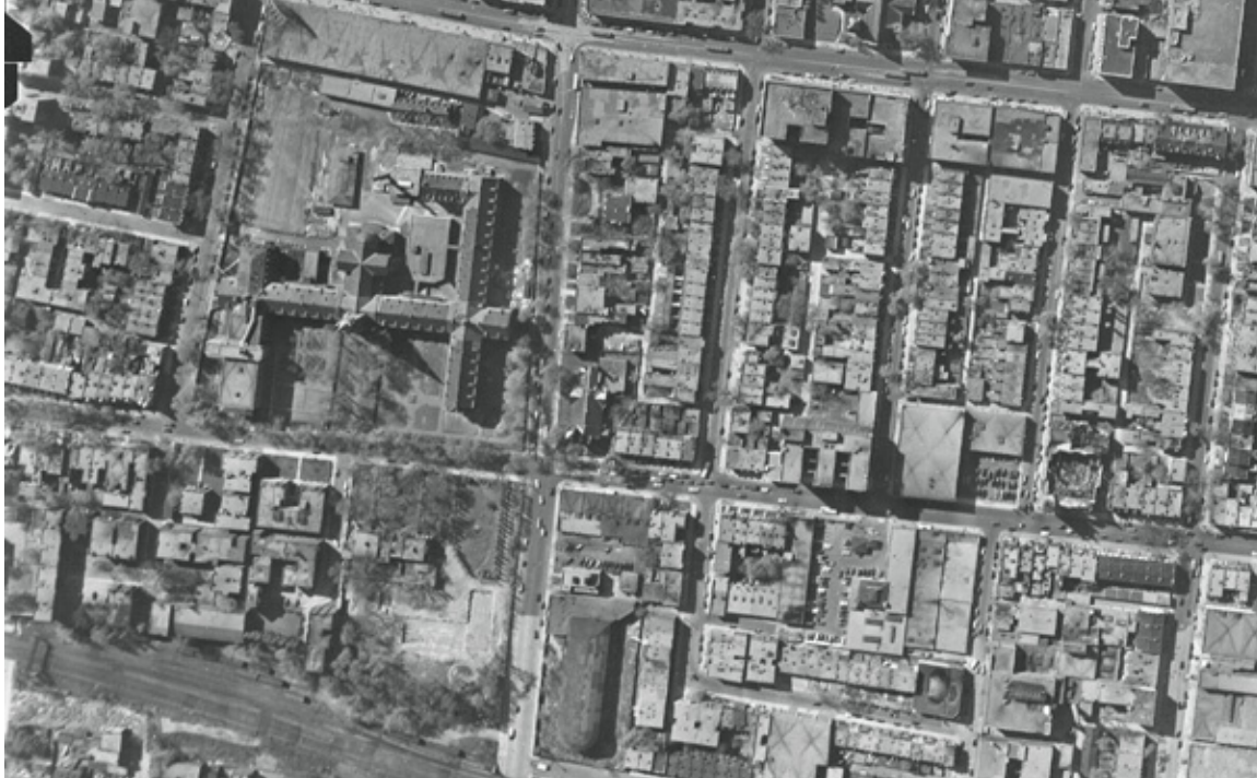
1949. (Détail) Photo aérienne

La photo aérienne de 1949 montre un secteur complètement construit.