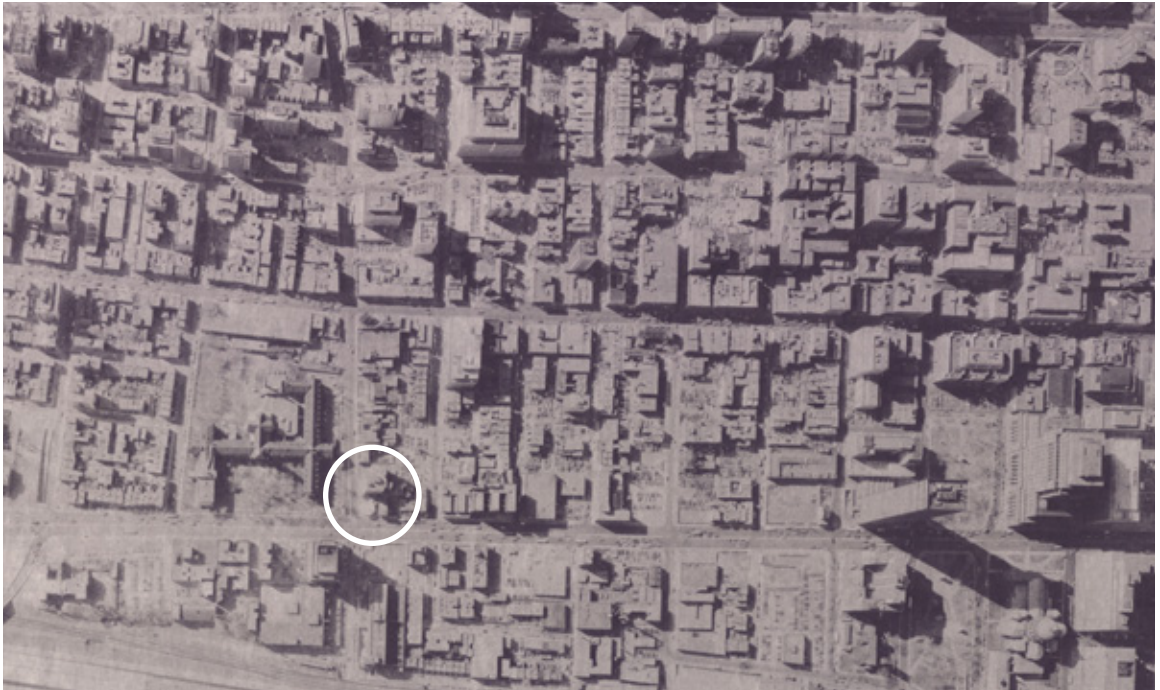
1973. (Détail) Photo aérienne