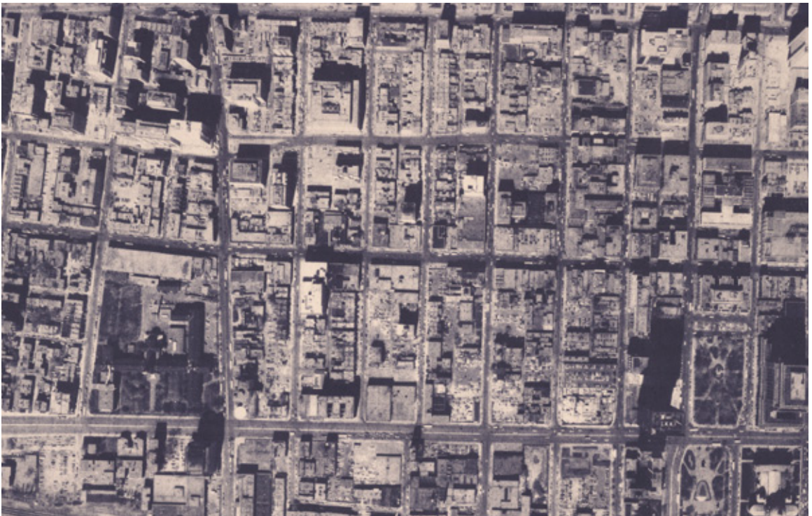
1975. (Détail) Photo aérienne