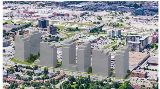
La proposition de densification

Au Mail Champlain , qui occupe un site à proximité de la station Panama du REM, le projet de densification implique le stationnement étagé et les abords d'une des voies d'accès du centre commercial (encadrés en rouge sur la photo). Six immeubles résidentiels totalisant 1 100 unités sont proposés.