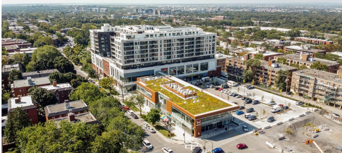
La résidence pour personnes âgées Cornelius, intégrée au Centre commercial Wilderton, à Montréal. Une partie du centre commercial a été conservée (et rénovée) en façade sur Van Horne en plus du rez-de-chaussée de l'immeuble résidentiel (en arrière-plan) qui demeure à l'usage commercial. La portion résiduelle du stationnement occupe l'arrière de la propriété.

Un autre exemple de ce modèle est celui des Galerias de Lachine . Une grande partie du centre commercial sera démolie pour faire place à quatre immeubles résidentiels. Mais une portion sera conservée (grand supermarché et station d'essence, encadrés en rouge sur les photos). La partie centrale du site est réaménagée pour le stationnement et les voies de circulation locales et pédestres.