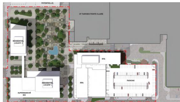
Le phase 1 du projet, adjacente au centre commercial

Un véritable quartier sera créé avec plusieurs rues locales, des espaces verts et une place publique intéressante pour faire l'interface entre le centre commercial et le quartier résidentiel. À terme, il regroupera