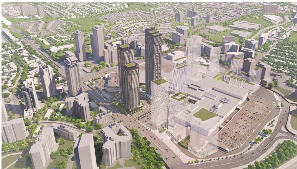
Un exemple de densification d'une grande propriété commerciale : le centre CF Fairview à Toronto.

Ce mémoire vise à démontrer que la densification de propriétés commerciales à des fins résidentielles est une tendance structurante et bien réelle dans la région montréalaise. Ce phénomène, généralisé à l'Amérique du Nord, prend de l'ampleur depuis une dizaine d'années grâce à une combinaison de facteurs parmi lesquels figure la baisse de l'achalandage des centres commerciaux et la sous-utilisation corollaire de leurs aires de stationnement.