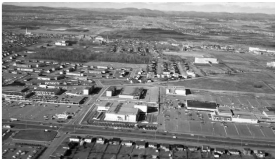
Place Laurier (Laurier Québec) vers 1965.

Plusieurs grands centres commerciaux, sortis de terre dans les années 1960 avec le développement des banlieues de première couronne, occupent des sites stratégiques à l'intersection d'axes routiers majeurs. Au moment de leur inauguration, ils étaient encore à la périphérie de la ville. Aujourd'hui, ils sont au cœur des quartiers et de l'activité.