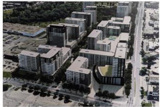
Projet de redéveloppement du Carrefour Langelier

La présence éventuelle de la station Langelier de la future ligne bleue du métro a incité les propriétaires (Groupe Mach) de repenser à la vocation de ce centre commercial en perte de vitesse. Un ensemble de tours résidentielles jusqu'à 20 étages seront aménagées pour former un quartier intégré qui accueillera, à terme, 4 500 ménages. Le commerce aura pignon sur rue au rez-de-chaussée des immeubles.