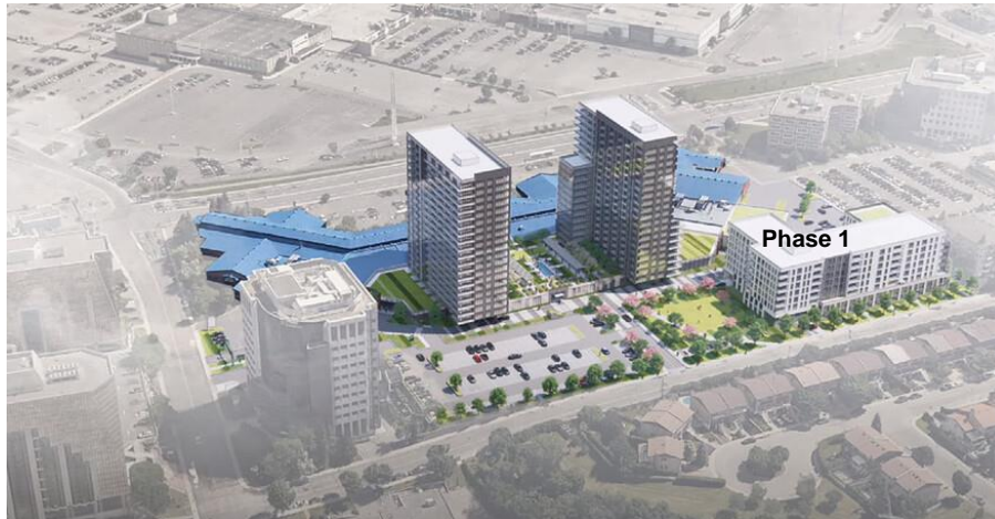
Projet de densification du site des Halles d'Anjou