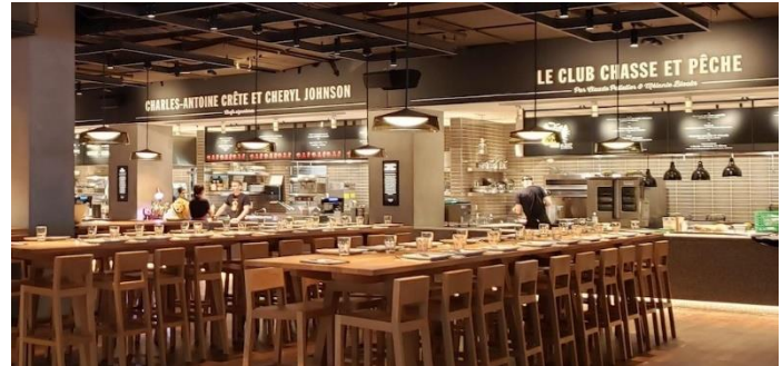
Time Out Market au Centre Eaton de Montréal

Les « foodhalls » et les marchés publics sont devenus de véritables emblèmes. Basés sur le concept des économies d'agglomération 2 , les regroupements de commerces et de spécialistes alimentaires permettent de créer une destination unique, diversifiée et attractive. La qualité et l'étendue de l'offre ainsi réunie permettent d'attirer un éventail de consommateurs avec des goûts et des exigences disparates.