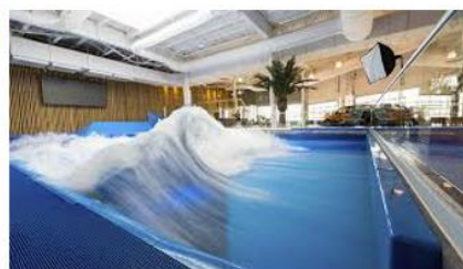
Oasis Surf au Quartier Dix30