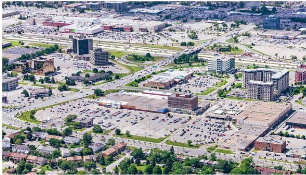
Le centre commercial SmartCentres Pointe-Claire actuellement

La propriété de SmartCentres à Pointe-Claire , en bordure du boulevard Hymus, est de calibre communautaire. Leur projet propose d'implanter une série d'immeubles résidentiels à l'avant du stationnement, directement sur le boulevard. Le centre commercial, à l'arrière, resterait intact (sauf une petite portion).