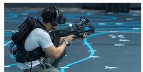
Centre de réalité virtuelle Zero Latency