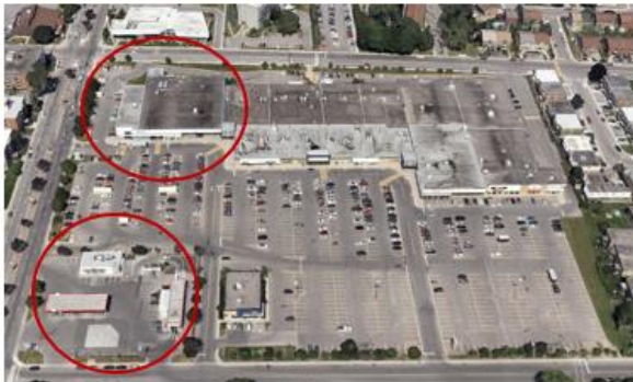
Galerias de Lachine actuellement

Un autre exemple de ce modèle est celui des Galerias de Lachine . Une grande partie du centre commercial sera démolie pour faire place à quatre immeubles résidentiels. Mais une portion sera conservée (grand supermarché et station d'essence, encadrés en rouge sur les photos). La partie centrale du site est réaménagée pour le stationnement et les voies de circulation locales et pédestres.