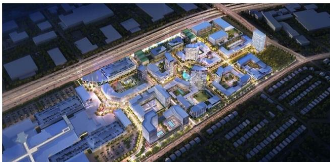
Le projet (à terme) du centre commercial Fairview Pointe-Claire

Le projet de Cadillac Fairview à Pointe-Claire s'inscrit dans le prolongement du centre commercial existant. Il occupe les terrains adjacents de ce centre commercial de calibre suprarégional, à la hauteur d'une station du REM.