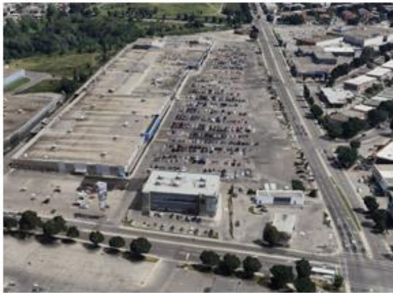
Carrefour Langelier actuellement

Le projet de redéveloppement du Carrefour Langelier , à l'intersection du boulevard Langelier et de la rue Jean-Talon Est, en est un bon exemple.