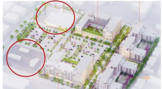
Projet de redéveloppement des Galerias de Lachine