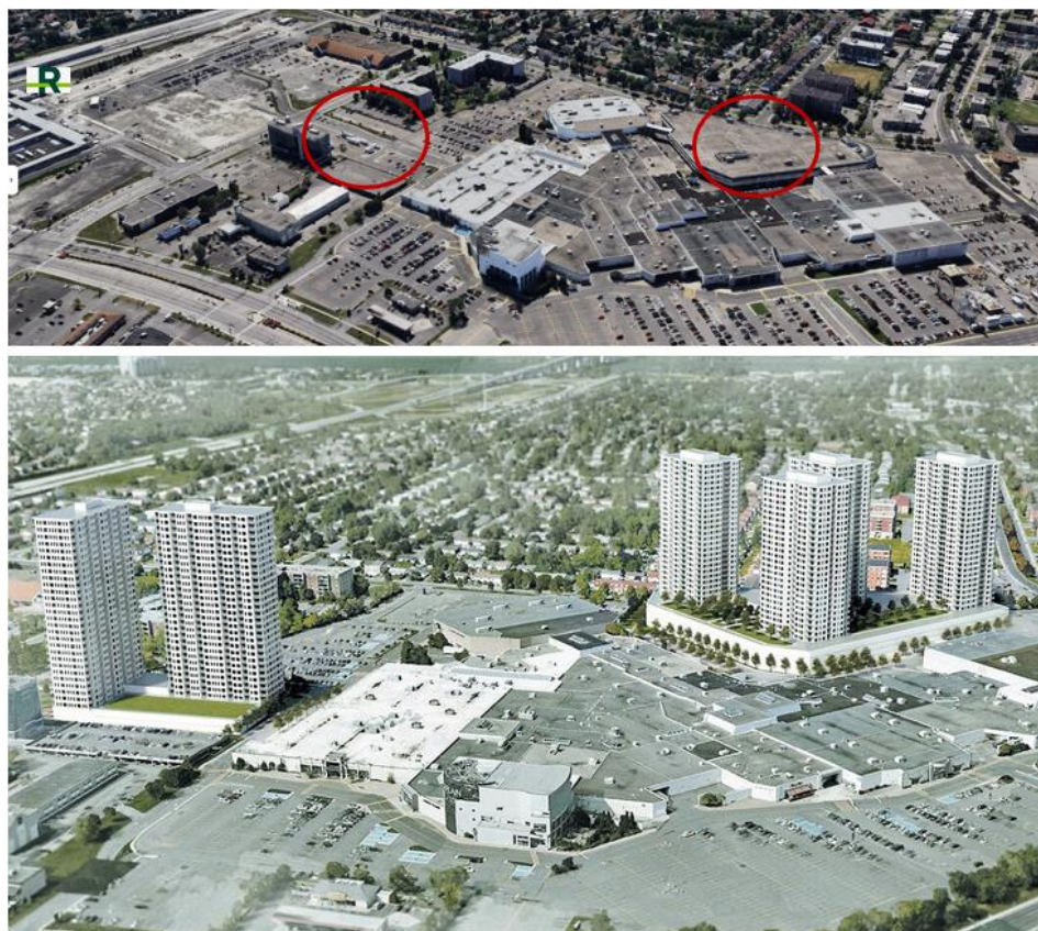
Projet de densification du Mail Champlain