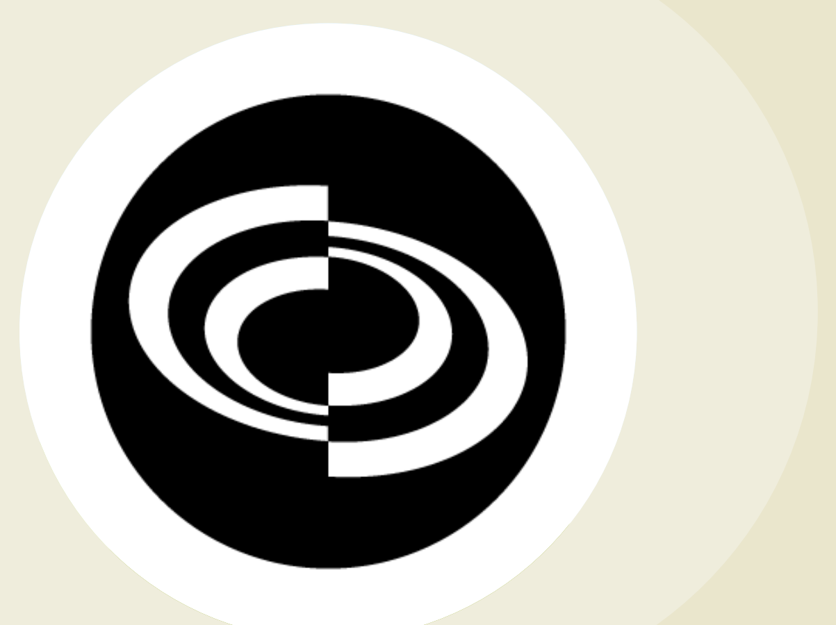
Caisse de dépôt et placement du Québec