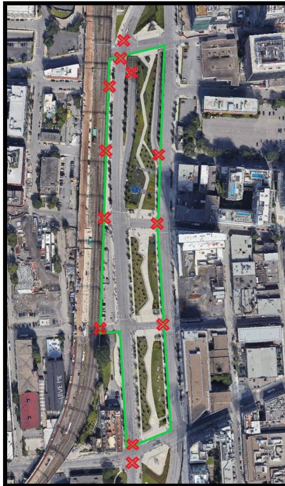
Image 5. Emplacement des rues fermées

Pour réaliser cette vision d'un parc linéaire consolidé, certaines rues et bretelles d'autoroute devront être fermées.