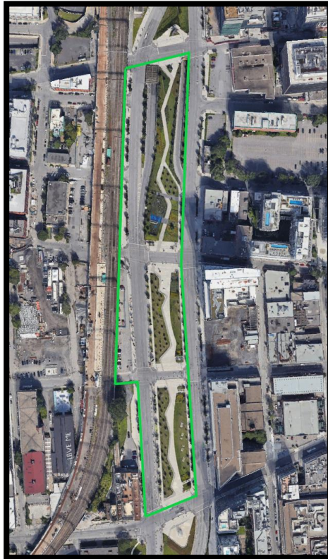
Image 4. Périmètre potentiel pour la vision du parc.

Le futur parc d'Entrée de ville Bonaventure serait formé par les trois sections de parc actuel et serait agrandi vers l'ouest en prenant les voies vers le sud de cette section du boulevard Robert-Bourassa. Les portions de rues qui traversent le parc seraient fermées pour permettre un grand parc sans discontinuité. Une station du REM est déjà prévue à cet endroit et cette grande place serait un atout intéressant. Avec cette nouvelle configuration, ce parc deviendrait le plus grand parc de la section sud du centre-ville. Le parc serait donc délimité par la rue Notre-Dame au nord, par Wellington au sud, par le boulevard Robert-Bourassa à l'est et par l'emprise ferroviaire à l'ouest.