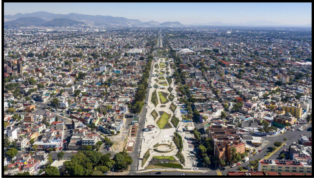
Image 2. Parc linéaire de Mexico.