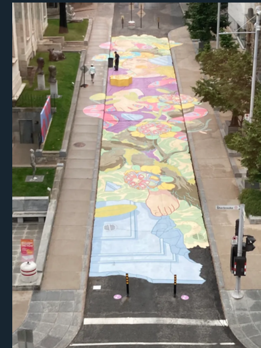
Niamh" by artist Doras