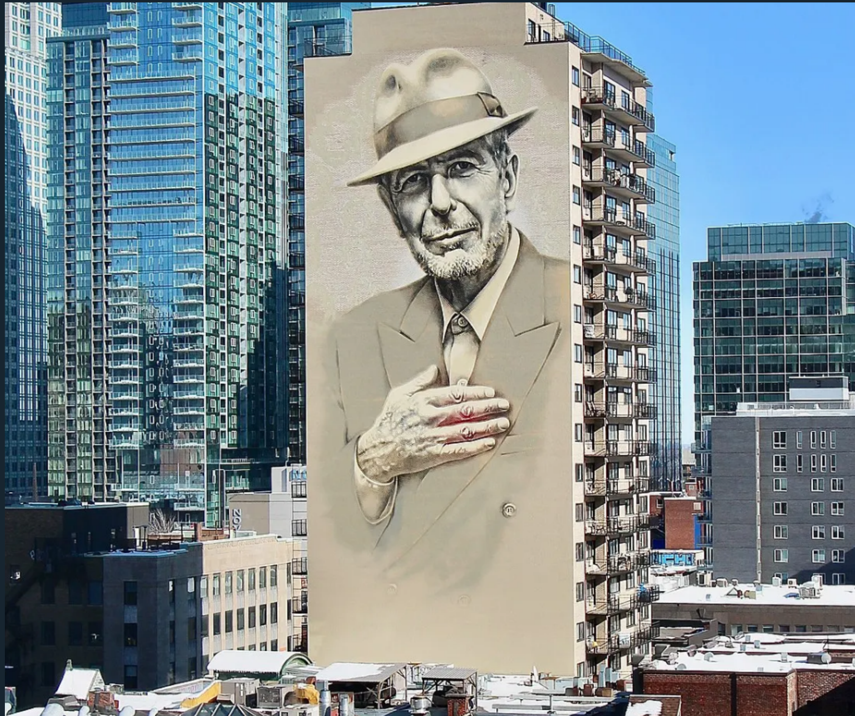
Peinture murale de Leonard Cohen à Montréal