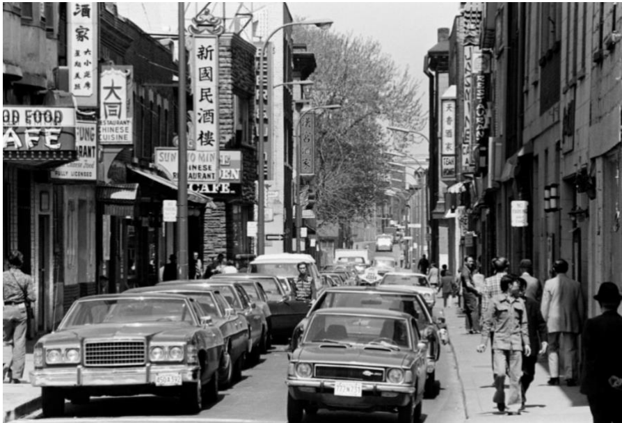
Rue De la Gauchetière en 1975

Cette section propose quatre grandes conditions de succès ainsi que les prochaines étapes de l'élaboration et la mise en œuvre du plan d'action. Les conditions de succès présentées par le Centre d'écologie urbaine de Montréal sont basées sur son expérience de la démarche participative et des relations avec la communauté du Quartier chinois. Elles visent à créer une fondation solide pour mieux encadrer la mise en œuvre du plan d'action de développement du Quartier chinois de Montréal.