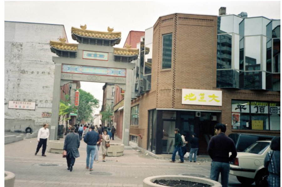
Rue De la Gauchetière entre 1960 et 1970