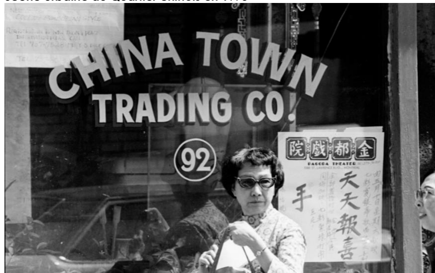
Scène urbaine du Quartier chinois en 1975

Une présentation publique de la démarche de consultation et du plan d'action, traduite en quatre langues (français, anglais, cantonais et mandarin) sera mise en ligne sur la page internet Réalisons Montréal. Un outil sera également disponible afin de recueillir les questions, commentaires et réactions que suscitent le rapport et le plan d'action.