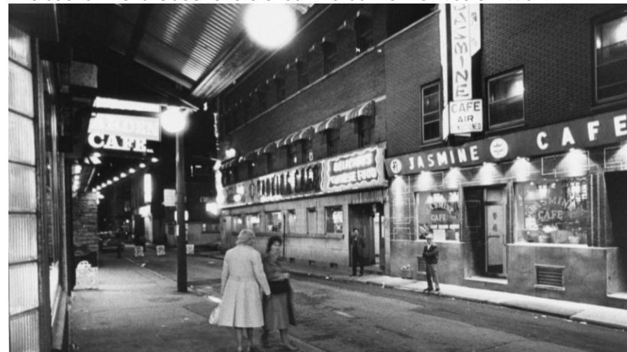
Intersection De la Gauchetière et Saint-Urbain entre 1960 et 1970