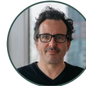
Pascal Harvey Urbaniste Sid Lee Architecture