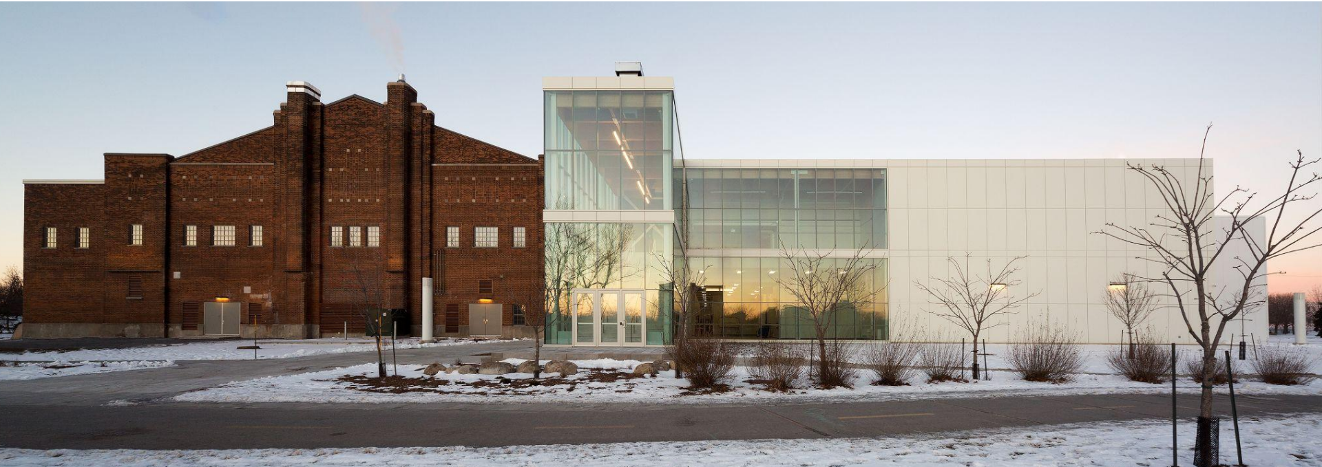
Restauration de l'Auditorium de Verdun, avec agrandissement contemporain, Arr. Verdun Lauréat du Grand Prix Opération patrimoine Montréal 2021