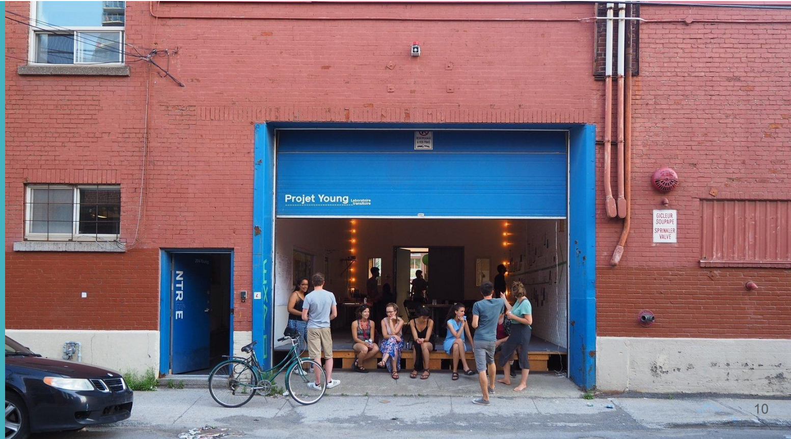
Projet Young : projet pilote d'occupation transitoir, Arr. Le Sud-Ouest