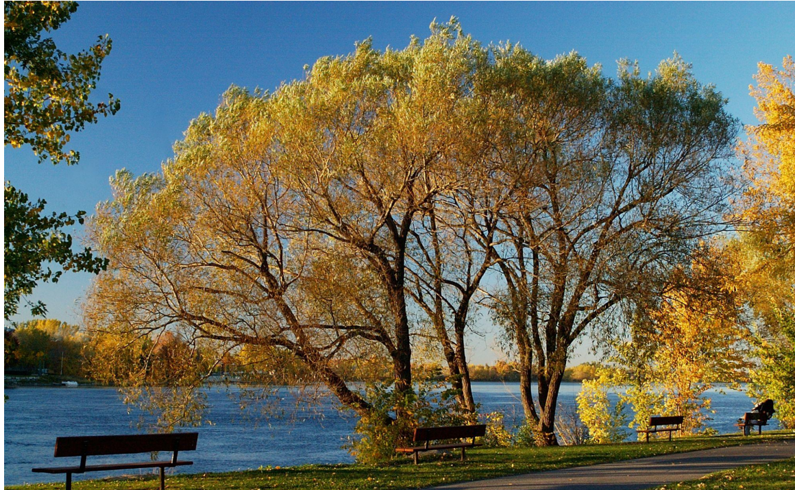
Arr. Montréal Nord