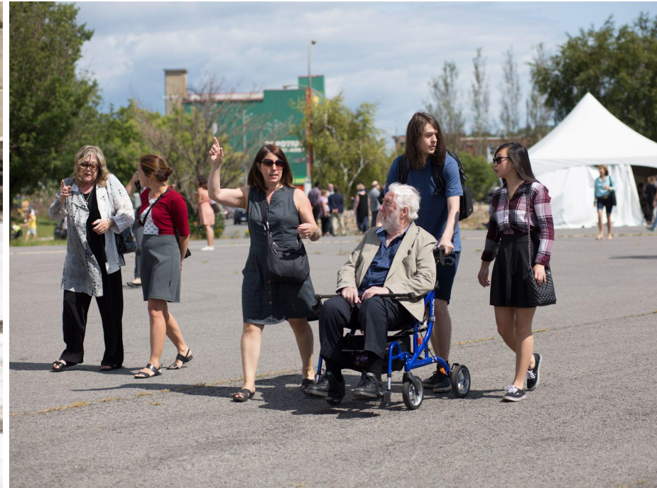
Parc Frédéric-Back, Arr.Villeray–Saint-Michel–Parc-Extension