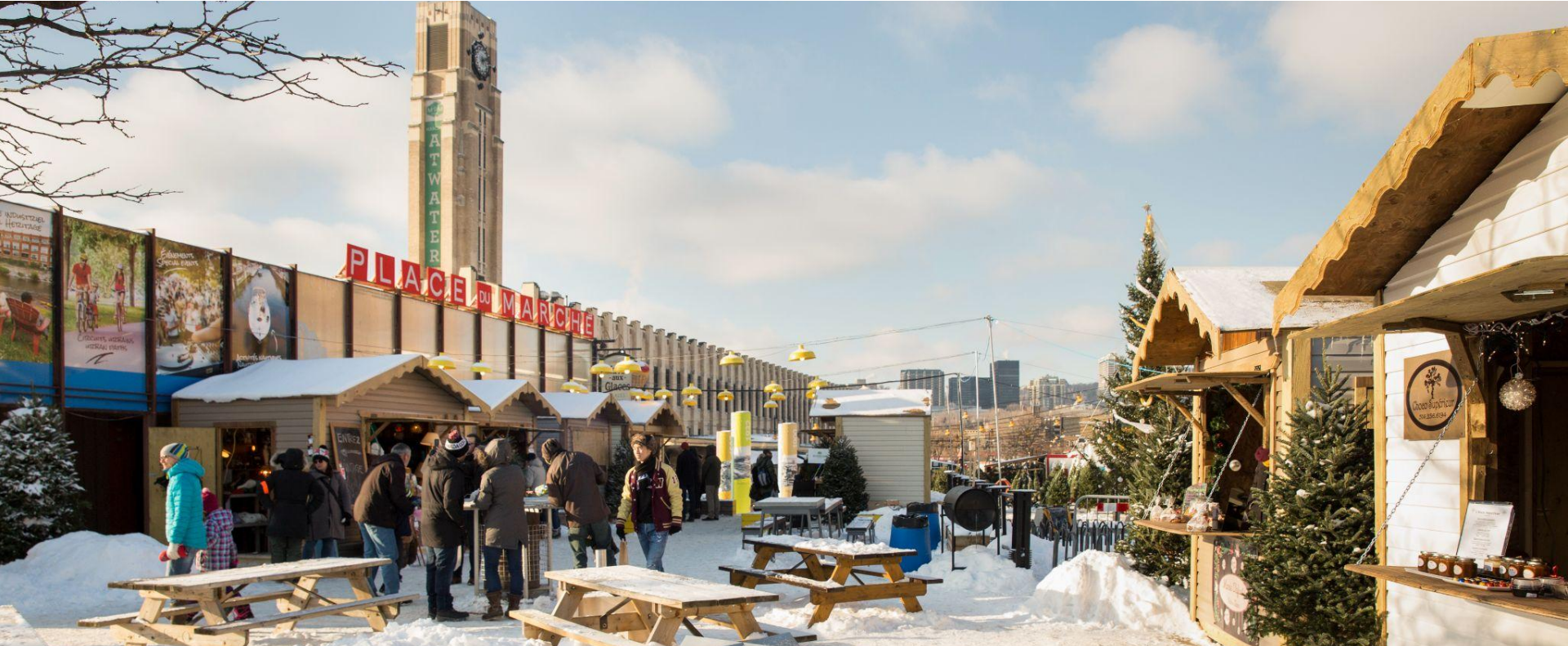
La Place du Marché en hiver, Arr. Le Sud-Ouest