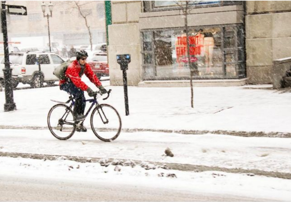
Vélo d'hiver, Arr. Ville-Marie