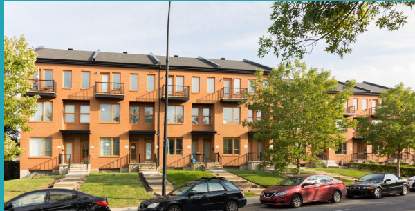
Projet Perras, Arr. Rivière-des-Prairies-Pointe-aux-Tremble