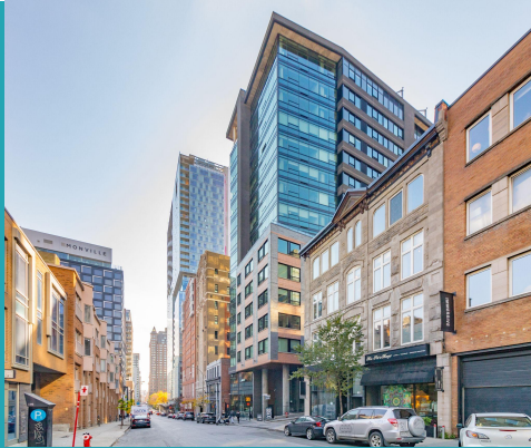
Rue de Bleury, Arr. Ville-Marie