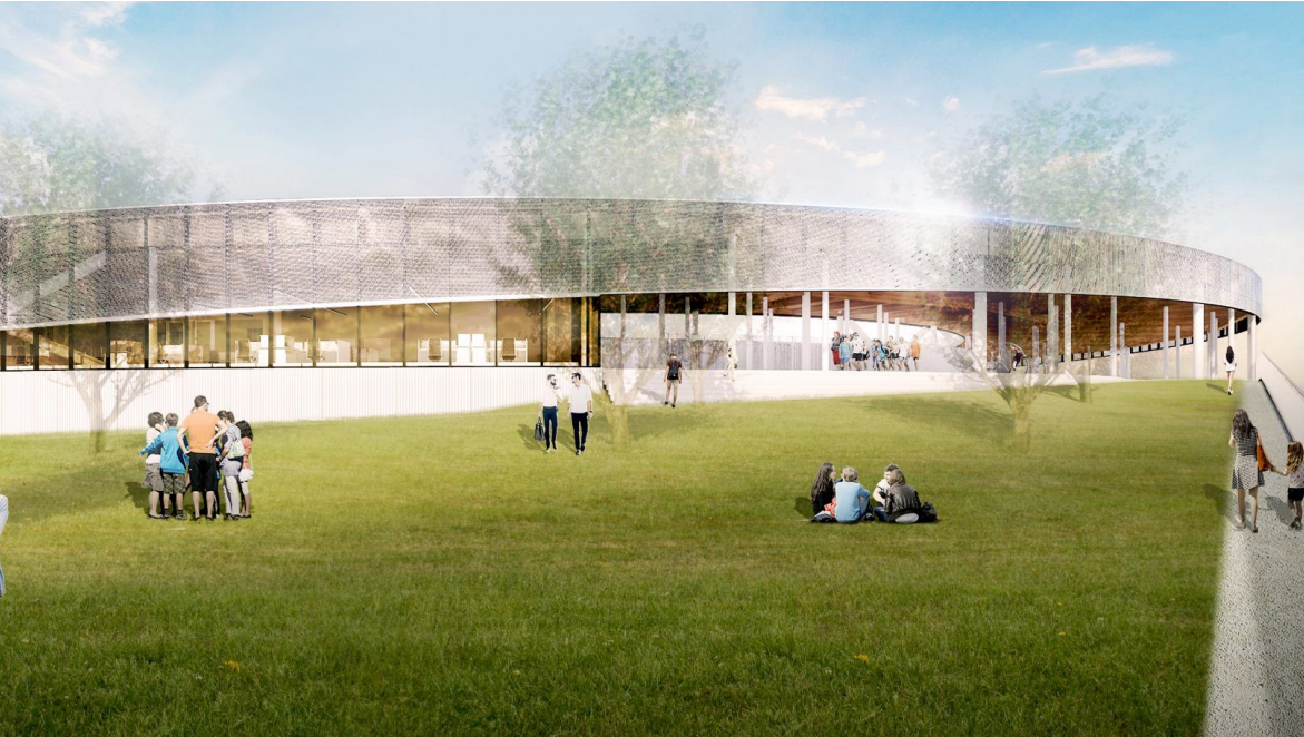
Centre de transport Bellechasse : intégration d'un garage souterrain recouvert par une plateforme végétalisés accessible au public, Arr. Rosemont-La Petite-Patrie