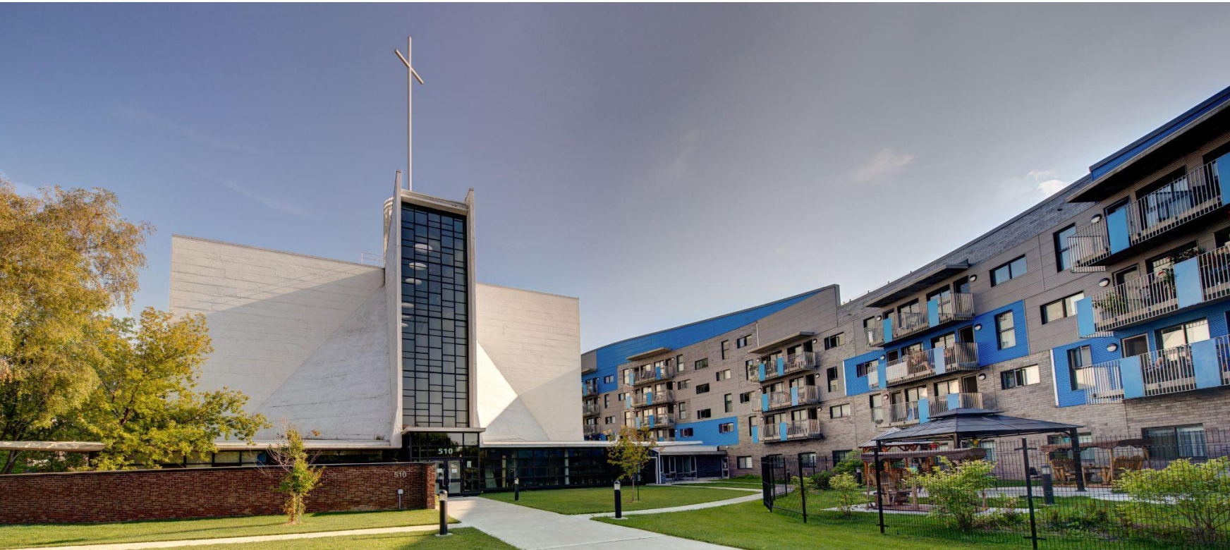
Site des Habitations Sainte-Germaine-Cousin : logements communautaires pour personnes âgées et ancienne église avec un centre de la petite enfance et une salle communautaire, Arr. Rivière-des-Prairies– Pointe-aux-Trembles