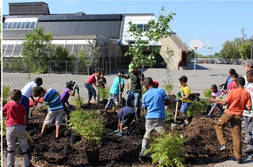
Plantation de végétaux, Arr. Montréal-Nord