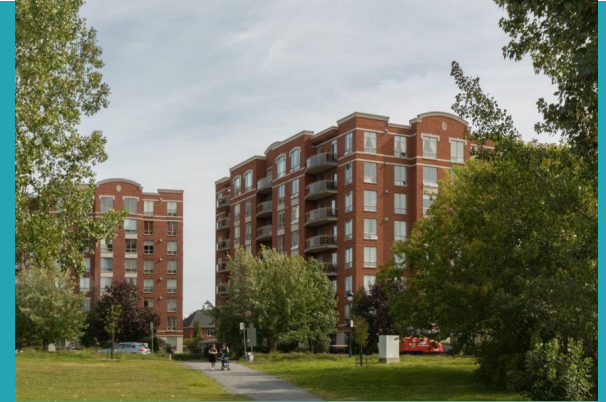
Anjou sur le lac, Arr. Anjou