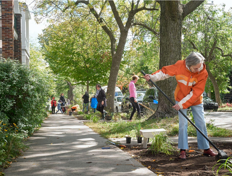
Jardin de rue, Arr. Rosemont–La Petite-Patrie