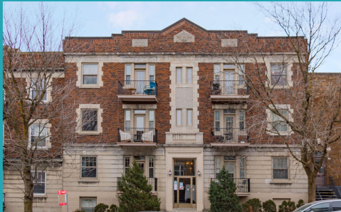
Conciergerie, Arr. Outremont