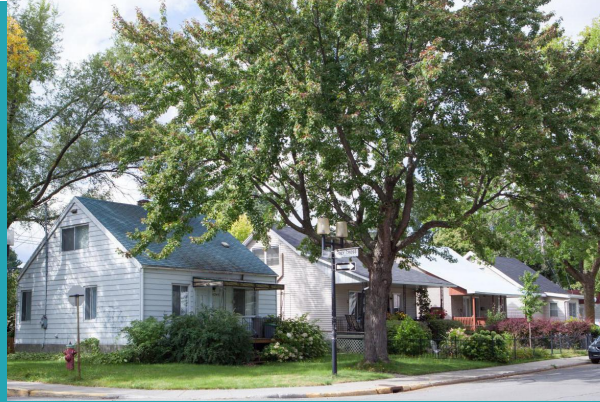
Quartier Ville-Émard, Arr. Le Sud-Ouest