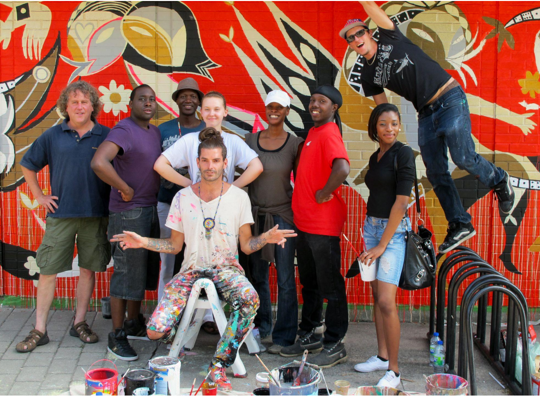
Murale, Médiation culturelle