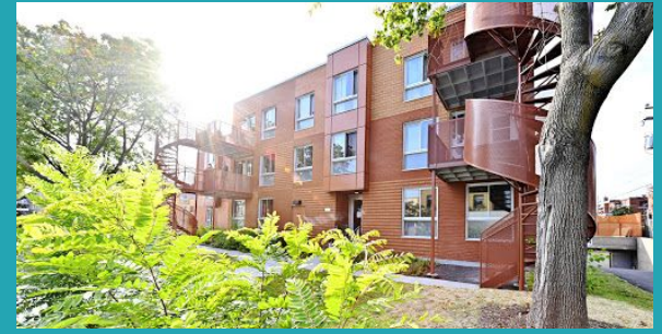
Habitations-Saint-Michel-Nord, Arr. Villeray-Saint-Michel-Parc-Extension