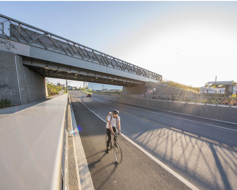
Projet MIL Montréal : réaménagement du pont ferroviaire, Arr. Outremont