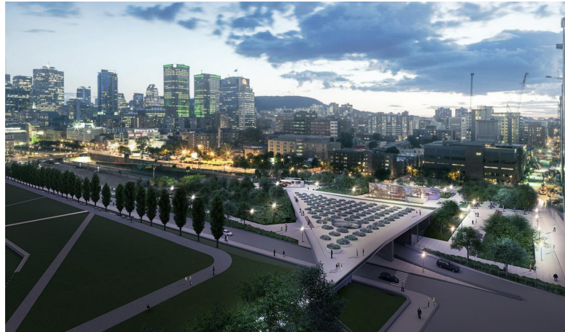
Perspective d'ambiance de la future Place des montréalaises (station de métro Champs-de-Mars), Arr. Ville-Marie