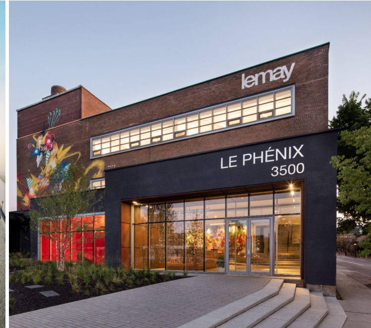
Conversion d'un ancien bâtiment industriel qui intègre plusieurs pratiques exemplaires en efficacité énergétique, Arr. Le Sud-Ouest