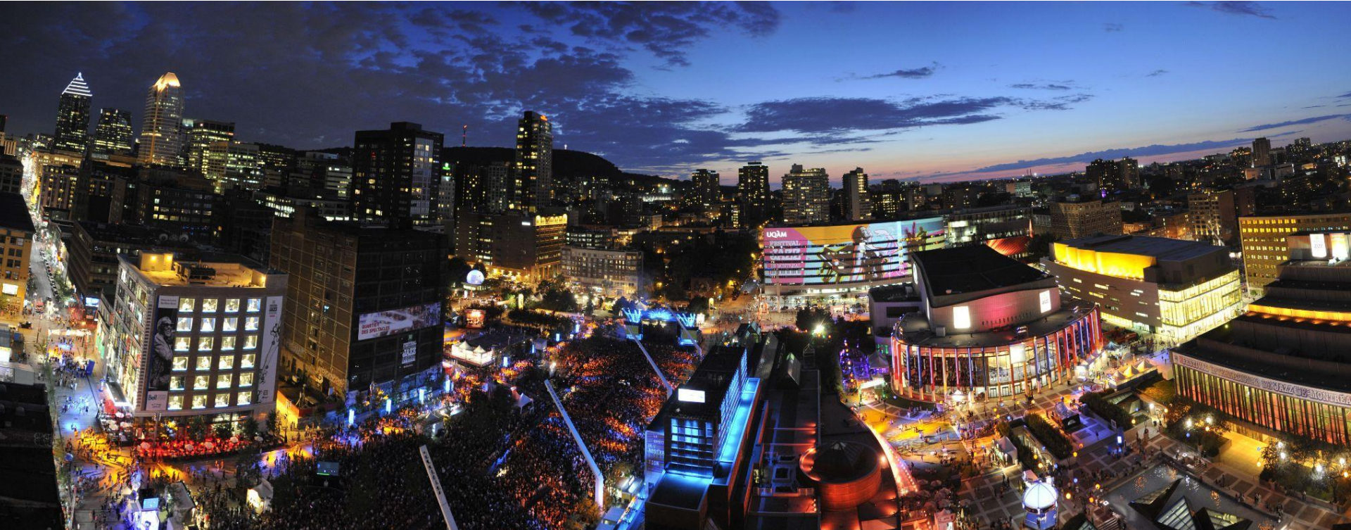
Quartier des spectacles, Arr. Ville-Marie