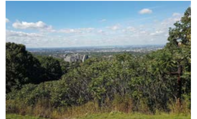
2 Djodjâghé Otchira'ghéné