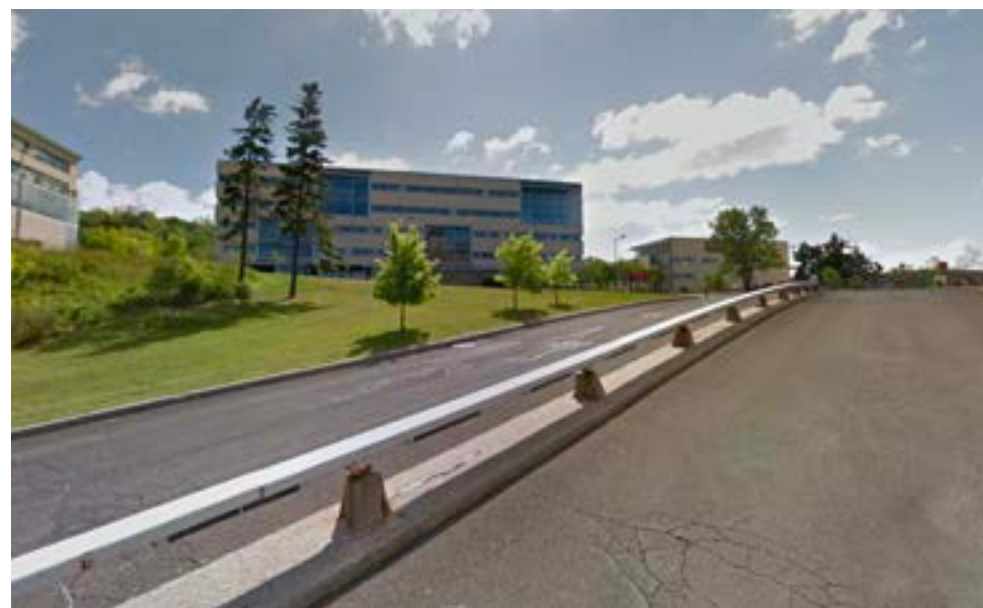
5 Vue du Chemin de la Rampe, vers le sud