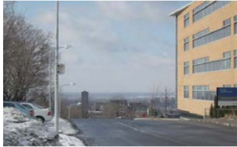
L Chemin Polytechnique de l'Université de Montréal

VUES EXTRAITES DU DOCUMENT COMPLÉMENTAIRE DU PLAN D'URBANISME (VUES D'INTÉRÊT DEPUIS LE MONT-ROYAL ET VERS LE MONT-ROYAL)