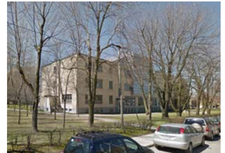
13 Vue de l'avenue de Darlington

NOTE: VUES SÉLECTIONNÉES POUR L'ÉTUDE D'IMPACT VISUEL.