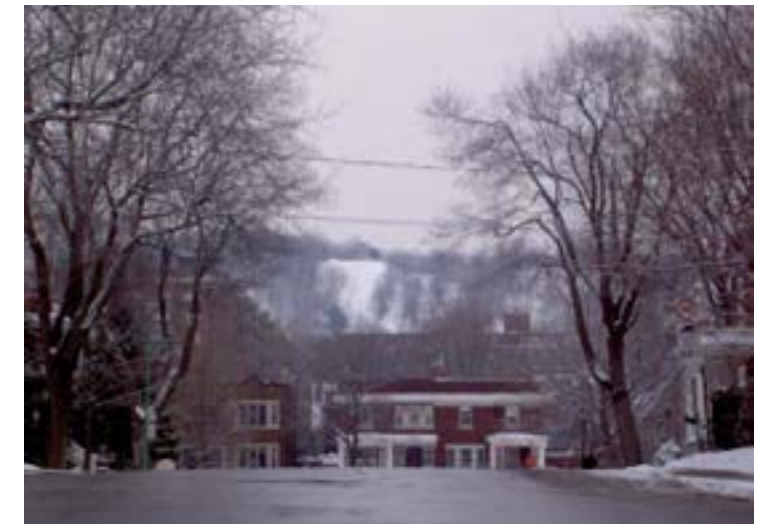
Avenue de Vimy