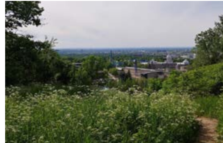
1 Parc Tiohtià ke Otsira'kéhne