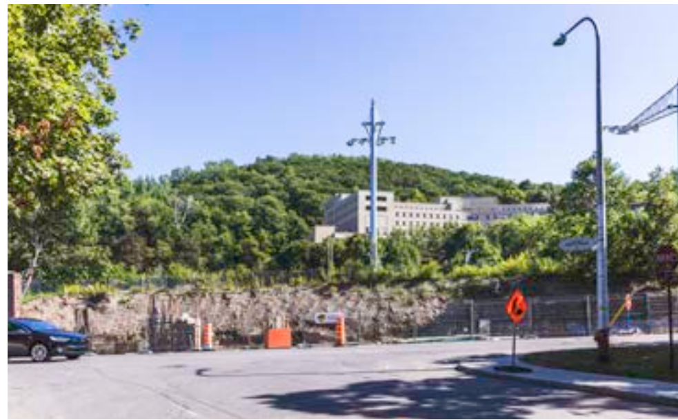
2 Vue depuis l'avenue Claude-Champagne / boulevard du Mont-Royal