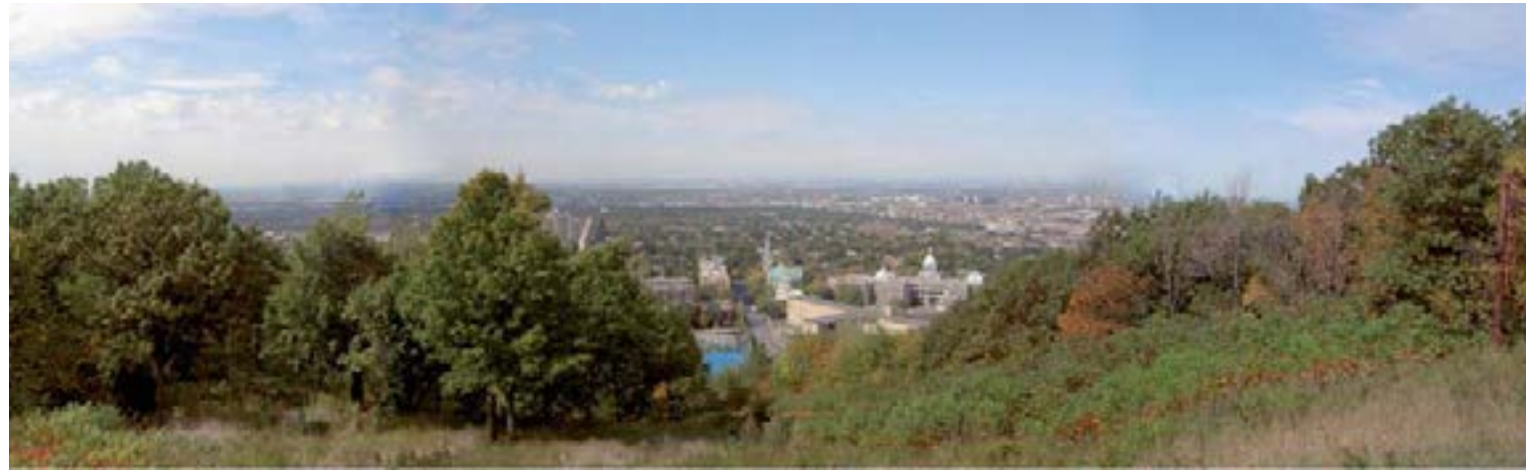
N Axe de l'avenue Vincent-D'Indy