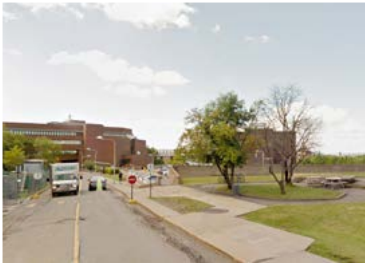
10 Vue du chemin de la Tour vers le pavillon Samuel-Bronfman