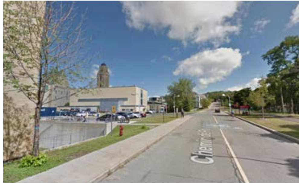
8 Vue du Chemin de la Polytechnique, vers l'est (non modélisée)