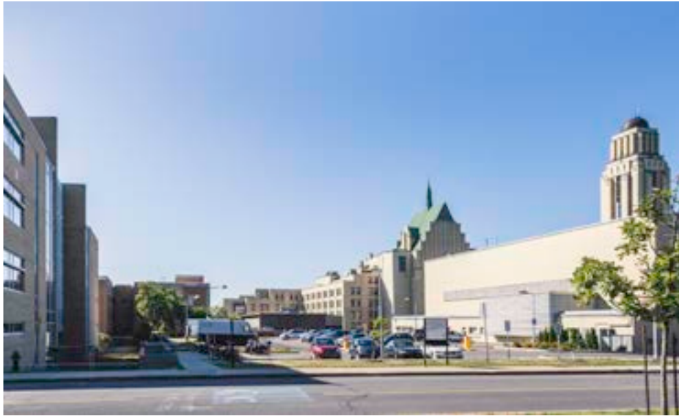
7 Vue depuis le chemin de Polytechnique, vers le nord

VUES PROPOSÉES POUR L'ÉTUDE D'IMPACT VISUEL DES PROJETS POTENTIELS