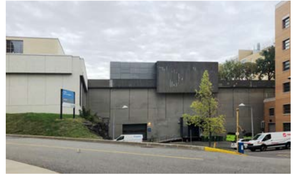
9 Vue depuis le chemin des services, vers le haut de l'escarpement