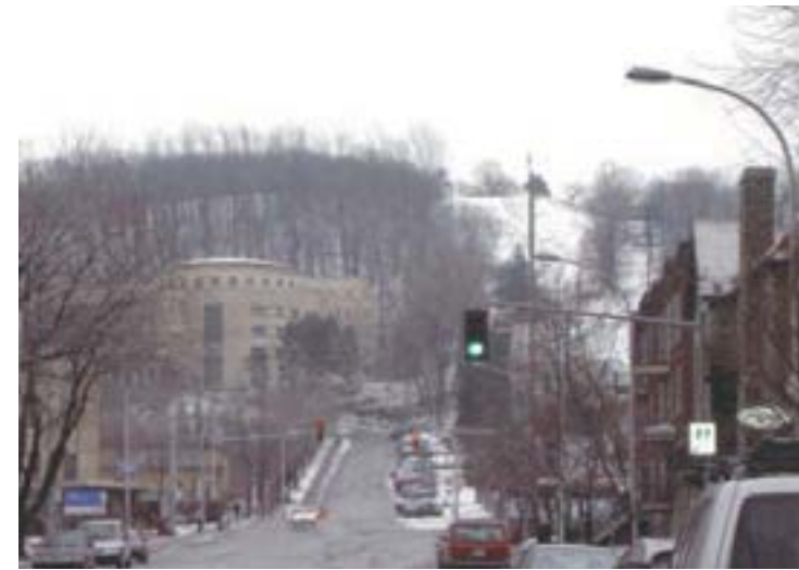
Avenue Vincent d'Indy