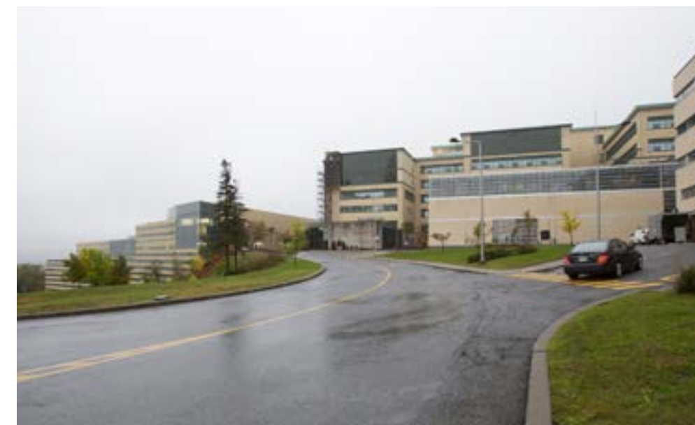
6 Vue depuis l'esplanade, vers la ville

NOTE: VUES SÉLECTIONNÉES SUR GOOGLE À TITRE INDICATIF. LES VUES SERONT PRISES SUR LE TERRAIN POUR FAIRE L'ANALYSE DE L'IMPACT VISUEL.