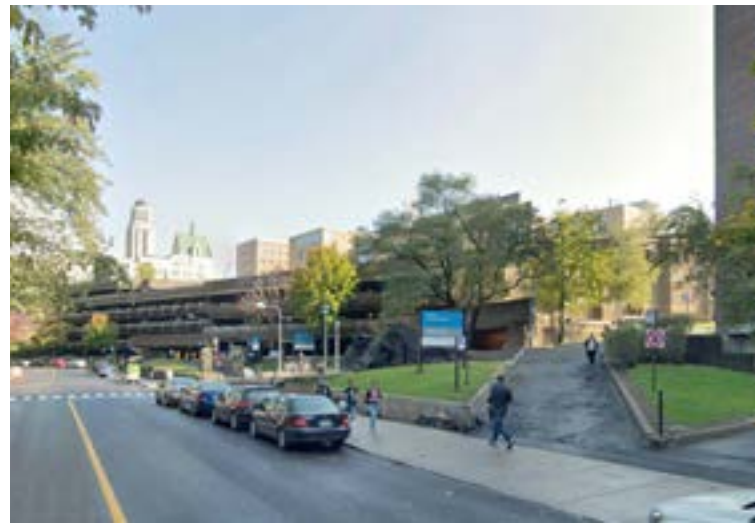
11 Vue depuis la rue Jean-Brillant, vers Roger-Gaudry