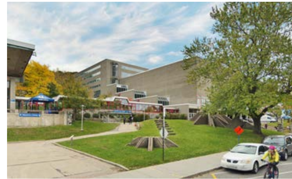
3 Vue du boulevard Edouard-Montpetit, vers l'ouest