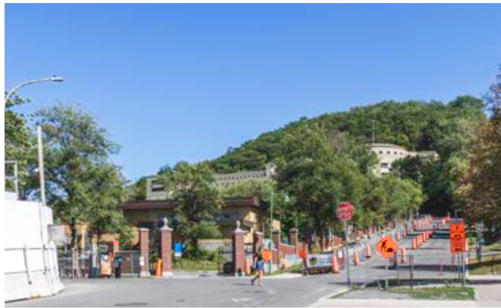
1 Vue de l'avenue Vincent-d'Indy

VUES SÉLECTIONNÉES POUR L'ÉTUDE D'IMPACT VISUEL DES PROJETS POTENTIELS