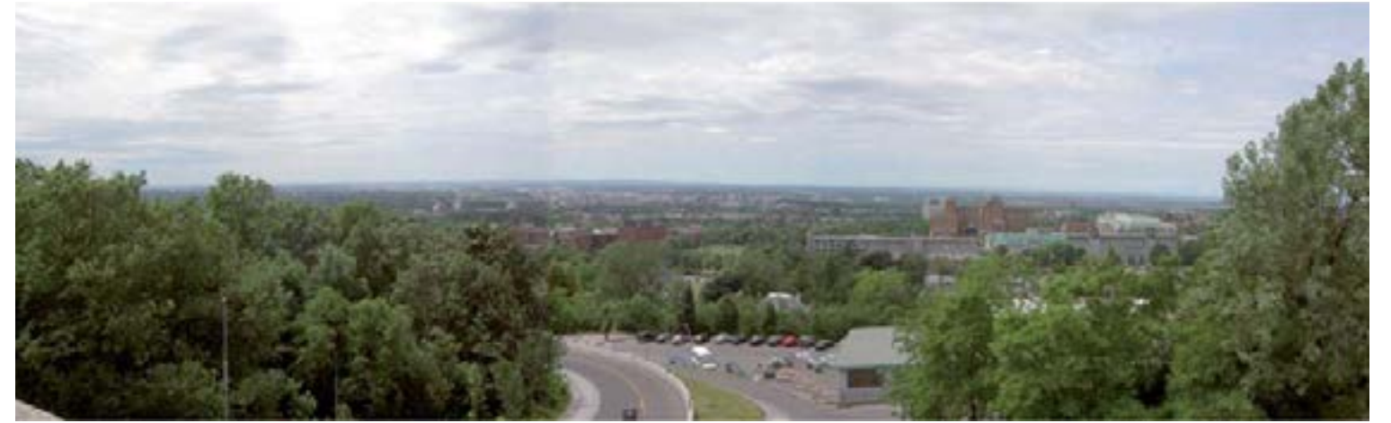
M Pavillon principal de l'Université de Montréal