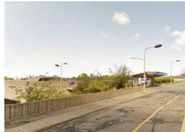
12 Vue du chemin de la Tour, dos au pavillon Samuel-Bronfman, vers Roger-Gaudry