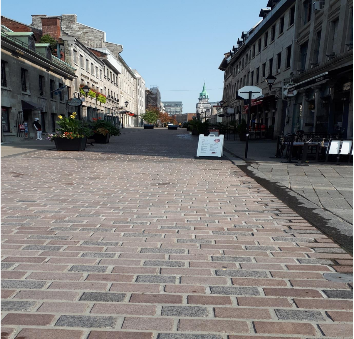
Figure 3 Saint-Paul et Place Jacques Cartier