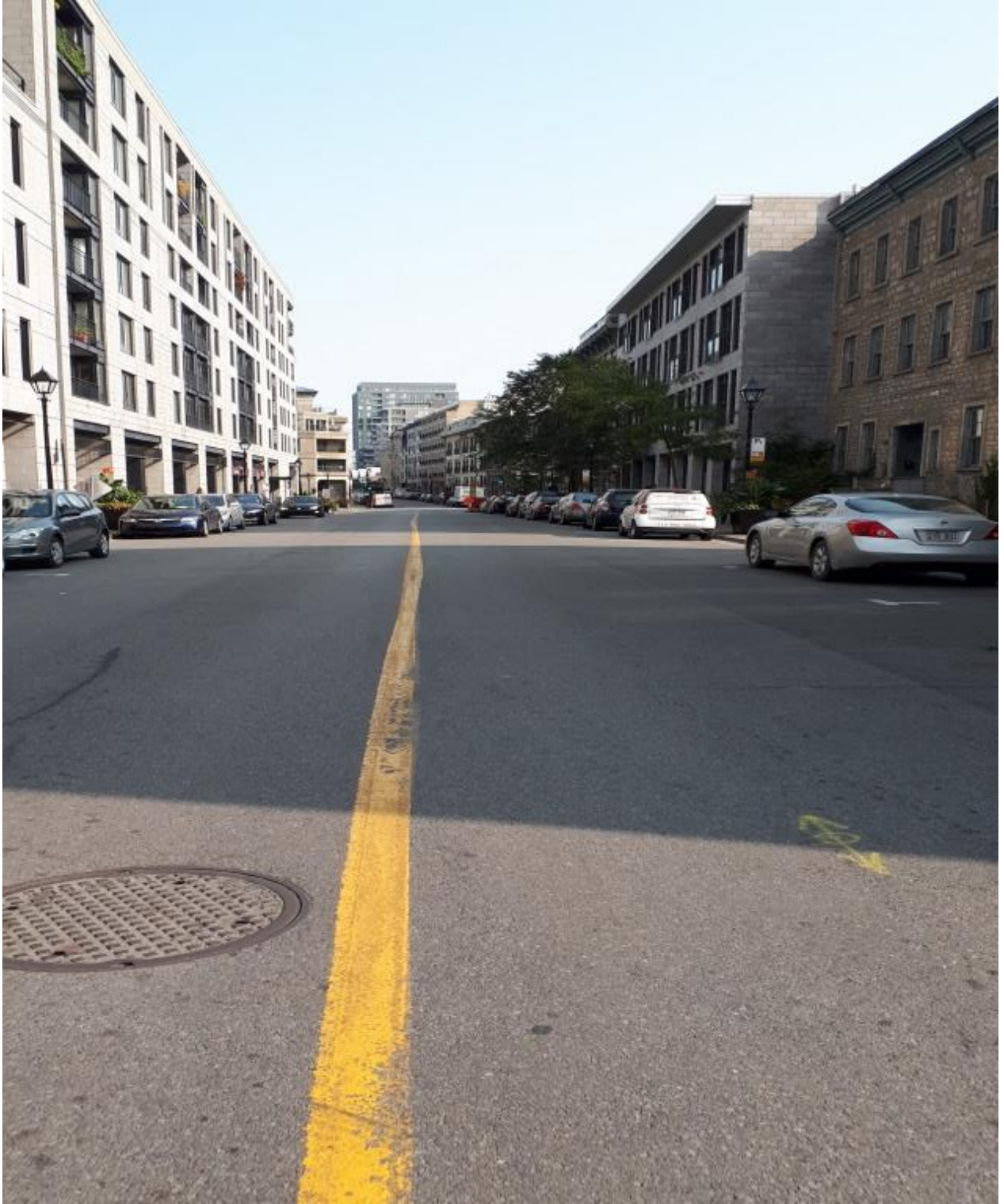
Figure 1 Rue Notre-Dame devant l'Hôtel de ville