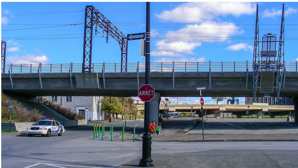
Intersection entre les rues de la Commune et Smith. Le remblai à été remplacé par un viaduc.

Pour oublier cette structure spectaculaire dont l'apparition va transformer le lieu, un autre centre d'intérêt doit attirer l'attention au niveau du sol. Le remblai qui supporte les voies ferrées, doit faire place à un viaduc entre les rues Du centre et Bridge. Ouvrant ainsi une grande fenêtre qui laissera entrevoir à la fois l'activité de la place et la nouvelle partie du quartier réhabilité.