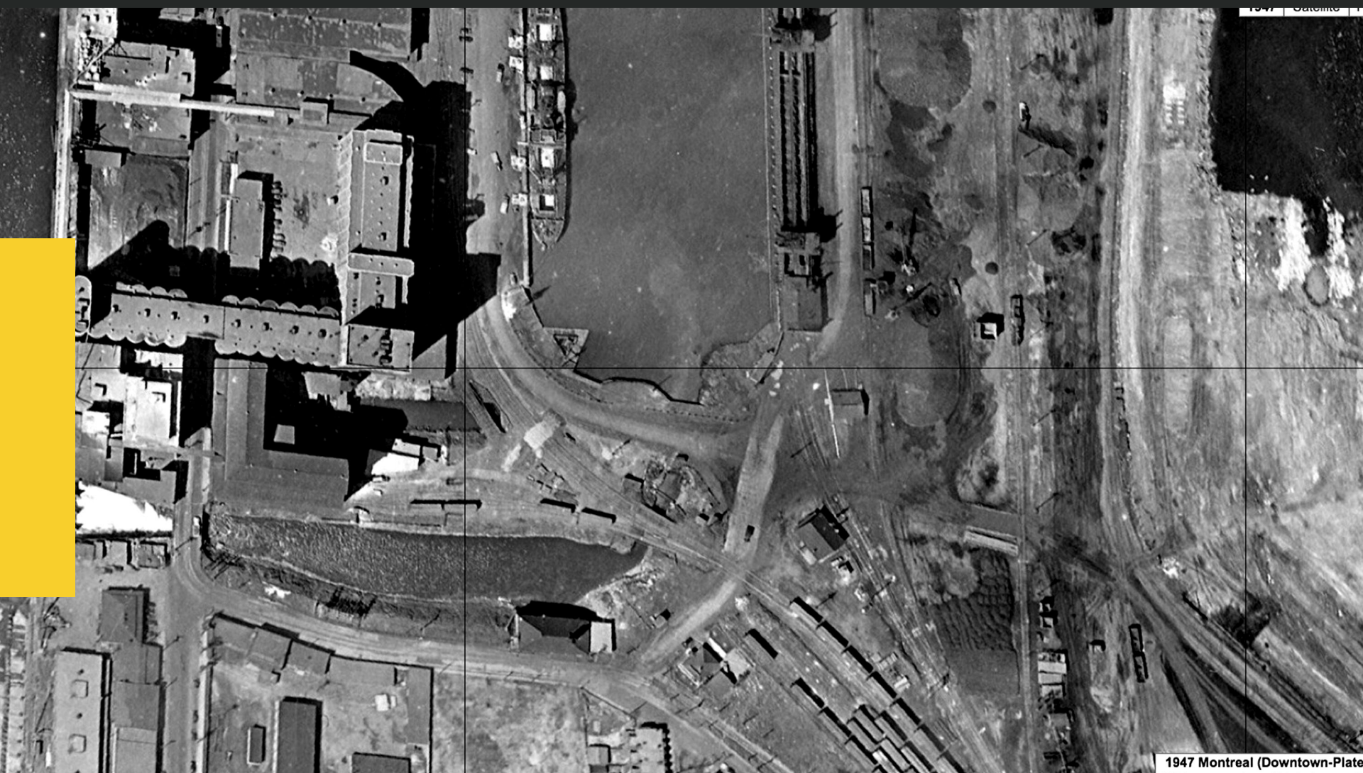
1947 Montreal (Downtown-Plateau)