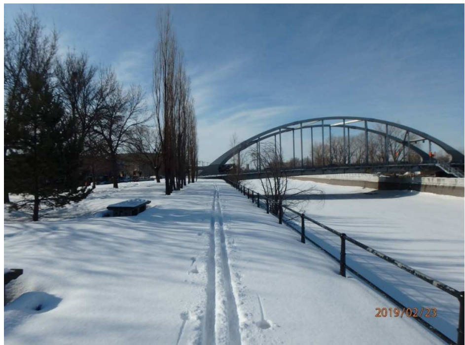
Pont Monk