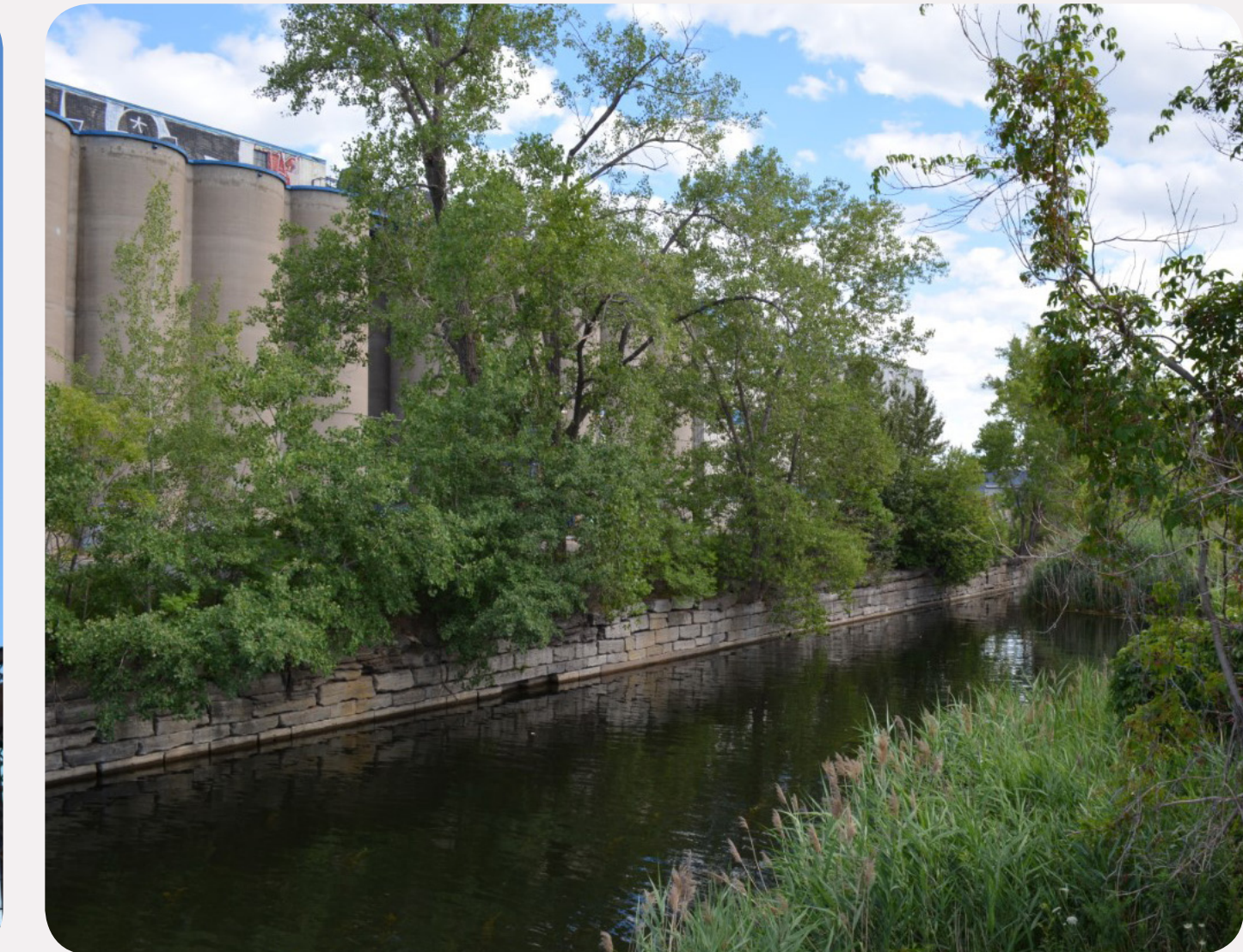
2. BASSIN WELLINGTON