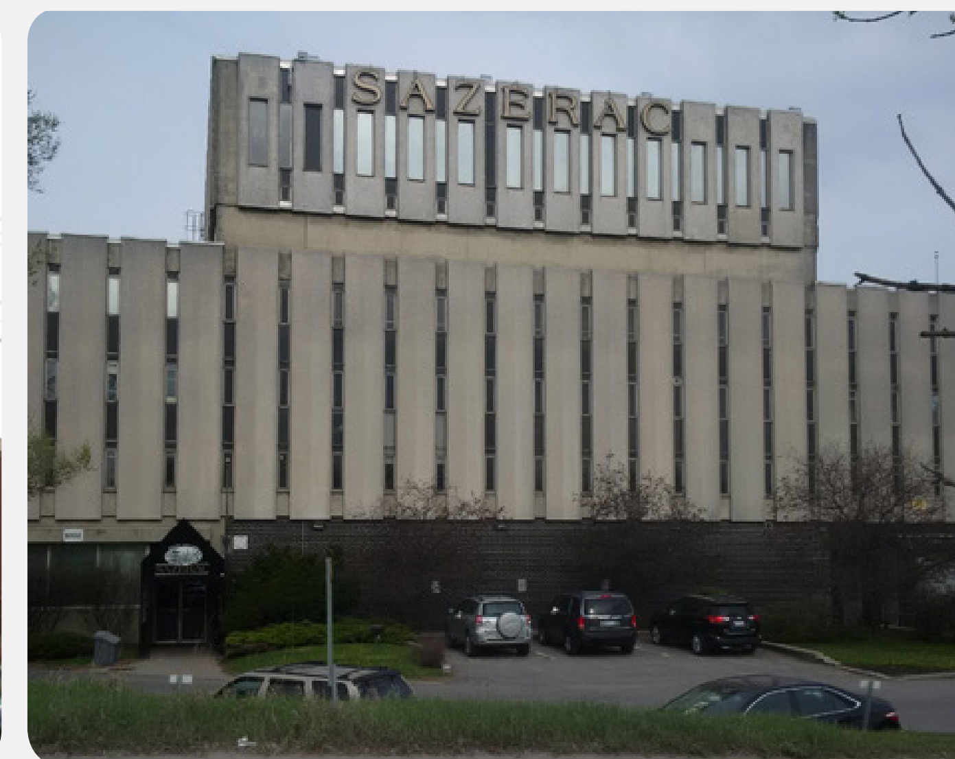
6. DISTILLERIE SAZERAC