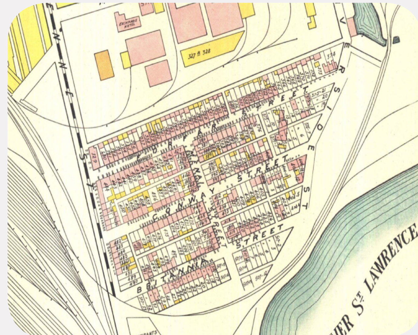
GOOSE VILLAGE, 1907