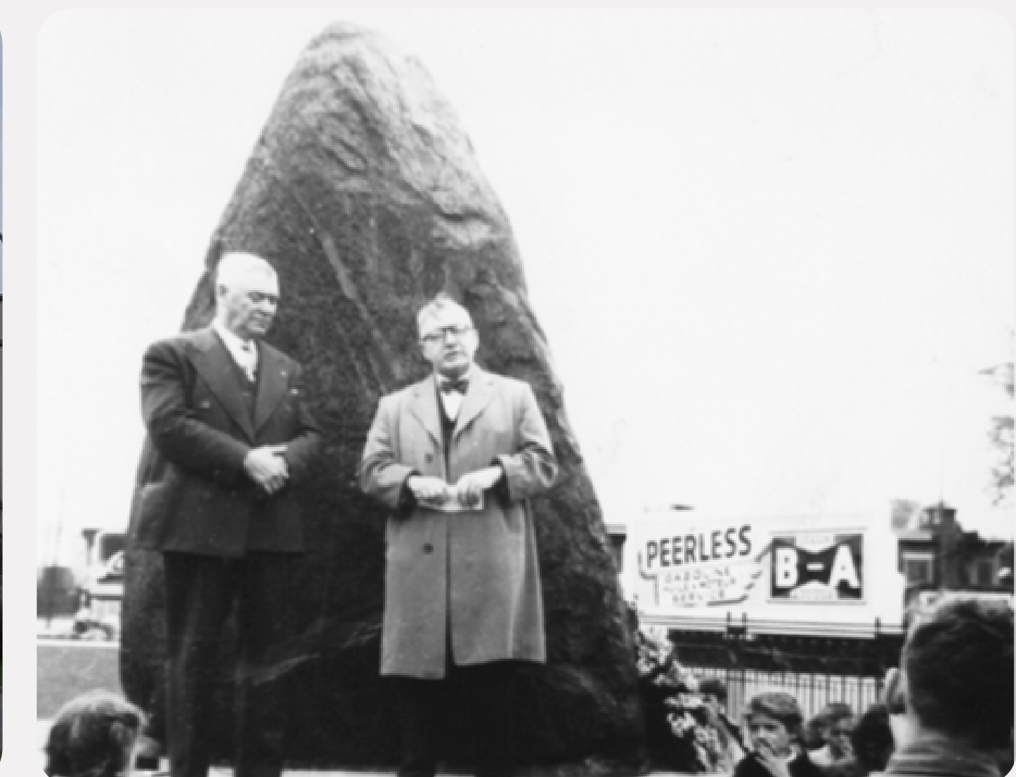
7. BLACK ROCK (ROC IRLANDAIS)