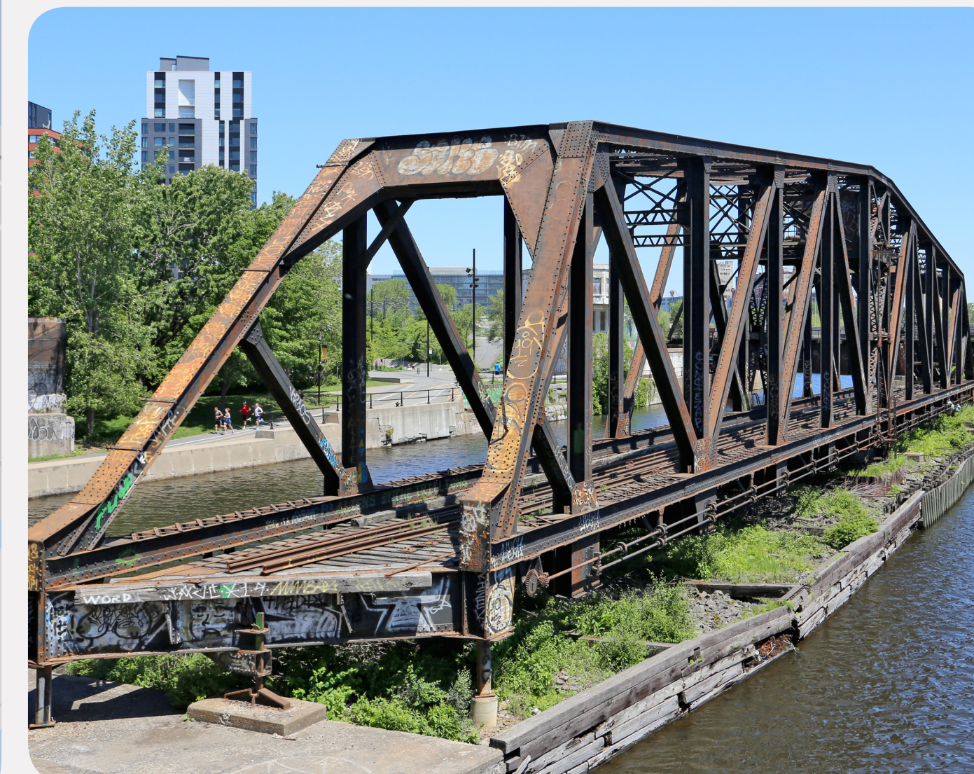
3. PONT PIVOTANT