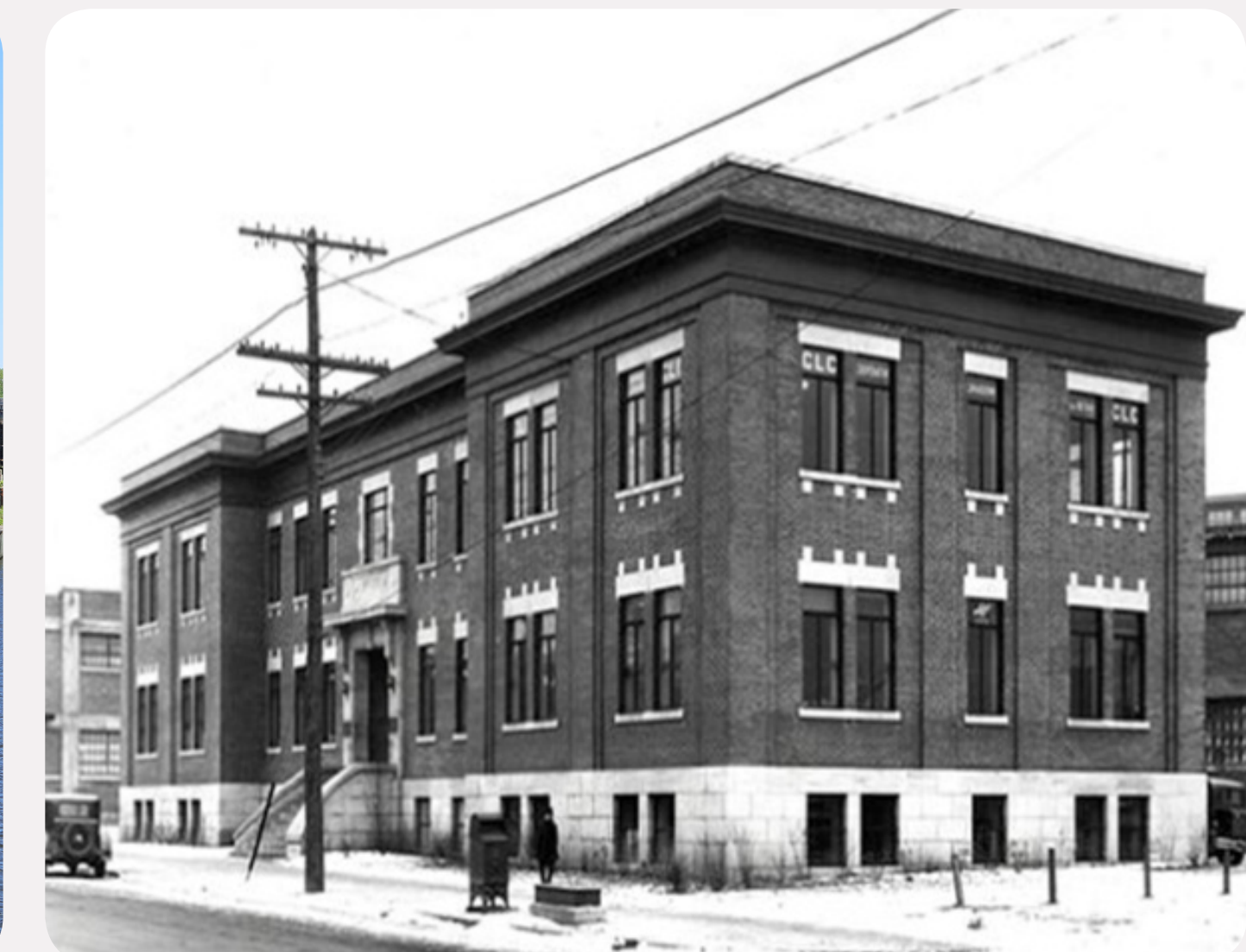
4. BUREAU DE DOUANES