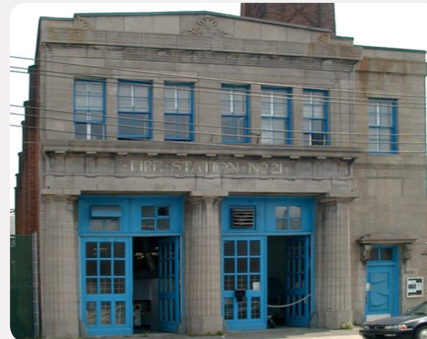
5. CASERNE 21