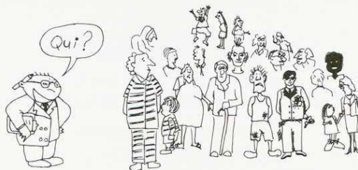
En matière de logement, chaque question a sa réponse, Infologis peut vous aider à la trouver.