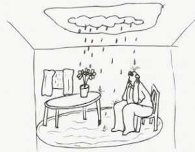
Vous n'avez plus besoin d'arroser vos plantes.