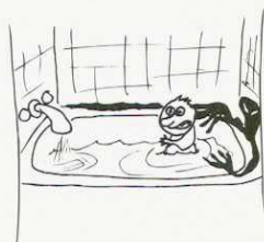
La moisissure vous envahit.