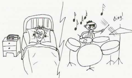
Votre voisin est un fan de musique?